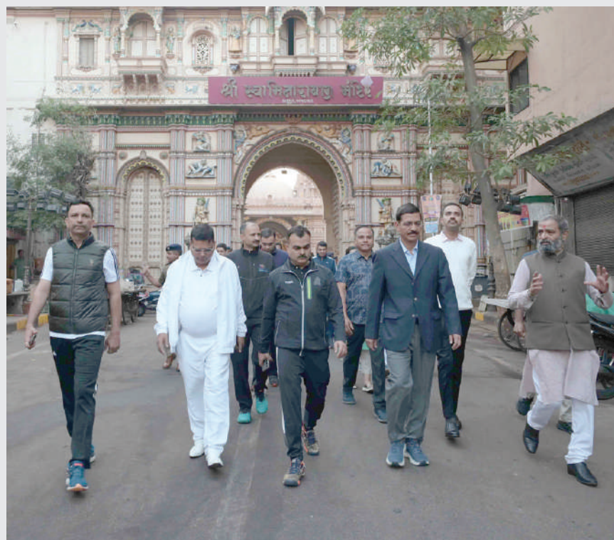
વહેલી સવારે કાલુપુર સ્વામિનારાયણ મંદિરથી હેરીટેજ વોક નિકળી હતી.