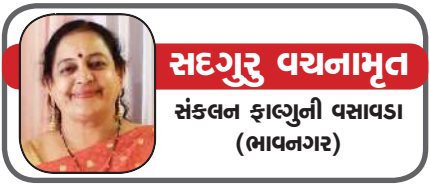
સદગુરુ વયનામૂર્તિ સંકલન ફાલ્ગુની વસાવા (ભાવનગર)