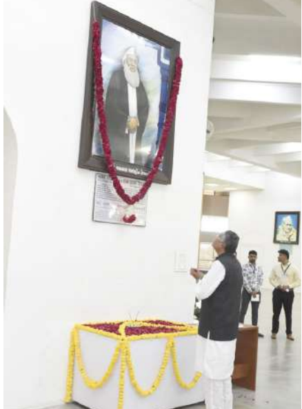
1 (માહિતી) ગાંધીનગર, તા.૧ | સ્વાતંત્ર્ય સેનાની શ્રી અબ્બાસ શમશુદીન તૈયબજીની જન્મ જયંતી નિમિત્તે તા.૦૧ ફેબ્રુઆરી

રાજ્ય મંત્રી મંડળના સભ્યશ્રીઓ, ધારાસભ્યશ્રીઓ તેમજ અધિકારી કર્મચારીઓએ પણ પુષ્પ અર્પણ કર્યા