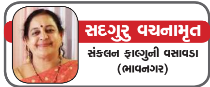
સદગુરુ વચનામૃત સંકલન ફાલ્ગુની વસાવડા (ભાવનગર)

કોઈપણ ચેનલ હોય, સોશયલ મીડિયા હોય, કે પછી પ્રિન્ટ મીડિયા હોય, ગયાં અઠવાડિયે લગભગ બધા સમાચારમાં અયોધ્યામાં થનાર ભગવાન રામલલાની પ્રાણ પ્રતિષ્ઠા મહોત્સવ અંતર્ગત સમાચાર રહ્યા. એટલે કે ઘટના કંઈ રીતે ઘટી, અને ઘટી રહી હતી, તે આજ સુધી હજુ પણ એનાં પડલા વાગે છે, જે ખરેખર આશ્ચર્યચકિત કરી દે તેનું જ હતું. સ્વયં મૂર્તિકાર અરુણ યોગીરાજ એ કહ્યું હતું કે મેં જ્યારે મૂર્તિ બનાવી ત્યારે એના હાલભાવ જુદા હતાં, અને અત્યારે પણ સાવ જુદા છે! આ કોઈ દૈવીય હસ્તક્ષેપ છે બાકી આ શક્ય નથી. એટલે કે આ સમગ્ર ઘટના પાછળ કોઈ દૈવી શક્તિ કામ કરી રહી છે એ સ્વીકારવું રહ્યું. આ ઉપરાંત પોષ સુદ પૂનમ એટલે કે પોષી પૂનમ પણ ગઈ, અને આ દિવસે ગિરનારી અંબાનો પ્રાગટ્ય દિવસ હતો, એટલે એ નિમિત્તે પણ દૈવીય શક્તિનું કે ભક્તિ ભાવ ભર્યું વાતાવરણ રહ્યું. ગઈકાલે ૨૦૨૪ની ૨૬ જાન્યુઆરી હતી, એટલે કે આઝાદી પછીના ૭૫ મો ગણતંત્ર દિવસ ઉજવાયો. આટલા લાંબા ગાળામાં ભારતે લગભગ દરેક ક્ષેત્રે સારો એવો વિકાસ કર્યો છે, અને એમાં સૌથી મોખરે કોઈ ક્ષેત્રમાં વિકાસ કર્યો હોય તો એ સ્ત્રી શિક્ષણની બાબતમાં છે. એટલે કે ભારતમાં સમયનો એ દોર હતો કે જ્યારે દરેક વર્ષે ને વર્ગમાં સ્ત્રી શિક્ષણને આટલું મહત્વ નહોતું, અને આજે આપણે જોઈએ છીએ કે દરેકે દરેક ક્ષેત્રમાં સ્ત્રીઓ પોતાની વિવિધ શક્તિનો પરિચય આપી રહી છે, અને પોતાના વ્યક્તિત્વને તેમજ અસ્તિત્વની નિખારી રહી છે. ક્યારેક એ સારું પણ લાગે, અને અમુક રીતે ક્યારેક એ જ સામાજિક પતનનું કારણ પણ લાગે, પરંતુ આજે આપણે એ વિશે વાત કરવાની નથી. ૨૬ જાન્યુઆરીના રાષ્ટ્રીય એજન્ડામાં સ્ત્રી સશક્તિકરણને મુખ્ય સ્થાન આપ્યું હતું, અને આપણા રાષ્ટ્રપતિ મહોદયા દ્રોપદી મુર્મુએ પોતાના શુભ હાથે રાષ્ટ્રવજ્જ લહેરાવ્યો હતો.