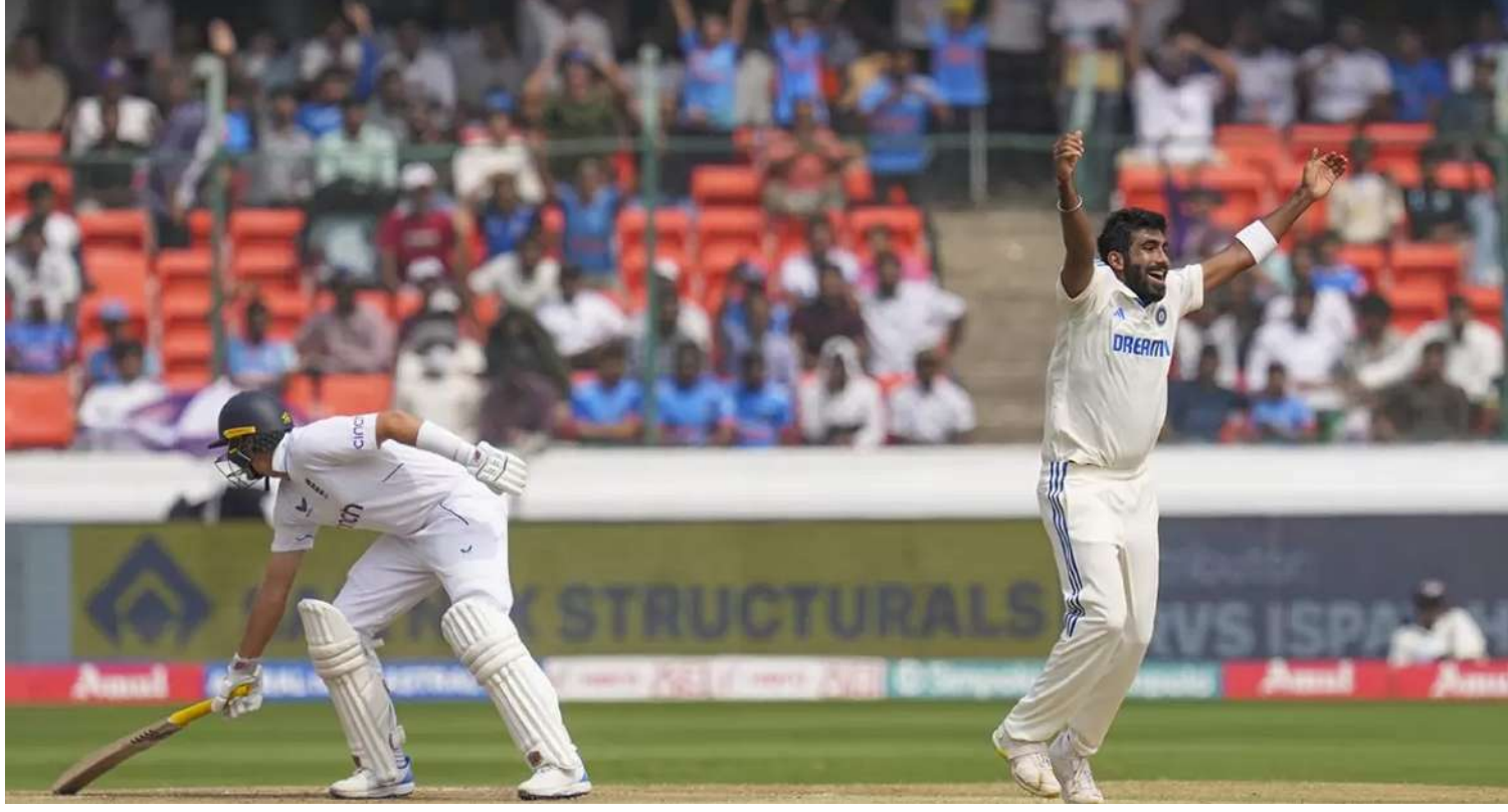
હેદરાબાદના રાણુવ ગાંધી ઇન્ટરનેશનલ ક્રિકેટ સ્ટેડિયમમાં ભારત અને ઇંગ્લેન્ડ વચ્ચેની પ્રથમ ટેસ્ટ મેચના ત્રીજા દિવસે ભારતના જસપ્રીત ભુમરાહે ઇંગ્લેન્ડના ખે રૂટની વિકેટ માટે સફળતાપૂર્વક અપીલ કરી.