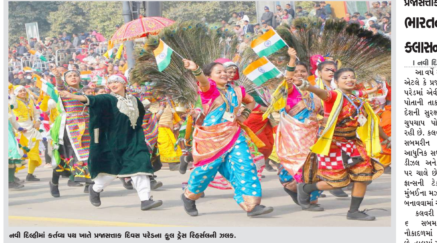
નવી દિલ્હીમાં કર્તવ્ય પથ ખાતે પ્રજાસત્તાક દિવસ પરેડના કુલ ડ્રેસ રિહર્સલની ઝલક.

। (એજન્સી) નવી દિલ્હી, તા.૨૩ । અયોધ્યાના રામ મંદિરના પ્રાણ પ્રતિષ્ઠા સમારોહે અનેક રેકોર્ડ તોડ્યા છે. આ લિસ્ટમાં હવે પીએમ નરેન્દ્ર મોદીની ઓફિશિયલ યુટ્યુબ ચેનલનો પણ એક રેકોર્ડ સામેલ છે. નરેન્દ્ર મોદી ચેનલે લાઈવ પ્રસારણ દરમિયાન વિશ્વમાં સૌથી વધુ જોવામાં આવતી યુટ્યુબ ચેનલ બનીને રેકોર્ડ તોડ્યો છે. રામ મંદિરમાં પ્રાણ પ્રતિષ્ઠાનું આ ચેનલ પર લાઈવ પ્રસારણ કરવામાં આવ્યું હતું, જેને ૯ મિલિયન એટલે કે ૯૦ લાખથી વધુ લોકોએ લાઈવ નિહાળ્યું હતું. કોઈપણ યુટ્યુબ ચેનલ પર લાઈવ પ્રસારણ જોવાનો આ સૌથી મોટો રેકોર્ડ છે. નરેન્દ્ર મોદી ચેનલ પરના આ લાઈવ પ્રસારણને અત્યાર સુધીમાં ૧ કરોડ વ્યૂઝ મળ્યા છે. આ હેલા લાઈવ પ્રસારણ સૌથી વધુ જોવાનો રેકોર્ડ ચંદ્રયાન-૩ લોન્ચનો હતો. આ લોન્ચના પ્રસારણને ૮૦ લાખથી વધુ લોકોએ લાઈવ નિહાળ્યો હતો. જેનો રેકોર્ડ રામ મંદિર પ્રાણ પ્રતિષ્ઠા સમારોહે તોડીને પ્રથમ સ્થાન લીધું છે. જ્યારે ત્રીજા નંબર પર ફિફા વર્લ્ડ કપ ૨૦૨૨ મેચ છે અને ચોથા નંબર પર એપલ લોન્ચ ઈવેન્ટ છે. નરેન્દ્ર મોદીની યુટ્યુબ ચેનલ પર સબસ્ક્રાઇબર્સની સંખ્યા ૨.૧ કરોડ છે. તેમની ચેનલ પર કુલ ૨૩,૭૫૦ વીડિયો અપલોડ કરવામાં આવ્યા છે જેની કુલ વ્યૂઝ ૪૭૨ કરોડ છે. યુટ્યુબ પર સૌથી વધુ સબસ્ક્રાઇબર્સ મેળવનાર નરેન્દ્ર મોદી વિશ્વના પ્રથમ નેતા છે. વિશ્વમાં સૌથી વધુ જોવાયેલા ૧૦ લાઈવ પ્રસારણ ચેનલ અને લાઈવ ઈવેન્ટનું નામ લાઈવ પ્રસારણ વ્યૂઝ પ્રસારણ તરીકે નરેન્દ્ર મોદી-રામ મંદિર પ્રાણ પ્રતિષ્ઠા સમારોહ ૯૦ લાખ લોકોએ જોયું.