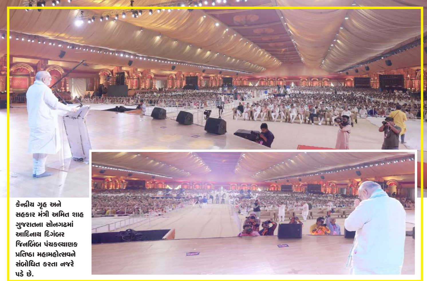
કેન્દ્રીય ગૃહ અને સહકાર મંત્રી અમિત શાહ ગુજરાતના સોનગઢમાં આદિનાથ દિગંબર જિનગિંબ પંચકલ્યાણક પ્રતિષ્ઠા મહામહોત્સવને સંબોધિત કરતા નજરે પડે છે.