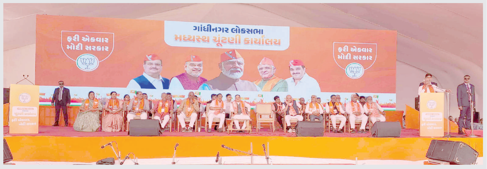
ગાંધીનગર મધ્યસ્થ કાર્યાલયનું ઓપનિંગ કરવામાં આવ્યું હતું જેમા જે પી નક્કા ઉપસ્થિત રહ્યા હતા.

। (એજન્સી) સુરત, તા.૨૩ । સુરત જિલ્લાના ઓલપાડ તાલુકાના ભાંડુત ગ્રામ પંચાયતના તલાટીએ મકાનનાવેરા બિલમાં નામ ટ્રાન્સફર કરવાના અવેજ પેટે લાંચની માંગણી કરતા ACB એ છટકુ ગીઠવી લાંચિયા તલાટીને રંગેહાથ ઝડપી લીધા છે. તલાટી સામે લાંચ સ્વયંત ધારા હેઠળ કાયદેસરની કાર્યવાહી હાથ ધરવામાં આવી છે. સુરત જિલ્લાના ઓલપાડ તાલુકાના ભાંડુત ગ્રામ પંચાયતના તલાટીએ મકાનનાવેરા બિલમાં નામ ટ્રાન્સફર કરવાના અવેજ પેટે લાંચની માંગણી કરતા ACB એ છટકુ ગીઠવી લાંચિયા તલાટીને રંગેહાથ ઝડપી લીધા છે.