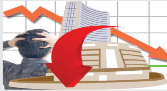
કોલ ઈન્ડિયા, ઓએનજીસી, એસબીઆઈ લાઈફ, બીપીસીએલ અને એસબીઆઈના શેર શેરબજારના ટોપ લુઝર્સની યાદીમાં સામેલ હતા.

મંગળવારે બીએસઈ સેન્સેક્સ ૧૦૫૩ પોઈન્ટની નબળાઈ સાથે ૭૦૩૭૦ પોઈન્ટના સ્તર પર બંધ થયો હતો. નેશનલ સ્ટોક એક્સચેન્જનો નિફ્ટી ૩૩૩ પોઈન્ટ ઘટીને ૨૧,૨૩૮ પોઈન્ટના સ્તરે બંધ થયો છે. મંગળવારે સોનું ૧૮૭ રૂપિયાના વધારા સાથે ૬૨૦૫૫ રૂપિયા પ્રતિ ૧૦ ગ્રામના સ્તર પર કારોબાર કરી રહ્યું હતું. મંગળવારે પ્રોફિટ બુકિંગના કારણે રેલવેના શેરમાં ૧૬ ટકા સુધીની નબળાઈ નોંધાઈ હતી. આ સાથે, મ્યુચ્યુઅલ ફંડ્સ અને એફઆઈઆઈએ ઝોમેટો સહિત ચાર નવા યુગની ટેક કંપનીઓમાં તેમનો હિસ્સો વધાર્યો છે. શેરબજારના કામકાજમાં ભારે નબળાઈ વચ્ચે મંગળવારે પીએસયુના શેરમાં ભારે ઘટાડો નોંધાઈ રહ્યો હતો.