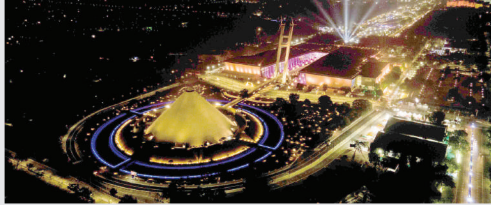
ગ્લોબલ સમિટ ૨૦૨૪ યોજવાની છે તેના માટે ગાંધીનગરમાં લાઈટીંગ કરાચું છે.