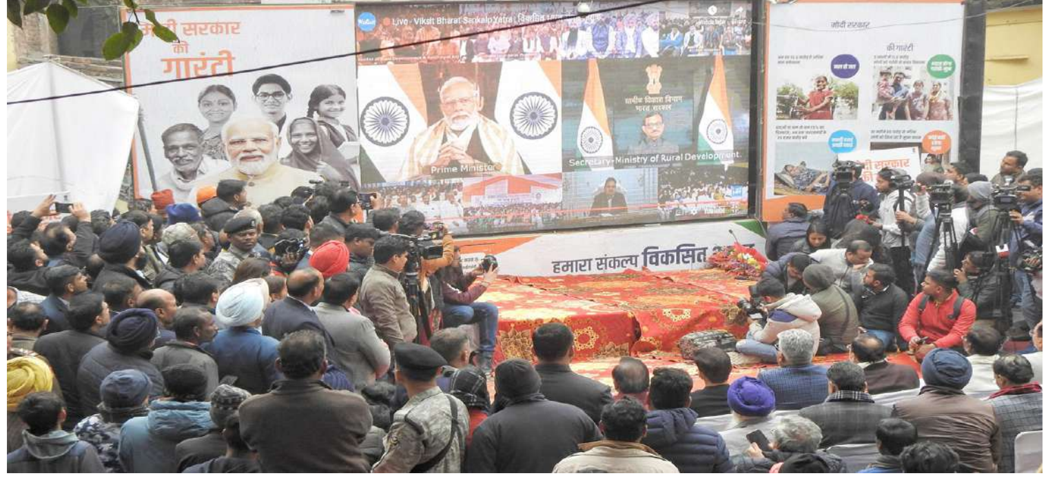
દક્ષિણ પૂર્વ દિલ્હીના નેહરુ નગર ખાતે વિકસિત ભારત સંકલ્પ યાત્રા દરમિયાન લાભાર્થીઓ સાથે વડાપ્રધાન નરેન્દ્ર મોદીએ વિડિયો કોન્ફરન્સિંગ દ્વારા વાતચીત કરી હતી.

જાહેર કરાયું હતું. શાહનવાજની દિલ્હીથી એનઆઈએએ ધરપકડ કરી હતી. પૂછે આઈએસઆઈએસમોડ્યુલના અનેક આતંકીઓ હજુ ફરાર છે. તાજેતરમાં પકડાયેલા આઈએસઆઈએસના આતંકી શાહનવાજ આલમે ખુલાસો કર્યો હતો કે પૂછે મહારાષ્ટ્ર મોડ્યુલના નિશાને મુંબઈ અને ગુજરાતના શહેરો હતા. આઈએસઆઈએસતેના આતંકીઓની મદદથી ગોધરા કાંડનો બદલો લેવા માટે સમગ્ર ગુજરાતમાં તબક્કાવાર રીતે બોમ્બ બ્લાસ્ટ કરવા માગતો હતો. પૂછપરછમાં તેણે કહ્યું કે આતંકીઓના નિશાને ગુજરાતમાં ભાજપનો હેડક્વાર્ટર, આરએસએસનો હેડક્વાર્ટર, હાઈકોર્ટ, જિલ્લા કોર્ટ, યુનિવર્સિટી, મંદિર, મસ્જિદ, યહૂદી પ્રાર્થના સ્થળ, રેલવે સ્ટેશન, ભીડવાળા બજાર અને વીઆઈપીના ઘર અને તેના રુડસ હતા.