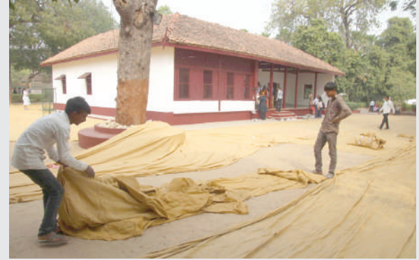
વડાપ્રધાન ગાંધી આશ્રમની મુલાકાત લેવાના છે ત્યારે તેને લગતી તમામ તૈયારીઓ કરવામાં આવી હતી.