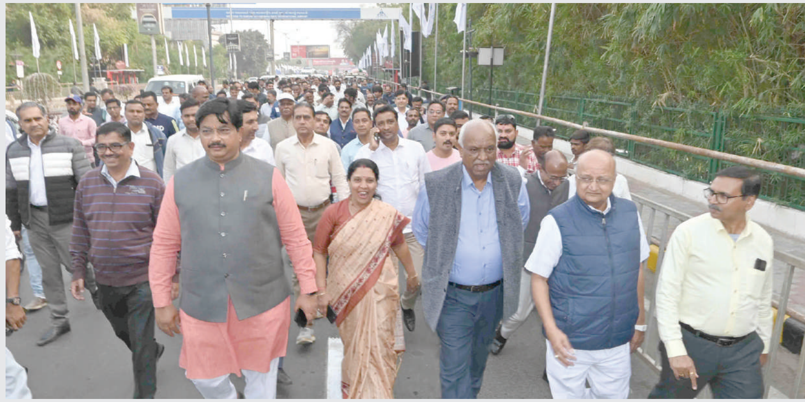
વડાપ્રધાન નરેન્દ્ર મોદી ગુજરાત આવવાના છે ત્યારે તેના માટે બીજેપીના મેમ્બરો દ્વારા એરપોર્ટથી ફાટ માર્ચ યોજાઈ હતી.