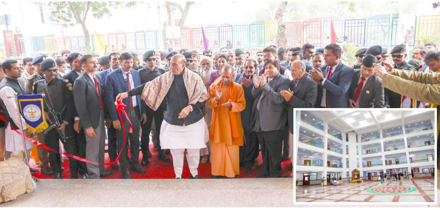
કેન્દ્રીય રક્ષામંત્રી રાજનાથસિંહે ઉત્તર પ્રદેશના વૃંદાવન ખાતે સંવિદ ગુરુકુલમ કન્યા સૈનિક શાળાનું ઉદ્ઘાટન કર્યું હતું.

કૃપાથી સરકારે આ અપમાનનો બદલો લીધો.' તેમણે આગળ કહ્યું, 'મુલાયમ સિંહે કહ્યું હતું કે અહીં એક પક્ષી પણ મારી શકશે નહીં. તે સમયે મુલાયમ સિંહ અને વિશ્વનાથ પ્રતાપ સિંહે જે નરસંહાર આચર્યો હતો તેને આપણે ભૂલી શકીશું નહીં. કોઠારી બંધુઓનો નાશ થયો. અમારી સામે, એક ૧૮ વર્ષનો અને એક ૨૦ વર્ષનો એમ તેના બંને બાળકોને રૂમમાંથી બહાર કાઢીને મેદાનમાં લાવીને ગોળી મારી દેવામાં આવી. અમે તે બંધુ સહન કર્યું અને ૬ ડિસેમ્બર, ૧૯૮૨ ના રોજ, અમે ૫ કલાકમાં તે માળખું તોડી પાડ્યું.' જગદગુરુએ કહ્યું કે, 'શાસ્ત્રોનો પણ આગળ આવ્યો ત્યારે જ કેસ શરૂ થયા.