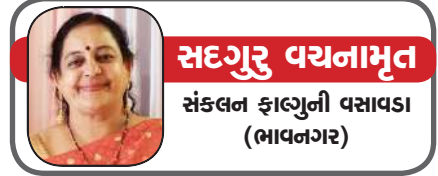
સદગુરુ પંચનામૃત સંકલન ફાલ્ગુની વસાવડા (ભાવનગર)

હે ઈશ્વર. આપનો શ્રીચરણોમાં મારા સહ પરિવાર સાથે સાષ્ટાંગ પ્રેમ પ્રણામ. આજે મંગળવાર એટલે ચિંતનનો દિવસ. ચિંતામાંથી જ ચિંતનનો જન્મ થાય! અને વારંવારની આવતી આ કુદરતી આપતિ જોઈને એવું લાગે છે કે પ્રકૃતિ એ બંડ પોકાર્યું છે, ત્યારે સમયસર ચિંતન કરવું જ રહ્યું. પ્રકૃતિમા દિવસે ને દિવસે વિધમતા ઓ વધની જ જવાની છે, અને એમાં આપણે આપણું અસ્તિત્વ ટકાવી રાખવાનું છે. બહુ પહેલા ચિંતનમાં એકવાર વાવાઝોડા વખતે કદાચ લખ્યું હતું કે બગીચાના લગભગ બધા વૃક્ષો ઢળી પડ્યા પણ ઉંચાં ઉંચા વૃક્ષો બચી ગયા! એ હવાનો મોડ જે તરફ હતો એ તરફ નમી ગયાં, એટલે પોતાનું અસ્તિત્વ બચાવી શક્યા! આપણે પણ આપણું અસ્તિત્વ બચાવવું હોય તો હવાના રુખ તરફ નમવું પડે, અથવા હવાના રુખને આપણી તરફ મોડવો પડે! આપણે પાટલી બદલુંની જેમ હવા જે તરફ હોય એમ બહુ જીવ્યાં, પણ હવે હવાનો રુખ બદલવો પડશે, એટલે કે જે સાચું છે! જે આપણી સંસ્કૃતિ છે! જે આપણા અમુલ્ય સંસ્કાર છે! એ મુજબ જીવેએ તો કદાચ દુનિયાના કોઈ વાવાઝોડા આપણને મિટાવી શકે નહીં. બસ ત્રણ ચાર ડગલાં જેટલું ચાલવાનું છે, એટલે કે ત્રણચાર નિયમો આપણી અને સમાજની ભલાઈ માટે દરેકે લેવાનાં છે. વૈષ્ણિક શાંતિ માટે પ્રકૃતિના સંવર્ધનની જવાબદારી સ્વીકારવાની છે. રાષ્ટ્રની સુરક્ષા માટે સનાતન સંસ્કૃતિનાં અમુલ્ય સંસ્કારોની હિકાજતની જવાબદારી સ્વીકારવાની છે, અને સમાજ વ્યવસ્થા માટે વર્ગ ભેદ કે વર્ણ ભેદ ભૂલીને એકજૂટ થઈને રહીશું એવી છેક છેવાડાના માનવી સુધીની સંવેદના દાખવવાની જવાબદારી સ્વીકારવાની છે. જો દરેકે દરેક સંમત થાય તો બહુ નાનાં ફેરફારો પણ ઘણું મોટું પરિણામ આપી શકે. પ્રકૃતિ સંવર્ધન હવા, જળ, સૂર્ય વન અને ભૂમિ એનાં વગર આપણું અસ્તિત્વ બચી શકે નહીં, માટે પ્રકૃતિના આ પાંચેય અંગોની ટપરેખ આપણે કરવી જોઈએ.