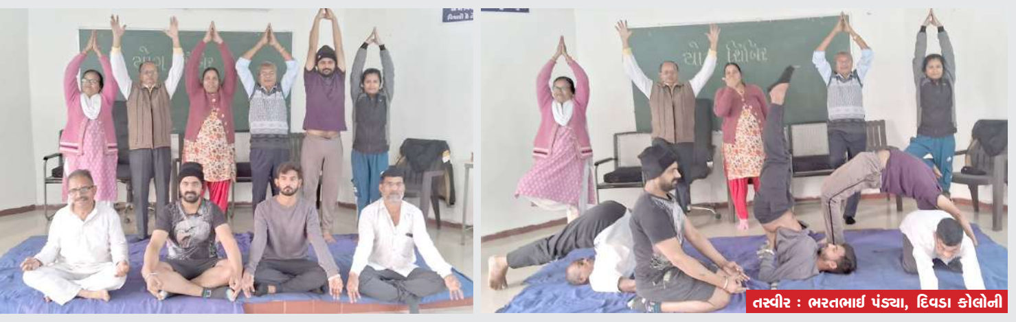
। (પ્રતિનિધી) દિવડા કોલોની, તા.૧ ।

નગરપાલિકાને અડીને જ પ્રજાપતિ સમાજના લોકોના રહેણાંક વિસ્તાર આવેલો છે. પ્રજાપતિ સમાજના લોકોના રહેણાંક વિસ્તારને અડીને જ પાણીના યોગ્ય નિકાલના અભાવે ગંદકી જોવા મળેલ છે. પ્રજાપતિ સમાજ દ્વારા કેટલીય વાર આ ગંદા પાણીના નિકાલ માટે તંત્ર પાસે માંગ કરેલ છે પણ આ ગંદા પાણીનો કોઈ નિકાલ જોવા મળતો નથી. આ ગંદા પાણીનો યોગ્ય નિકાલ ન હોવાથી પ્રજાપતિ વિસ્તારના લોકો સતત બીમારીના ભય હેઠળ જીવી રહ્યા છે. ગંદા પાણીમાં રહેલ મચ્છરોને લઈ તેઓને ડેન્ગ્યુ, મેલેરિયા જેવા રોગોનો ભય સતાવી રહ્યો છે. આ ગંદુ પાણી સતત દુર્ગંધ પણ મારે છે તેવું અહીંના લોકોનું મૌખિક કહેવું છે. પ્રજાપતિ વિસ્તારના લોકો નગરપાલિકા પાસે આ ગંદા પાણીનો યોગ્ય નિકાલ થાય તેમજ આ વિસ્તારમાં ગંદકી ન સર્જાય તેવું ઈચ્છી રહ્યાં છે તેમજ નગરપાલિકા તાત્કાલિક આ અંગે પગલા લે તેવું પ્રજાપતિ સમાજના લોકો ઈચ્છી રહ્યાં છે.