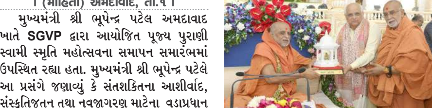
। (માહિતી) અમદાવાદ, તા.૧ ।

મુખ્યમંત્રી શ્રી ભૂપેન્દ્ર પટેલ અમદાવાદ ખાતે SGVP દ્વારા આયોજિત પૂજ્ય પુરાણી સ્વામી સ્મૃતિ મહોત્સવના સમાપન સમારંભમાં ઉપસ્થિત રહ્યા હતા. મુખ્યમંત્રી શ્રી ભૂપેન્દ્ર પટેલે આ પ્રસંગે જણાવ્યું કે સંતશક્તિના આશીર્વાદ, સંસ્કૃતિજનન તથા નવજાગરણ માટેના વડાપ્રધાન શ્રી નરેન્દ્રભાઈના સંકલ્પથી ભારત વિશ્વગુરુ બનવા તરફ આગળ વધી રહ્યું છે. વડાપ્રધાન શ્રી નરેન્દ્રભાઈએ હંમેશાં સંસ્કૃતિના જતન પર ભાર મૂક્યો છે. આજે ગુરુકુળ પરંપરાને કારણે વિદેશની ધરતી પર પણ આપણી સંસ્કૃતિ મજબૂતારવાનું પ્રસ્થાપિત થઈ શકી છે, એ બહુ મોટી વાત છે, એવું તેમણે ઉમેર્યું હતું.