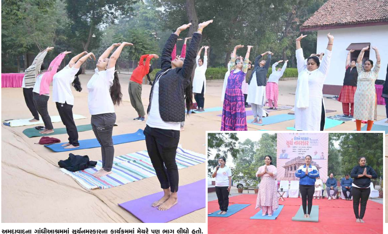
અમદાવાદના ગાંધીઆશ્રમમાં સૂર્યનમસ્કારના કાર્યક્રમમાં મેચરે પણ ભાગ લીધો હતો.

। (એજન્સી) નર્મદા, તા.૧ । સ્ટેચ્યુ ઓફ યુનિટી ખાતે 2023 માં રેકોર્ડબ્રેક પ્રવાસીઓ ઉમટ્યા છે. ત્યારે ૫ વર્ષમાં પ્રથમવાર પ્રવાસીઓ આંકડો આ વર્ષે ૫૦ લાખને પાર થયો છે. ૨૯ ડિસેમ્બર 2023 સુધીમાં ૫૦,૨૮,૧૪૭ પ્રવાસીઓએ મુલાકાત લીધી હતી. ૫ વર્ષમાં ૧ કરોડ ૭૫ લાખથી વધુ પ્રવાસીઓ નોંધાયા હતા. આ બાબતે સ્ટેચ્યુ ઓફ યુનિટીનાં સીઈઓ ઉદિત અગ્રવાલે જણાવ્યું હતું કે, ગયા વર્ષે લગભગ ૪૬ લાખ જેટલા પ્રવાસીઓએ સ્ટેચ્યુ ઓફ યુનિટીની મુલાકાત લીધી હતી. આ વર્ષે પ્રવાસીઓનો આંકડો ૫૦ લાખને પાર થઈ ગયો છે. તેમજ આ આંકડો હજુ પણ વધવાની સંભાવના છે. ૩૧ એપ્રિલે કે આજે મોટી સંખ્યામાં લોકો આવવાના છે. તેમજ ઉત્તરાયણ સુધી હજુ પણ વધુ પ્રવાસીઓ આવવાની શક્યતા છે. સ્ટેચ્યુ ઓફ યુનિટી ખાતે લોકો તેઓનાં પરિવારજનો સાથે અહીંયા આવ્યા હતા. તેમજ તેઓએ સ્ટેચ્યુ ઓફ યુનિટી ખાતે બનાવેલ સુંદર જગ્યા જોઈ મંત્રમુગ્ધ થયા હતા. વિશ્વભરમાંથી પ્રવાસીઓ અહીંયા આવતા હોય છે. ત્યારે પ્રવાસીઓમાં હજુ વધારો થઈ રહ્યો છે.