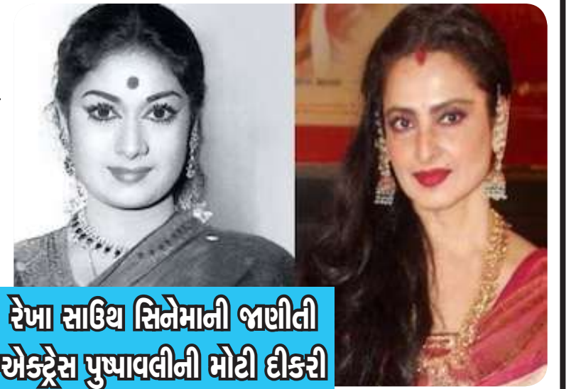
રેખા સાઉથ સિનેમાની જાણીતી એક્ટ્રેસ પુષ્પાવલીની મોટી દીકરી

હતી. આ તસવીરો આવતાની સાથે જ સોશિયલ મીડિયા પર છવાઈ ગઈ હતી. એક્ટ્રેસ જહાન્વી કપૂર આ ખૂબ જ બોલ્ડ રેડ ડ્રેસમાં ખૂબ જ કિલર તસવીરો ક્લિક કરતી જોવા મળી હતી. આ તસવીરોમાં એક્ટ્રેસની અદાઓ ફેન્સનું દિલ જીતી લીધું હતું. આ તસવીરોમાં એક્ટ્રેસ જહાન્વી કપૂર હેવી મેકઅપમાં જોવા મળી હતી. એક્ટ્રેસે લેટેસ્ટ ફોટોશૂટમાં ઘણા કલોઝઅપ ફોટોઝ પણ ક્લિક કર્યાં છે. આ તસવીરોમાં એક્ટ્રેસ જહાન્વી કપૂર પાણી સાથે રમતી જોવા મળી હતી. એક્ટ્રેસે આ વેટ લુક ફોટોશૂટ કરાવ્યું હતું. આ તસવીરોમાં જહાન્વી કપૂર હજુ પણ કિસમસ મૂડમાં રૂબેલી જોવા મળી હતી. એક્ટ્રેસની આ તસવીરોએ ફેન્સનું દિલ જીતી લીધું હતું. આ તસવીરોમાં એક્ટ્રેસ જહાન્વી કપૂર તેના બોલ્ડ અને કર્વી ફિગરને ફ્લોન્ટ કરતી જોવા મળી હતી. એક્ટ્રેસની આ તસવીરો ફેન્સના દિલ પર છવાતી જોવા મળી હતી. સામે આવેલી આ તસવીરોમાં એક્ટ્રેસ જહાન્વી કપૂરની બોલ્ડનેસ જોઈને ફેન્સ દિવાના થતા જોવા મળ્યા હતા. આ તસવીરોના લોકો ખૂબ વખાણ કરી રહ્યા છે. જો કે, કેટલાક લોકો એવા છે જે આ તસવીરો જોઈને એક્ટ્રેસને ભૂંડી રીતે ટ્રોલ કરતા જોવા મળે છે.