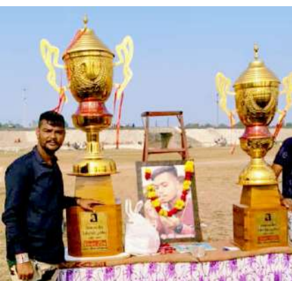
ફાઈનલ ઈઈઝ કલ્પ રળીયાતી વિજેતા થઈ થયા હતા અને વિજય થયેલા વિજેતા ટિમને દ ક્રિકેટ ઈવી ટ્રોફી સાંસી સમાજના અગ્રણીઓના હસ્તે આપવામાં આવતા લોકોમાં ઉત્સાહ જોવા મળ્યો હતો.

દાહોદના ભીલવાડા સાંસી સમાજ દ્વારા દાહોદ શહેરના એક્તા ગ્રાઉન્ડ ખાતે તા.૨૫.૧૨.૨૦૨૩ ના રોજ વિકેશ કપ ટેનિસ ક્રિકેટ ટુર્નામેન્ટ યોજાઈ હતી જેમાં સાંસી સમાજની વિવિધ ટ ટિમોએ ભાગ લીધો હતો જેમાં ગોધરાનો ઇલેવન અને ઈઈઝ કલ્પ રળીયાતી ગામની એમ બન્ને ટિમોએ સારો પ્રદસ્તન કરી ફાયનલ સુધી પહોંચી હતી અને આજરોજ તા ૨૬.૧૨.૨૦૨૩ ગુરુવારના રોજ ઈઈઝ કલ્પ રળીયાતી અને ગોધરાનો ઇલેવન ફાઈનલ મેચ રમાઈ જેમાં ખિલાડીઓને મેચ રમતા પહેલા રાષ્ટ્રગાન ગાઈને મેચની શરૂઆત કરી હતી જેમાં સાંસી સમાજના અગ્રણીઓ યુવાઓ મોટી સંખ્યામાં ઉપસ્થિત રહ્યા હતા જ્યાં આજરોજ યોજાયેલ ગોધરા રોડ અને વિકેશ કપ ટેનીસ ક્રિકેટ ટુર્નામેન્ટમાં