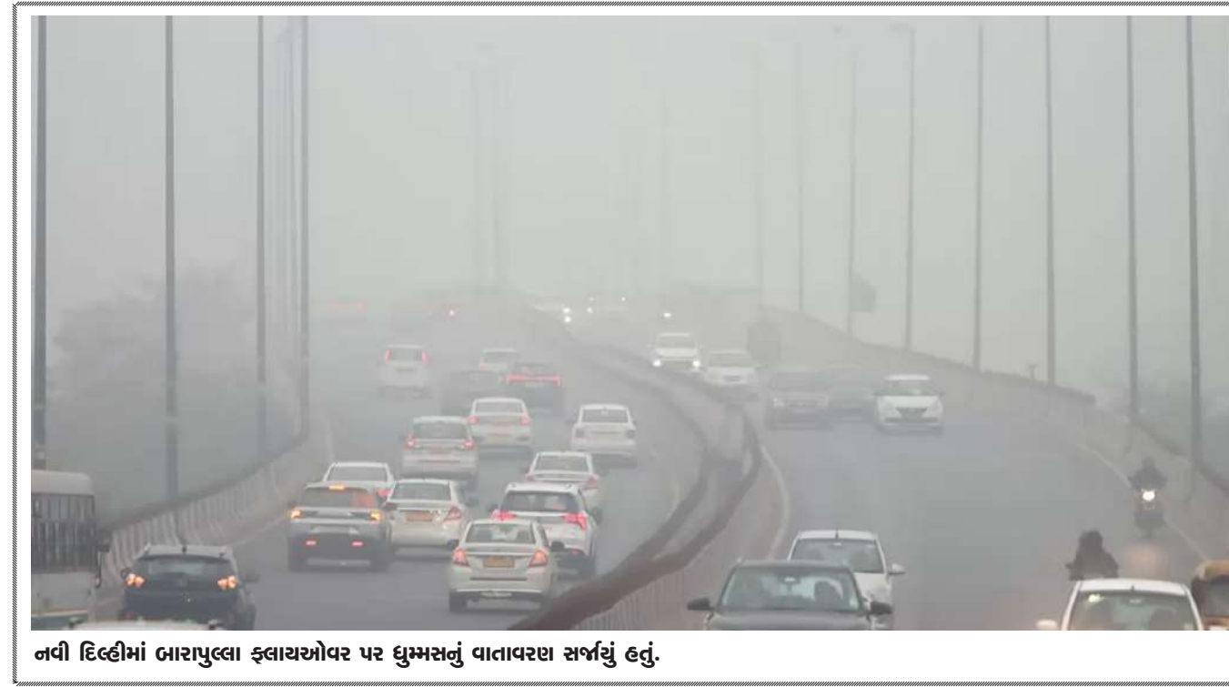
નવી દિલ્હીમાં બારાપુલા ફ્લાયઓવર પર ઘુમસનું વાતાવરણ સર્જાયું હતું.

પોતાની ઈચ્છાથી સહયોગની રકમ આપે છે. અગાઉ નવેમ્બરમાં ભારત સરકારે સહાયતાની રકમ ૨૫ લાખ ડોલરનો પહેલો હપ્તો ચૂકવ્યો હતો. ઓક્ટોબરે યુદ્ધ શરૂ થયા બાદથી ગાઝામાં સંયુક્ત રાષ્ટ્રના કાર્યક્રમ સામે અવરોધ પેદા થયા. આ કામકાજ કરવામાં વ્યસ્ત ૧૩૦થી વધુ કર્મચારીઓ માર્યા ગયા.