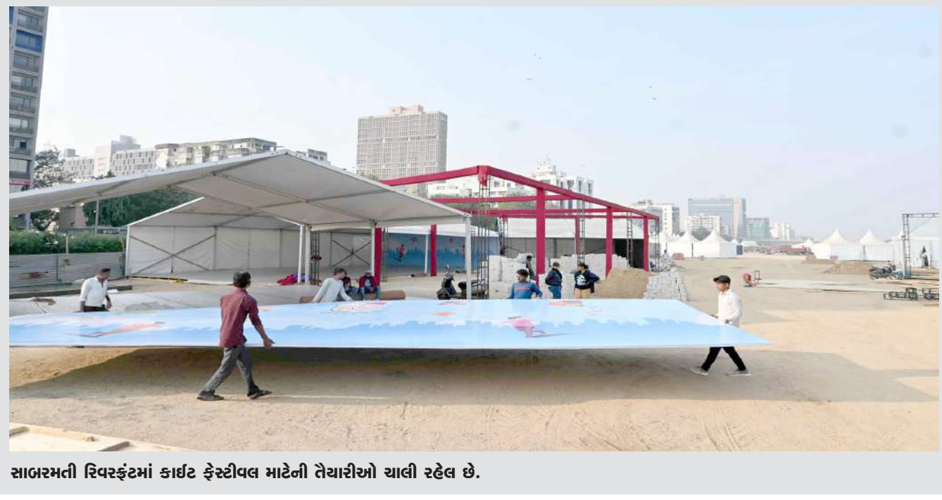
સાબરમતી રિવરફ્રંટમાં કાર્બન ફેસ્ટીવલ માટેની તૈયારીઓ ચાલી રહેલ છે.