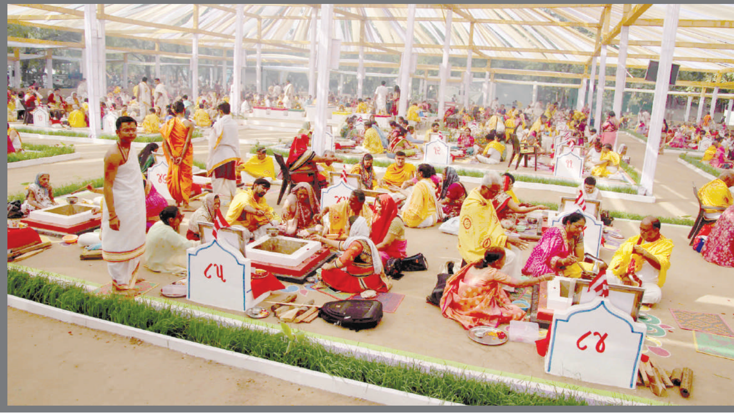
છારોડી એસજીવીપીમાં ૧૦૮ કુંડી મહા વિષ્ણુ યજ્ઞનું આયોજન કરાયું હતું.