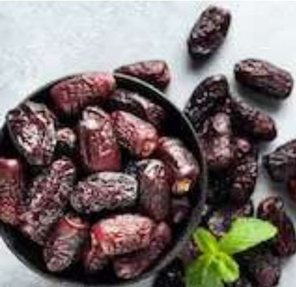
ઉકાળીને નકલી ખજૂર તૈયાર કરે છે. આમ કરવાથી તે અસલી ખજૂરની જેમ સોફ્ટ બની જાય છે. પછી તેને સારી રીતે સૂકવીને માર્કેટમાં વેચવામાં આવે છે.

ખજૂર ખાવાથી સ્વાસ્થ્યને અનેક રીતે લાભ મળે છે. દરરોજ તેનું સેવન કરવાથી કબજિયાતથી લઈને કોલેસ્ટ્રોલ સુધીની સમસ્યાઓમાં રાહત મળે છે. આટલું જ નહીં, તે સુગર કેવિંગ માટે પણ એક હેલ્થી ઓપ્શન છે. આવી સ્થિતિમાં હેલ્થી એક્સપર્ટ તેને ખાવાની સલાહ આપે છે. પરંતુ ધ્યાનમાં રાખો કે જો તમે નકલી ખજૂર ખાઈ રહ્યા છો, તો તમને તેનાથી કોઈ ફાયદો નહીં થાય. જી હા, નકલી ખજૂર માર્કેટમાં ખુલ્લેઆમ અસલી ખજૂરના ભાવે વેચાઈ રહી છે અને કદાચ તમે પણ તેનું સેવન કરી રહ્યા છો. તેથી, આજે અમે તમને કેટલીક ટ્રિક્સ જણાવી રહ્યા છીએ જેના દ્વારા તમે અસલી અને નકલી ખજૂરને સરળતાથી ઓળખી શકો છો. ઘણા લોકો જંગલી કાચી ખજૂર તોડીને ગોળના પાણીમાં