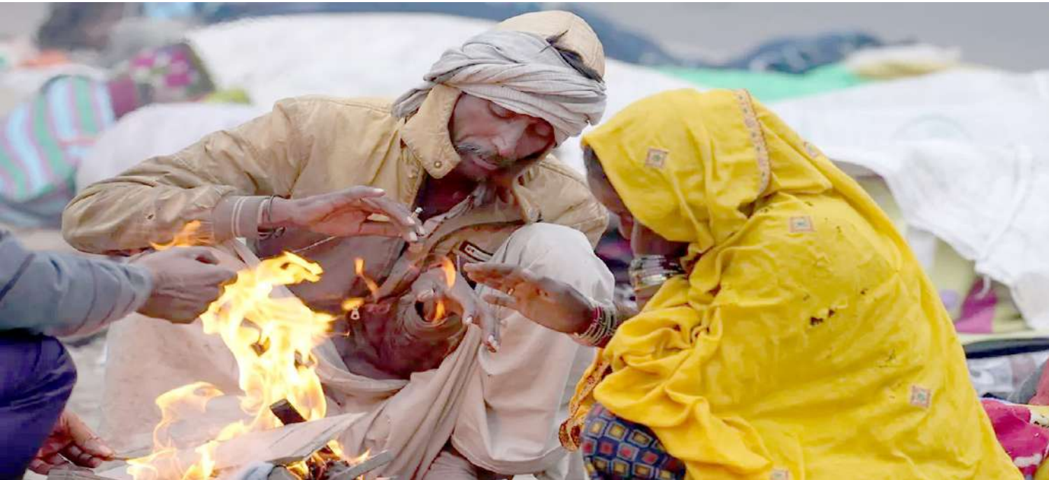
નવી દિલ્હીમાં ધુમ્મસ દરમિયાન શિયાળાની ઠંડી સવારે લોકો રસ્તાના કિનારે અગ્નિની પાસે બેઠા નજરે પડે છે.

કરી રહેલી ટીમને લોકેશ સહારો પૂરો પાડ્યો હતો. આપી અને પહેલા શાઉલ ઠાકુર સાથે સાતમી વિકેટ માટે ૪૩ રન અને પછી બુમરાહ સાથે આઠમી વિકેટ માટે ૨૭ રન જોડ્યા હતા. રાહુલે ટેસ્ટ ક્રિકેટમાં અત્યાર સુધી ૪૭ ટેસ્ટમાં ૨૬૪૨ રન બનાવ્યા છે. ટેસ્ટ ક્રિકેટમાં તેની સાથે 'સાત'નું વિચિત્ર સંયોજન જોડાયેલું છે. ટેસ્ટ ક્રિકેટમાં અત્યાર સુધી તે સાત વખત ૦ પર, સાત વખત ૨ અને સાત વખત ૧૦ રનમાં આઉટ થયો છે. આટલું જ નહીં, ટેસ્ટ ક્રિકેટમાં અત્યાર સુધીમાં તેના નામે સાત સદી નોંધાઈ છે.