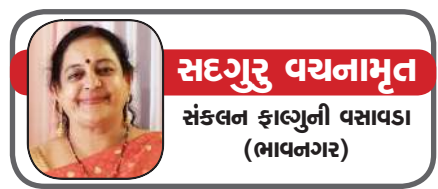
સદગુરુ વયનામૃત સંકલન ફાલ્ગુની વસાવડા (ભાવનગર)

હે ઈશ્વર. આ પનાં શ્રીચરણોમાં મારા સહ પરિવાર સાદર સાષ્ટાંગ પ્રેમ પ્રણામ. સાધના, આરાધના, ઉપાસના, એ બધી ક્રિયા જીવ પોતે પોતાની આધ્યાત્મિક ક્ષમતા વધારવા અને જીવ પશુ ઓછું કરવા માટે કોશિશ કરે છે. પ્રકૃતિની કે ઈશ્વર તત્વની નજીકમાં નજીક જઈ તેને જોવા જણવા કે માણવા માટે આ ત્રણ સ્તરે માનવી ઉપર ઉઠતો હોય છે. પરંતુ પ્રાર્થના એક એવું માધ્યમ છે કે, જેમાં આપણે જ્યાં અને જેવા છીએ તેવા રહીને જ ઈશ્વરને પોકારવાનો છે. પરંતુ શરત માત્ર એટલી જ છે કે, એમાં આપણે એકલા માટે કંઈ જ માગવાનું નથી, ટૂંકમાં માંગણી હોય તો પણ એ સાર્વજનિક હોવી જોઈએ. પ્રાર્થના શબ્દ બોલવાથી જ અંતરના ભાવ સ્વચ્છ થવા લાગે છે, અને એ આપણને પાછા નાનપણના એ વર્ગબંડમાં લઈ જાય છે, જ્યાં નિર્દોષતા અને નિખાલસતાનો ભાવ મુખ્ય હતો, એ સમયે બોલાતી એ પ્રાર્થનાનો ભાવ કદાચ આપણે એટલી સારી રીતે ગ્રહણ કરી શકતા નહોતા, અને ક્યારેક ક્યારેક વચ્ચે એક આંખ ખોલીને બીજું કોઈ શું કરે છે? એ જોઈ પણ લેતા હશું! પણ માટે ભાગે ત્યારે, હે ઈશ્વર તું મને એકલાને જ આ બધું આપજે, એવો ભાવ નહોતો આવતો! એ વાત તો પાકી. હાં કદાચ પરીક્ષામાં પાસ થવા વખતે મને સૌથી સારા માર્ક્સ આવે અથવા તો પેલા કરતાં વધુ આવે, એવું ક્યારેક વિચાર્યું હોય, પણ એનાથી વધુ તો નહીં જ, અને એ દેશ કાળ પ્રમાણે તો નહીં જ. હમણાં જ દેશરતો તહેવાર ગયો અને સૌ કોઈએ રાવણ દહન જોયું, હવે રામરાજ્ય થશે, એવી સૌ કોઈની ઝંખના પણ રહી! પરંતુ એની તીવ્રતા ઓછી છે, એને કારણે એ થઈ શકતું નથી. ઘેર આજે આપણે એ વિશે વાત નથી કરવાની. પરંતુ આઝાદીના ૭૫ વર્ષ પહેલાં આપણા રાષ્ટ્રપિતા મહાત્મા ગાંધીજીએ રામરાજ્યનું સ્વપ્ન જોયું હતું, અને એને લઈને એમણે રઘુપતિ રાઘવના ગુણ દરેકમાં અંકિત થાય, એટલે એ ભજન ધૂન કે જેનો તે પ્રાર્થનામાં સમાવેશ કરતા હતાં.