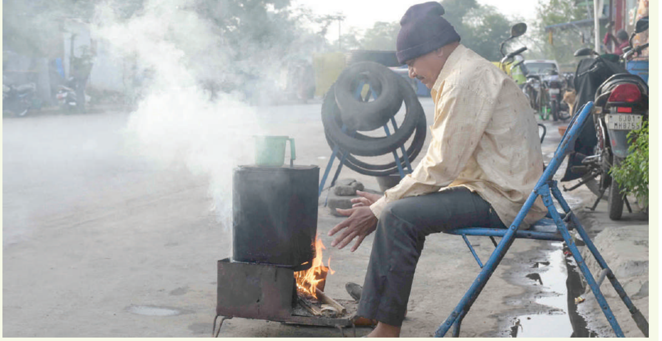
અમદાવાદમાં છેલ્લા બે દિવસથી વાતાવરણ વાદળછાંચું છે. જેના કારણે થંડીનું પ્રમાણ વધી ગયેલ છે. ઠંડીથી બચવા લોકો તાપણાનો સહારો લઈ રહ્યા છે.

૧૯ માર્ચ ૨૦૨૪ સુધી અસારવા-જયપુર એક્સપ્રેસ અને અસારવા-ઈન્દોર એક્સપ્રેસ ટ્રેનો સરદારગ્રામ સ્ટેશન પર રોકાશે નહીં