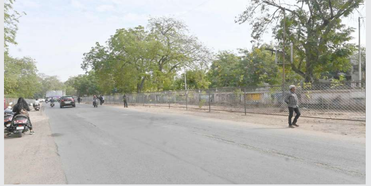
ગુજરાત યુનિવર્સિટી રોડ પરનું દબાણ હટાવીને તેની જગ્યા પર ફેન્સિંગ વાડ કરી દેવાઈ છે. જેથી ફરી દબાણ થાય નહીં.