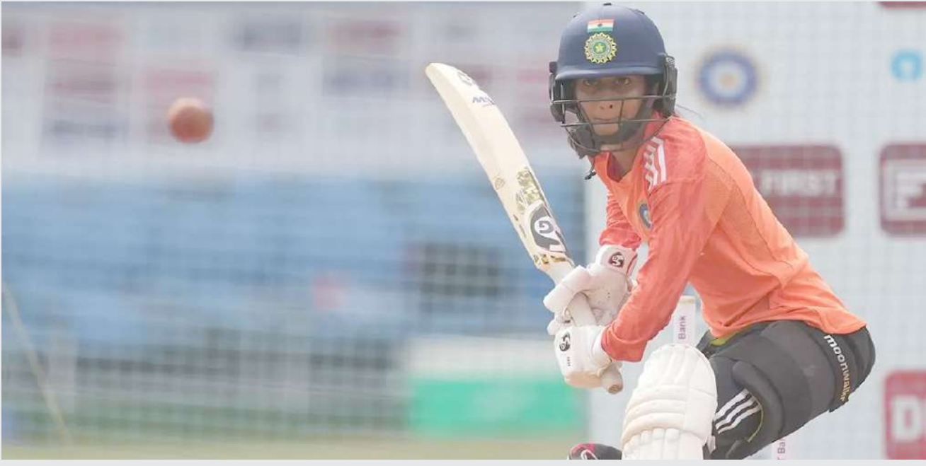
મુંબઈના વાનખેડે સ્ટેડિયમ ખાતે ભારત અને ઓસ્ટ્રેલિયા વચ્ચેની એકમાત્ર ટેસ્ટ ક્રિકેટ મેચ પહેલા પ્રેક્ટિસ સેશન દરમિયાન ભારતની જેમિમલ રોકિંગ બેટિંગની પ્રેક્ટિસ કરી રહી છે.