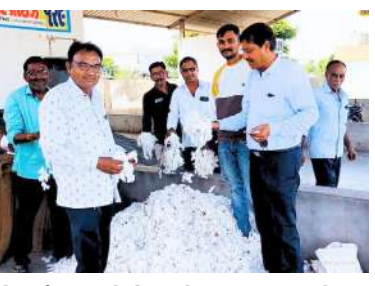
નોંધાઈ હતી. જેનો નીચો ભાવ ૧૨૦૫ તેમજ ઊંચો ભાવ ૧,૪૪૮ પ્રતિ મણ નોંધાયો હતો.

મહેસાણા, તા. ૨૦ | ઉત્તર ગુજરાતમાં આવેલી ઉનાવા માર્કેટ યાર્ડમાં કપાસ,તમાકુ અને એરંડાની સૌથી વધારે આવક થતી હોય છે. તેવામાં ૧૯ ડિસેમ્બરે મહેસાણાના ઉનાવા માર્કેટ યાર્ડમાં કપાસની આવકમાં થોડી તેજ જોવા મળી છે. યાર્ડમાં કપાસની ૩૮૦૦ મણ આવક થઈ હતી. જેનો નીચો ભાવ ૧૨૦૫ અને ઊંચો ભાવ ૧,૪૪૮ પ્રતિ મણ નોંધાયો હતો. આજે કપાસના ભાવમાં ૧૦૦ રૂપિયાનો ઘટાડો જોવા મળ્યો છે. ઉત્તર ગુજરાતમાં કાર્યરત ઉનાવા માર્કેટ યાર્ડમાં કપાસ, તમાકુ અને એરંડાની મલબ આવક થતી હોય છે. યાર્ડમાં કપાસની લગભગ ૩૮૦૦ મણની આવક