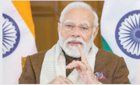
કહ્યું હતું કે, વિદેશમાં સ્થિત કેટલાક ઉગ્રવાદી જૂથોની ગતિવિધિઓથી ભારત અત્યંત ચિંતિત છે. તેમણે

પ્રતિબદ્ધતા છે. એવું બહાર આવ્યું છે કે ગુરપતવંત સિંહ પશુન, જેમને ભારત સરકાર દ્વારા ૧ જુલાઈ, ૨૦૨૦ ના રોજ 'નિયુક્ત વ્યક્તિગત આતંકવાદી' જાહેર કરવામાં આવ્યો છે, તે પંજાબ સ્થિત ગંગસ્તરો અને યુવાનોને પાલિસ્તાન માટે લડવા માટે સક્રિયપણે ઉશ્કેરે છે, જે સાર્વભૌમત્વ અને અખંડિતતાને પડકારે છે. ભારત. તરફથી ઉશ્કેરણી કરી રહ્યું છે. એનઆઈએની તપાસમાં પણ આ વાત સામે આવી છે. આ દરમિયાન વડાપ્રધાન મોદીએ પણ ઉગ્રવાદી ગતિવિધિઓ પર ચિંતા વ્યક્ત કરી હતી અને