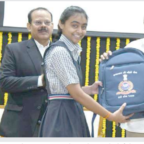
આ સંકલ્પને સહયોગ કરવો જોઈએ. તેમણે કહ્યું હતું કે, ભ્રષ્ટાચારના દૂષણને અટકાવવા બંધારણમાં અનેકવિધ કાયદા અમલી છે તેનો મહત્તમ ઉપયોગ કરવો જરૂરી છે.

તે હેતુથી લાંચ રૂથત બ્યુરો દ્વારા ‘ભ્રષ્ટાચારની પોલ ખોલો’ વિષય પર એક નિબંધ સ્પર્ધાનું આયોજન સત્કર્તા સમાહ અંતર્ગત કરવામાં આવ્યું હતું. ગુજરાતી, હિન્દી અને અંગ્રેજી ભાષાના પ્રથમ ત્રણ નિબંધ લેખન વિજેતા વિદ્યાર્થીઓનું મુખ્યમંત્રીશ્રીના હસ્તે આ શિબિરમાં સન્માન કરવામાં આવ્યું હતું. મુખ્ય સચિવ શ્રી રાજકુમારે કહ્યું હતું કે, સમાજમાં ભ્રષ્ટાચારનું દુષણ અટકાવવા માટે આ ચિંતન શિબિર ખૂબ જ મહત્વની સાબિત થશે એટલું જ નહીં આ શિબિર આજના સમયની માંગ છે. ભ્રષ્ટાચાર એ સમાજમાં રહેલી ઉધઈ છે જે સમાજ અને દેશને અંદરથી ખોખલો બનાવે છે, વિકાસને અવરોધે છે. ભ્રષ્ટાચારના દૂષણને ડામવા માટે તંત્રમાં વધુને વધુ પારદર્શકતા લાવી પડશે. RTI જેવા મજબૂત કાયદાનો મહત્તમ ઉપયોગ કરવો જોઈએ. કોઈ નાગરિક નથી ઈચ્છતો કે તે લાંચ આપે તો આપણે તેના