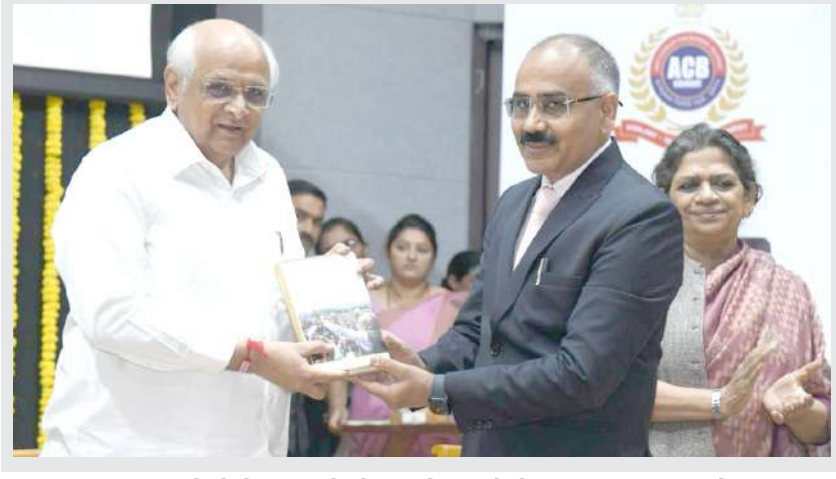
ગુનાની સજા થાય ત્યારે જે તે વ્યક્તિએ એકલા એજ ભોગવવી પડે છે. આ સંદર્ભમાં તેમણે વાલિયા માંથી વાલ્મીકી ઋષીનું ઉદાહરણ આપ્યું હતું.

મુખ્યમંત્રી શ્રી ભૂપેન્દ્ર પટેલે સ્પષ્ટપણે જણાવ્યું છે કે, વડાપ્રધાન શ્રી નરેન્દ્રભાઈ મોદીએ ભ્રષ્ટાચાર સામે મક્કમતાથી જન આંદોલન ઉપાડ્યું છે. તેમણે કહ્યું કે, હવે દુનિયા આખીની નજર આજે ભારતમાં આવેલા બદલાવ અને વિકાસની ગતિ તરફ છે તેના મૂળમાં પણ વડાપ્રધાન શ્રી નરેન્દ્રભાઈ મોદી જેવું સક્ષમ નેતૃત્વ અને સ્ટ્રોન્ગ પોલિટિકલ વિલ છે.