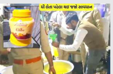
ઘી લેતા પહેલાં ઘર જળો સાવવાનું