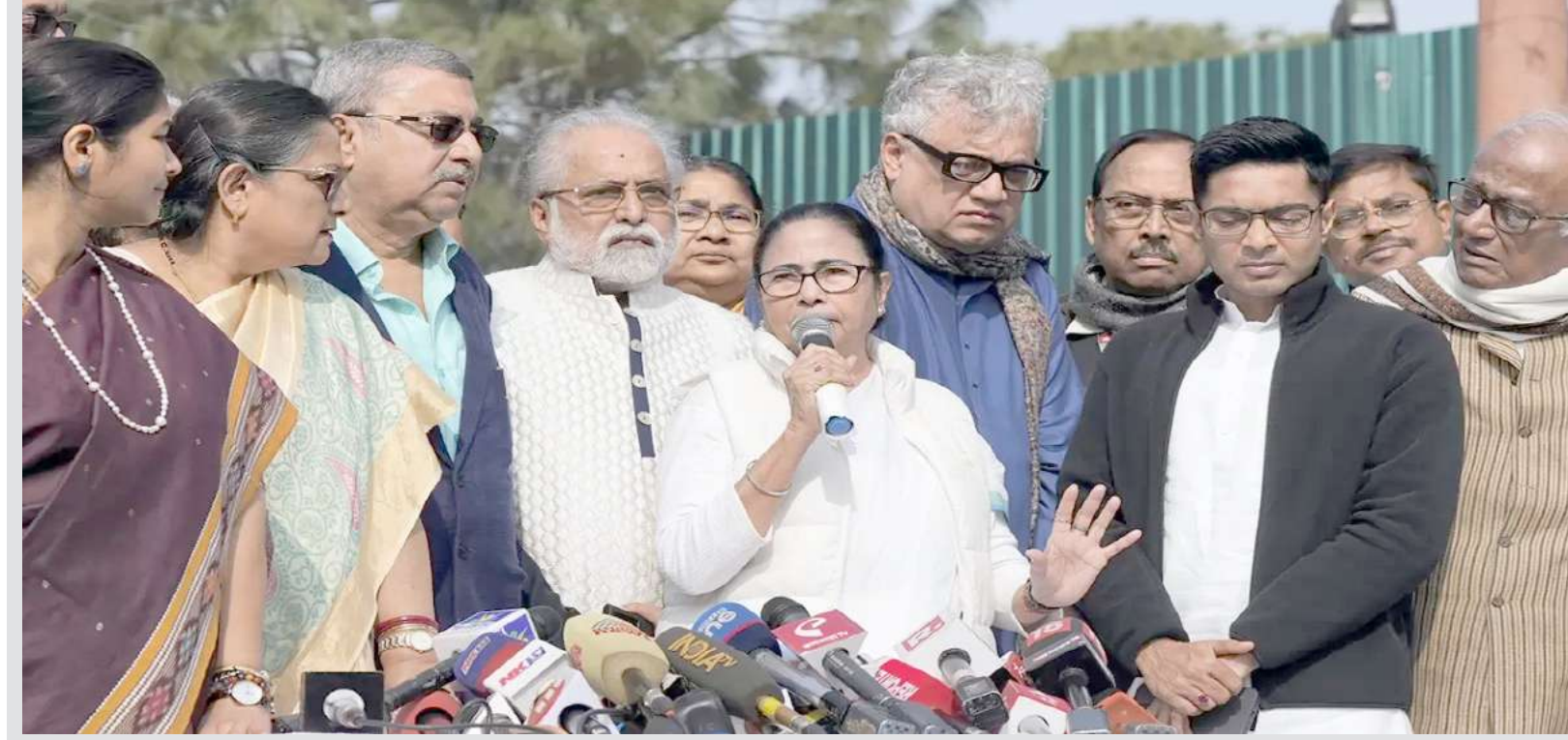
પશ્ચિમ ગંગાળના મુખ્ય પ્રધાન અને ટીએમસી સુપ્રીમો મમતા બેનર્જી પાર્ટીના સાંસદો સાથે નવી દિલ્હીમાં વિજય ચોક ખાતે મીડિયાને સંબોધિત કરતા નજરે પડે છે.