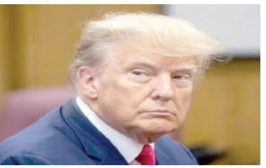
ઉમેદવારને ગેરલાયક ઠેરવવા માટે કરવામાં આવ્યો છે. કોલોરાડો ઇલેક્ટોરલ કોલેજના ૪-૩ બહુમતી નિર્ણયમાં કહ્યું કે, મોટાભાગની કોર્ટ માને છે કે ટ્રમ્પ ૧૪મા સુધારાની કલમ ૩ હેઠળ રાષ્ટ્રપતિ પદ સંભાળવા માટે અયોગ્ય છે. મીડિયા રિપોર્ટ્સ અનુસાર ટ્રમ્પ વિરુદ્ધ ચુકાદો

1 નવી દિલ્હી, તા.૨૦ । રાષ્ટ્રપતિની ચૂંટણી માટે પ્રચાર કરી રહેલા અમેરિકાના પૂર્વ રાષ્ટ્રપતિ ડોનાલ્ડ ટ્રમ્પને મોટો ઝટકો લાગ્યો છે. કોલોરાડો રાજ્યની મુખ્ય અદાલતે મંગળવારે કેપિટલ હિંસા કેસમાં ટ્રમ્પને યુએસ બંધારણ હેઠળ રાષ્ટ્રપતિ પદ માટે અયોગ્ય જાહેર કર્યા છે. કોર્ટે રિપબ્લિકન પાર્ટી તરફથી ઘાઈટ હાઉસની રેસમા સામેલ રિપબ્લિકન પાર્ટીના મુખ્ય દાવેદાર ટ્રમ્પને રાષ્ટ્રપતિ પદ માટેના રાજ્યના પ્રાથમિક મતદાનમાંથી દૂર કર્યા છે. અમેરિકાના ઈતિહાસમાં આ પહેલીવાર બન્યું છે કે ૧૪મા સુધારાની કલમ ૩નો ઉપયોગ રાષ્ટ્રપતિ પદના