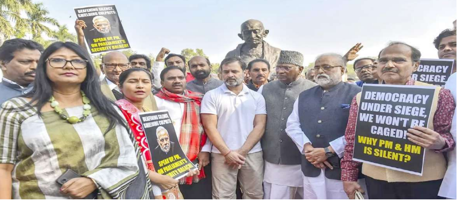
નવી દિલ્હીમાં સંસદના શિયાળુ સત્ર દરમિયાન મહાત્મા ગાંધીની પ્રતિમા પાસે વિરોધ પ્રદર્શન દરમિયાન કોંગ્રેસના સાંસદો સાથે મલ્લિકાર્જુન ખડગે અને રાહુલ ગાંધી પણ જોડાયા હતાં.