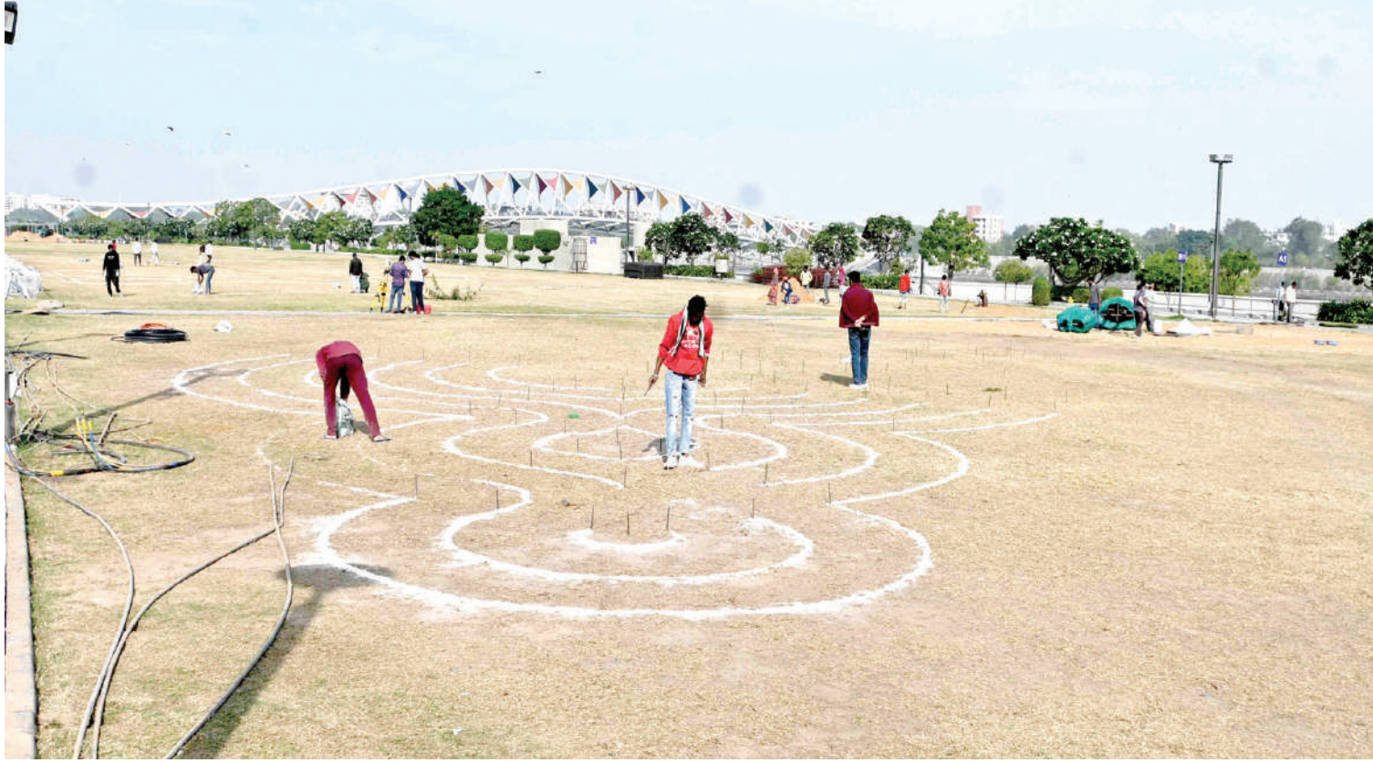
સાબરમતી રિવરફ્રન્ટમા ફલાવર શોની ચાલી રહેલ તૈયારી જેમા વિવિધ પ્રકારના ફૂલના રમકડા બનાવી રહેલ કારીગર.

ભોપાલ, તા.૧૯ | ભોપાલ ડિવિઝનના રામગંજ મંડી-ભોપાલ સ્ટેશન વચ્ચે નવી બ્રોડગેજ રેલ લાઈનના કામના સંબંધમાં સંત હિરદારામ નગર સ્ટેશન પર નોન-ઈન્ટરલોકિંગ કાર્યને કારણે ગાંધીનગર કેપિટલ-વારાણસી સાપ્તાહિક એક્સપ્રેસ રદ રહેશે. જેની વિગતો નીચે મુજબ છે: - ૧. ૨૭ ડિસેમ્બર, ૨૦૨૩ અને ૦૩ જાન્યુઆરી, ૨૦૨૪ની ટ્રેન નંબર ૨૨૪૬૭ વારાણસી ગાંધીનગર કેપિટલ સુપરફાસ્ટ એક્સપ્રેસ રદ રહેશે. ૨. ૨૮ ડિસેમ્બર, ૨૦૨૩ અને ૦૪ જાન્યુઆરી, ૨૦૨૪ની ટ્રેન નંબર ૨૨૪૬૮ ગાંધીનગર કેપિટલ-વારાણસી સુપરફાસ્ટ એક્સપ્રેસ રદ રહેશે. ટ્રેનના સ્ટોપેજ, સંરચના, રૂટ અને સમય વિશે વિગતવાર માહિતી માટે યાત્રીને એ કૃપા કરીને www.enquir.indianrail.gov.in ની મુલાકાત લેવી.