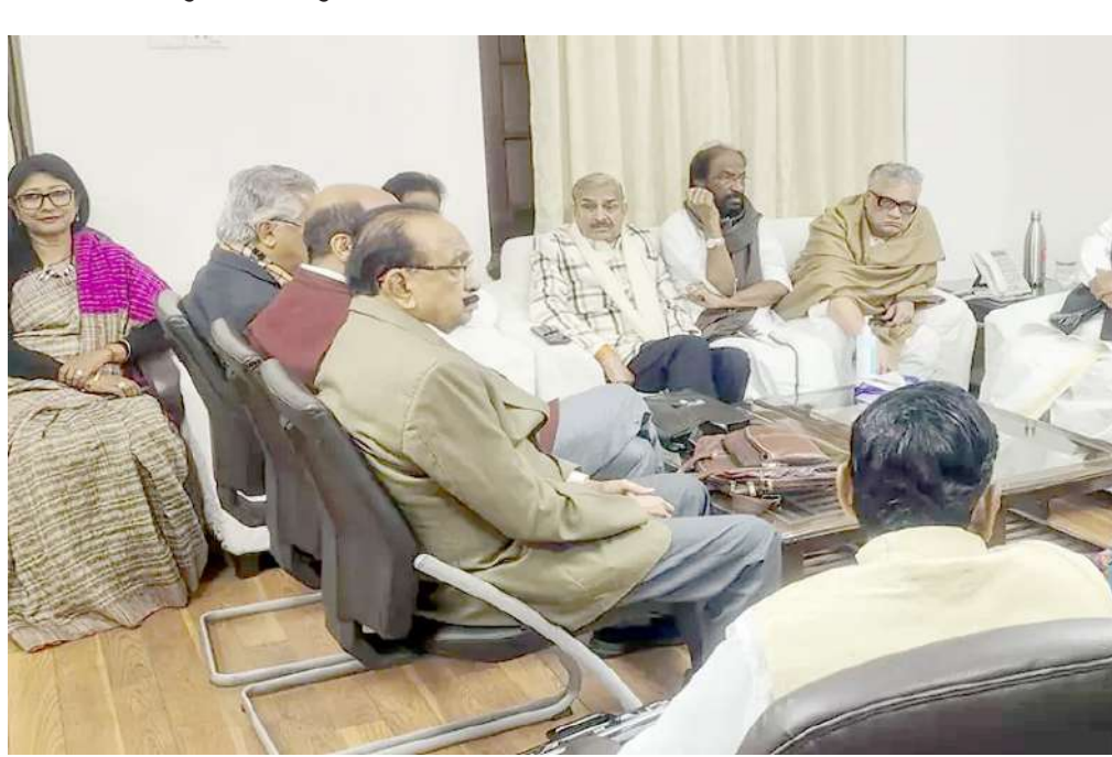
કોંગ્રેસ અધ્યક્ષ અને રાજ્યસભામાં વિપક્ષના નેતા મલ્લિકાર્જુન ખડગે નવી દિલ્હીમાં શિયાળુ સત્ર દરમિયાન સંસદ ભવનમાં તેમની ચેમ્બરમાં અન્ય વિપક્ષી નેતાઓ સાથે બેઠક કરી હતી.