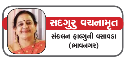
સદગુરુ પર્યાનામૃત સંકલન ફાલગુની વસાવડા (ભાવનગર)