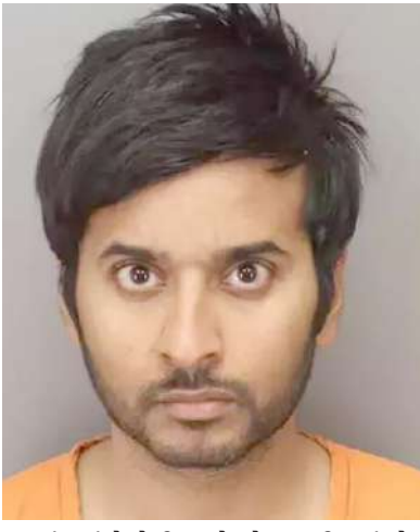
આવ્યું હતું કે તેની સામે વોરન્ટ નીકળ્યું છે, અને જો તેને ધરપકડથી બચવું હોય તો તેણે પોતાના બેંક અકાઉન્ટમાં જમા પડેલી તમામ રકમ વીરૂં કરીને તેને ટ્રેઝરી એજન્ટને આપી દેવી પડશે. આ ધમકી મળ્યા બાદ વિક્ટિમે