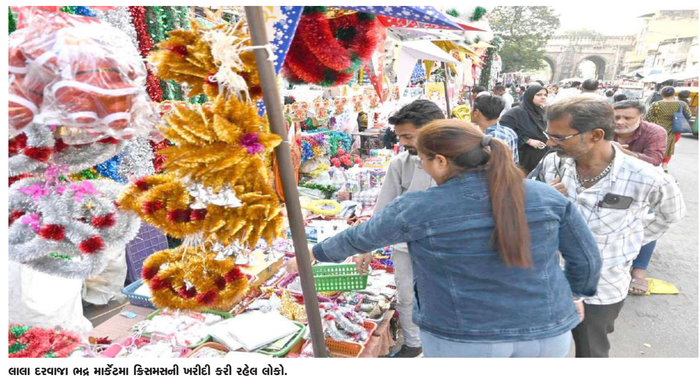
લાલા દરવાજા ભદ્ર માર્કેટમાં કિસમસની ખરીદી કરી રહેલ લોકો.

ગોંડલ, તા.૧૪ | ભારત સરકાર દ્વારા ડુંગળીની નિકાસ પર પ્રતિબંધ મુકવામાં આવ્યા ખેડૂતોને રોવાનો વારો આવ્યો છે. આ નિકાસ પ્રતિબંધને કારણે ડુંગળીના ભાવ સાવ તળિયે પહોંચી ગયા છે. જેના કારણે ખેડૂતોને ડુંગળી પકવવા માટે ખર્ચ કાઢવો પણ મુશ્કેલ થઈ રહ્યો છે. ડુંગળીના ભાવ ન મળતા સૌરાષ્ટ્રના સૌથી મોટા ગોંડલ માર્કેટ યાર્ડના ખેડૂતોએ ચક્કાજામ કર્યો છે. ખેડૂતોએ ડુંગળી રસ્તા પર ઠાલવીને વિરોધ નોંધાવ્યો હતો. ખેડૂતો દ્વારા રસ્તા પર ચક્કા જામ કરતાં ગોંડલ જૂનાગઢ નેશનલ હાઈવે પર ટ્રાફિક જામ જોવા મળી રહ્યો છે. મોટી સંખ્યામાં ખેડૂતો રસ્તા પર ઉતર્યા છે. ખેડૂતોને ડુંગળીનો પૂરતો ભાવ ન મળતા આ વિરોધ કરવામાં આવી રહ્યો છે. નેશનલ હાઈવે પર ચારે બાજુ રસ્તા પર ડુંગળીને ખેડૂતો પોતાનો વિરોધ નોંધાવી રહ્યા છે.