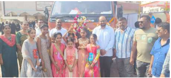
। ભરૂચ, તા.૧૪ ।

ભરૂચના અંકલેશ્વર તાલુકાના ખરોડ ગામ ખાતે વિકસિત ભારત સંકલ્પ યાત્રા કાર્યક્રમ યોજાયો હતો. આ પ્રસંગે લોકોને સરકારની વિવિધ કલ્યાણકારી યોજનાઓના લાભ લેવા માટે અનુરોધ કરાયો હતો. ઉપરાંત આ કાર્યક્રમમાં મહાનુભાવોના વરદહસ્તે વિવિધ સરકારશ્રીની ૧૭ જેટલી યોજનાઓના લાભાર્થીઓને લાભોનું વિતરણ કરવામાં આવ્યું હતું.