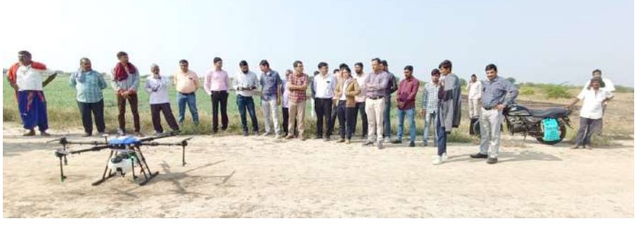
। ઘોલેરા, તા.૧૪ ।

ડ્રોન કેમોસ્પેશન, સોઈલ હેલ્થ કાર્ડ અને પ્રાકૃતિક કૃષિ અંગે ગ્રામજનોને જાગૃત કરવામાં આવ્યાં