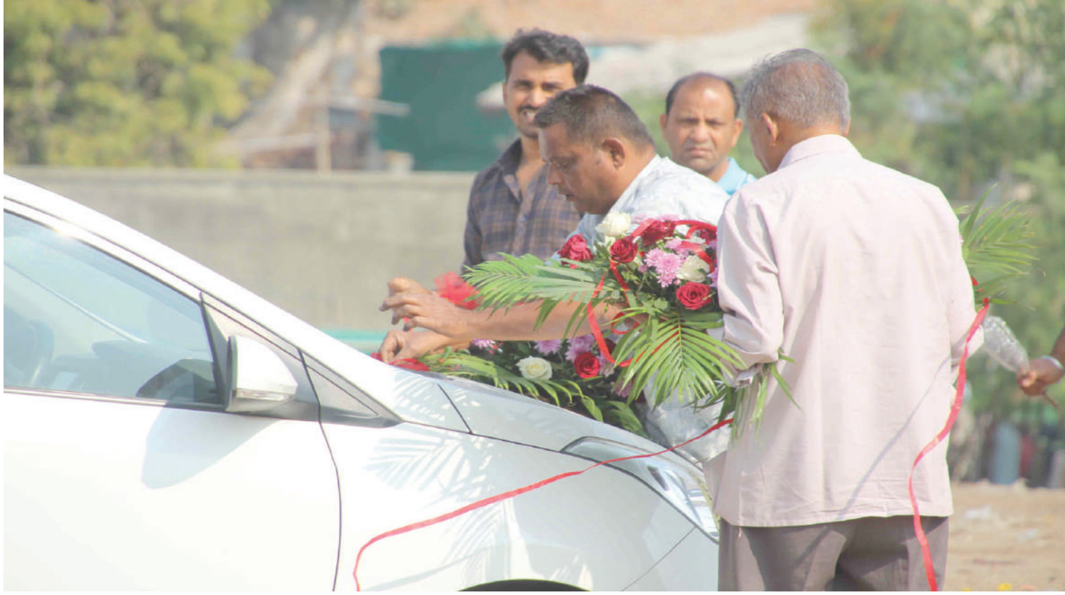
અમદાવાદમાં આજે લગ્ન પુષ્કળ હતા જેથી જમાલપુર ફૂલ બજારમાં વરઘોડા માટેની કારને સજાવી રહેલ કારીગર.

અમદાવાદ, તા.૧૪ | સાંઇદના નળકાંઠા વિસ્તારના ખેડૂતોની દૈનિકીય સ્થિતિ જોવા મળી રહી છે. તંતના વાંકે ૧૦ ગામોના ખેડૂતોનો ઉભો પાક ધોવાયો છે. આપને જણાવીએ કે, ફતેવાડી કેનાલમાં પાણી છોડાતાં હજારો હેક્ટરમાં પાણી ફરી વળ્યું છે. રેથલ, ગુંડળ, પાવા, મેલબણા સહિતના ૧૦ ગામોના ખેતરો પાણીમાં ગરકાવ થયા છે. ઘઉં જીરું, રાયડો સહિતના શિયાળુ પાક પર કેનાલનો પાણી ફરી વળ્યો છે. ખેડૂતો જ્યારે પાણીની માગ કરે ત્યારે પાણી ન આપતાં હોવાનો આરોપ લગાવવામાં આવી રહ્યું છે. અચાનક પાણી છોડાતાં કરોડોની ખેતપેદાશો પાણીમાં ગરકાવ થયો છે.