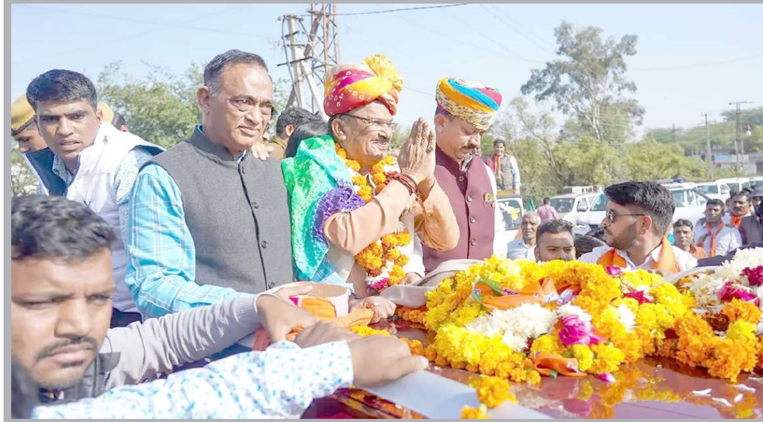
અખેરમાં નવા ચૂંટાયેલા રાજસ્થાન વિધાનસભાના અધ્યક્ષ વાસુદેવ દેવનાનીનું ભાજપના કાર્યકરો દ્વારા સ્વાગત કરવામાં આવ્યું હતું.

અપાય છે, મતલબ કે એક અઠવાડિયામાં જો કોઈએ ૪૦ કલાક કે તેથી ઓછું કામ કર્યું હોય તો તેને મિનિમમ વેજ અનુસાર સેલેરી મળે છે, પરંતુ જો કોઈ વ્યક્તિ રોજના આઠ કલાકથી વધુ પણ ૧૨ કલાકથી ઓછું કામ કરે તો તેને ઓવર ટાઈમનો દોઢો પગાર ચૂકવવો પડે છે, જ્યારે ૧૨ કલાકથી વધુ કામ કરવાનો ઓવર ટાઈમ મિનિમમ વેજથી ૩બલ હોય છે. મોટાભાગે મોટેલ, રેસ્ટોરાં, ગેસ સ્ટેશન કે પછી સ્ટોર્સ તેમજ નાના-મોટા બિઝનેસમાં કામ કરતા લોકોને મિનિમમ વેજ અનુસાર પગાર મળતો હોય છે. જે સ્ટેટ્સમાં મિનિમમ વેજ વધારે હોય છે ત્યાં કોસ્ટ ઓફ લિવિંગ પણ ઉંચી હોય છે, જ્યારે ઓછી મિનિમમ વેજ ઓફર કરતાં સ્ટેટ્સમાં કોસ્ટ ઓફ લિવિંગ નીચી હોય છે.