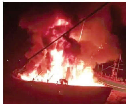
બની હતી. મળતી માહિતી અનુસાર સલાયા પરત ફરતી વખતે એન્જિનમાં આગ લાગી હોવાનું સામે આવ્યું હતું. તો સદનસીબે દુર્ઘટનામાં કોઈ પણ પ્રકારની જાનહાનિ થઈ નથી.

દેવભૂમિ દ્વારકાના સલાયા બંદરે લાંગરેલી ફિશિંગ બોટમાં આગ લાગવાની ઘટના સામે આવી છે. તો માછીમારની બોટમાં એકાએક આગ ભભૂકી ઉઠી હતી. જો કે સદનસીબે આગમાં કોઈ પણ જાનહાનિની ઘટના બની નથી. દેવભૂમિ દ્વારકાના સલાયા બંદરે લાંગરેલી ફિશિંગ બોટમાં આગ લાગવાની ઘટના સામે આવી છે. તો માછીમારની બોટમાં એકાએક આગ ભભૂકી ઉઠી હતી. જો કે સદનસીબે આગમાં કોઈ પણ જાનહાનિની ઘટના બની નથી. બોટની કેબિનમાં રહેલો સામાન બળીને ખાખ થઈ ગયો છે. તો જોડે આગ લાગવાનું કારણ હજી અકબંધ છે. તો આ અગાઉ ઓમાનના ખરાબ ખાતે અલી મદદ નામના વાહણમાં આગ લાગવાની ઘટના