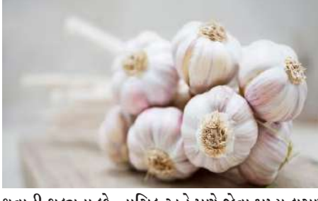
થવાની શક્યતા છે. નાસિક અને પુણે જેવા મુખ્ય લસણ ઉત્પાદક રાજ્યોમાં ખરાબ હવામાનને કારણે

ભાવને અસર થઈ રહી છે. કમોસમી વરસાદ તેમજ ખરાબ હવામાનના કારણે ટમેટા, ડુંગળી, આદુ બાદ હવે લસણના ભાવમાં પણ વધારો થયો છે. ખરાબ હવામાનના કારણે લસણના પાકને નુકસાન થયું હોવાની તેના ઉત્પાદન પર અસર પડી છે અને આવકમાં ઘટાડો થયો છે. જેને કારણે લસણના ભાવમાં તેજી આવી છે. જેના કારણે લસણ ૨૫૦ થી ૩૦૦ રૂપિયા કિલો વેચાઈ રહ્યું છે. લસણના ભાવમાં ધરખમ વધારો થતાં ગૃહિણીઓનું બજેટ પણ ખોરવાયું છે. જો કે આવનારા દિવસોમાં લસણની આવક શરૂ થતા તેના ભાવ ઘટાડો