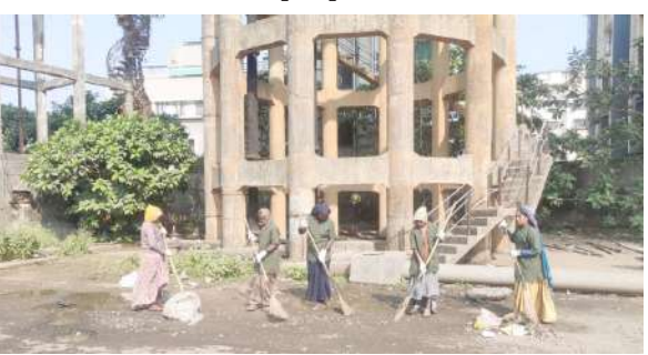
। વલસાડ, તા.૧૪ ।

સરકારશ્રીના સ્વચ્છ ભારત મિશન - શહેરી અંતર્ગત "૧૫મી ઓક્ટોબર થી ૧૬મી ડિસેમ્બર ૨૦૨૩" સુધી "સ્વચ્છતા હી સેવા (SHS)" કાર્યક્રમ અંતર્ગત ૧૪ ડિસેમ્બરના રોજ વલસાડ,