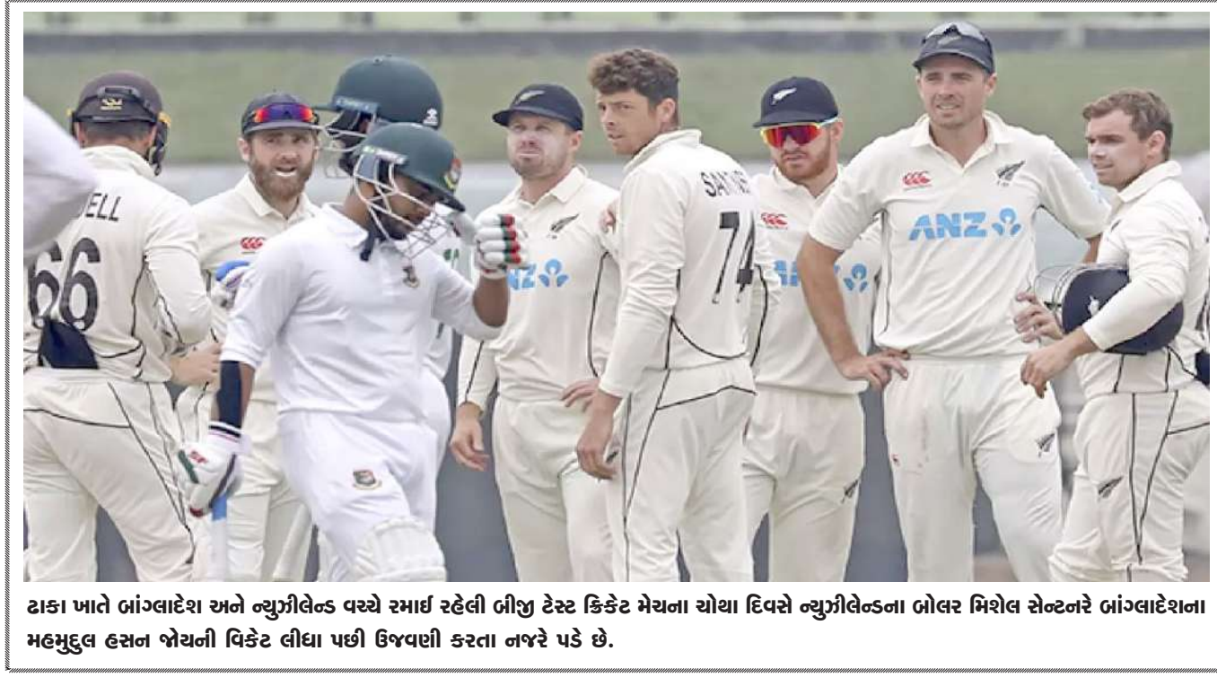
ટાકા ખાતે બાંગ્લાદેશ અને ન્યુઝીલેન્ડ વચ્ચે રમાઈ રહેલી બીજી ટેસ્ટ ક્રિકેટ મેચના ચોથા દિવસે ન્યુઝીલેન્ડના બોલર મિશેલ સેન્ટનરે બાંગ્લાદેશના મહમુદુલ હસન ખોયની વિકેટ લીધા પછી ઉજવણી કરતા નજરે પડે છે.

પહોંચી હતી. આ પછી યુપીએ ઘણું વિચાર્યું. પરંતુ અંતે ગુજરાત જાયન્ટ્સ જીત્યું. ગુજરાતે તેને ૨ કરોડ રૂપિયામાં ખરીદી હતી. આ સાથે કાશવી ડબલ્યુપીએલઈતિહાસની સૌથી મોઠી અનકેડ ખેલાડી બની ગઈ છે. ૨૦ વર્ષીય કાશવીનું નામ વર્ષ ૨૦૨૦માં લાઈમલાઈટમાં આવ્યું હતું. ડોમેસ્ટિક ક્રિકેટમાં અંડર-૧૯ વન-ડે ટુર્નામેન્ટની એક મેચમાં તેણે હેટ્રિક સાથે તમામ ૧૦ વિકેટ પોતાના નામે કરી હતી. સિનિયર વિમેન્સ ૨૦ ટ્રોફીમાં પણ કાશવીએ ૭ મેચમાં ૧૨ વિકેટ ઝડપી હતી. હાલમાં ઈન્ડિયા-છ માટે રમતા કાશવીએ શાનદાર પ્રદર્શન કર્યું હતું.