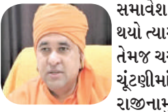
તરીકે તેમના નામની સૌથી વધુ ચર્ચા થઈ રહી છે ત્યારે હવે તેમને જ સોશિયલ મીડિયા પ્લેટફોર્મ પર એક પોસ્ટ કરીને આ અટકળો પર પૂર્ણવિરામ મુકવાનો પ્રયાસ કર્યો છે.

બાબા બાલકનાથ અલવર લોકસભા મતવિસ્તારમાંથી ૨૦૧૯માં ભાજપે ટિકિટ આપતા સાંસદ તરીકે ચૂંટાયા હતા જો કે પાર્ટીએ તેમને આ વખતે રાજસ્થાન વિધાનસભાની ચૂંટણીમાં તિજારા બેઠક પરથી ટિકિટ આપી હતી જેમાં તેનો વિજય થયો હતો ત્યારે તેમણે લોકસભાના સભ્યપદેથી રાજીનામું આપી દીધું હતું. તેમના રાજીનામાં બાદ એવી ચર્ચાએ જોર પકડ્યું હતું કે પાર્ટી તેમને રાજ્યની કમાન સોંપી શકે છે. સોશિયલ મીડિયામાં પણ તેમને રાજસ્થાનના મુખ્યમંત્રી બનાવવાની માંગ ઉઠી રહી છે ત્યારે બાબા બાલકનાથે સોશિયલ મીડિયા પર એક પોસ્ટ કરી છે જેમાં તેમણે સીએમની રેસને લઈને ચાલી રહેલી