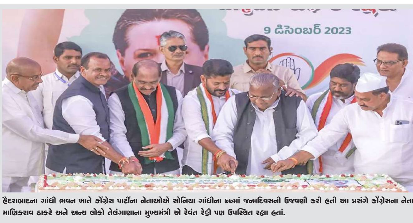
હેદરાબાદના ગાંધી ભવન ખાતે કોંગ્રેસ પાર્ટીના નેતાઓએ સોનિયા ગાંધીના ૭૭મા જન્મદિવસની ઉજવણી કરી હતી આ પ્રસંગે કોંગ્રેસના નેતા માણિકરાવ ઠાકરે અને અન્ય લોકો તેલંગાણાના મુખ્યમંત્રી એ રેવંત રેડ્ડી પણ ઉપસ્થિત રહ્યા હતાં.