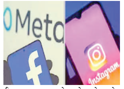
ઈન્સ્ટાગ્રામ પર બાળકોના શોષણનો આરોપ લગાવતા કેસ દાખલ કર્યો છે. ન્યૂ મેક્સિકોના એટર્ની જનરલે રાઉલ ટોરેઝે આક્ષેપ કર્યો છે કે ફેસબુક અને ઇન્સ્ટાગ્રામ અશલીલતાને પ્રોત્સાહન આપે છે અને વાંધાજનક પોસ્ટ દ્વારા

મેક્સિકો, તા.૯ | અત્યારના સમયમાં મોબાઈલમાં ઓટીટી પર અને ઓનલાઈન ફિલ્મો અને રીલ્સ જોવાનું ચલણ ખૂબજ વધી ગયું છે. ત્યારે નાના નાના બાળકો પણ આખો આખો દિવસ મોબાઈલ જોતા હોય છે. ત્યારે જ્યારે બાળકોને સર્ચ કરતા આવડી જાય પછી તો બાળકો ફોનમાં ગમે તેવા કન્ટેન્ટ જોતા હોય છે અને તેની સીધી અસર બાળકો પર જોવા મળે છે. ત્યારે હવે સોશિયલ મીડિયાના થતા દુરુપયોગ સામે અમેરિકાના ન્યૂ મેક્સિકોના એટર્ની જનરલે મેટાના સોશિયલ મીડિયા પ્લેટફોર્મ ફેસબુક અને ઇન્સ્ટાગ્રામ સામે મોરચો ખોલ્યો છે. એટર્ની જનરલે ફેસબુક અને