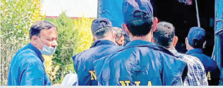
નેટવર્કનો ખુલાસો થયો હતો, ત્યારબાદ જેમાં ખબર પડી કે આ કેસમાં એક મોટી અને જાણીતી વ્યક્તિ સંડોવાયેલી છે. ત્યાર

છે. અન્ય પકડાયેલા શકમંદો પાસેથી બોમ્બ બનાવવાની સામગ્રી પણ જપ્ત કરવામાં આવી છે. જેના કારણે એક મોટા પડચંત્રને નિષ્ફળ બનાવવામાં સફળતા મળી છે. સૂત્રોના જણાવ્યા અનુસાર આઈએસઆઈએસના નેટવર્કને નષ્ટ કરવા માટે આ સમગ્ર ઓપરેશન હાથ ધરવામાં આવ્યું હતું. એનઆઈએના દરોડામાં મુંબઈ-પુણેમાં બે બાઈક ચોરની ધરપકડ કરવામાં આવી હતી. તેમની પૂછપરછમાં આઈએસઆઈએસના