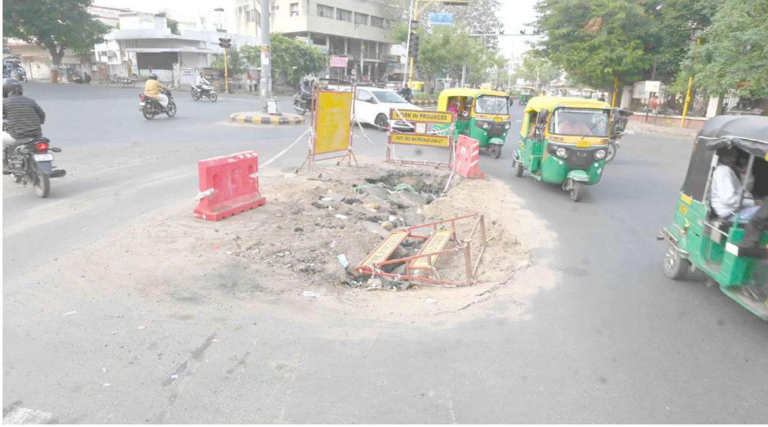
ભીમજીપુરા ચાર રસ્તા પર છસ્રા દ્વારા ડ્રેનેજ માટે કરેલ ખાડો હજુ સુધી પુરાયેલ નથી.

મિશ્રઋતુને કારણે રાજકોટના ધોરાજીમાં વાયરલ રોગચાળાએ માથું ઊંચક્યું છે. તહેવારો બાદથી જ ધોરાજી સિવિલ હોસ્પિટલમાં દર્દીઓની સંખ્યામાં વધારો થયો છે. સિવિલ હોસ્પિટલમાં દરરોજ ૪૦૦થી ૫૦૦ જેટલા દર્દીઓની ઓપીડી નોંધાઈ રહી છે. ગુજરાતમાં ભર શિયાળામાં કમોસમી વરસાદ વરસી રહ્યો છે. તો ક્યાંક વાદળાણુ વાતાવરણ જોવા મળી રહ્યું છે. મિશ્રઋતુને કારણે રાજકોટના ધોરાજીમાં વાયરલ રોગચાળાએ માથું ઊંચક્યું છે. તહેવારો બાદથી જ ધોરાજી સિવિલ હોસ્પિટલમાં દર્દીઓની સંખ્યામાં વધારો થયો છે. સિવિલ હોસ્પિટલમાં દરરોજ ૪૦૦થી ૫૦૦ જેટલા દર્દીઓની ઓપીડી નોંધાઈ રહી છે. જેમાં તાવ, શરદી ઉધરસના કેસોમાં વધારો જોવા મળી રહ્યો છે. આ રોગચાળાના પગલે સિવિલ હોસ્પિટલમાં તમામ પ્રકારની દવા અને ઓક્સિજન સહિતની સુવિધાઓ ઉપલબ્ધ કરી દેવામાં આવી છે. તો હોસ્પિટલ તંત્ર દ્વારા નર્સિંગ સ્ટાફ અને ડોક્ટરોને પણ ૨૪ કલાક સ્ટેન્ડબાય રહેવા આદેશ કરાયો છે.