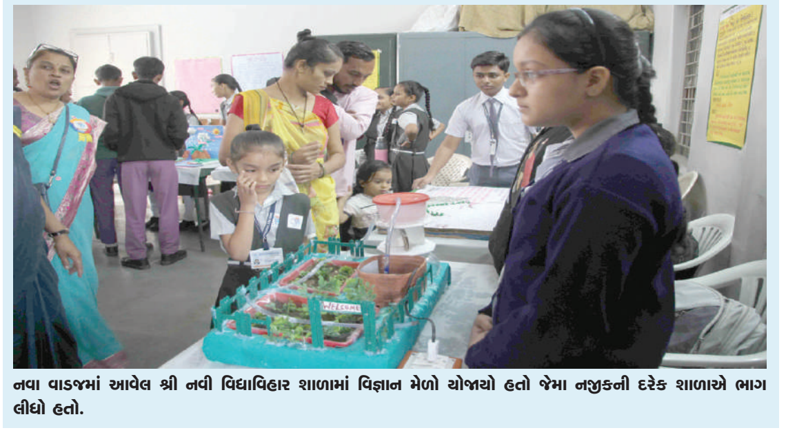
નવા વાડજમાં આવેલ શ્રી નવી વિદ્યાવિહાર શાળામાં વિજ્ઞાન મેળો યોજાયો હતો જેમા નજીકની દરેક શાળાએ ભાગ લીધો હતો.