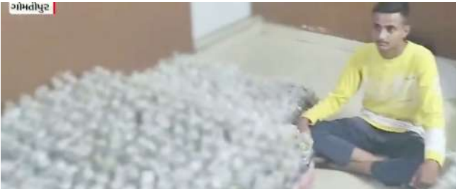
સ્ટેશનની હદમાં PCB એ દરોડા પાડી પાસે મોટી માત્રામાં દારુનો જથ્થો કુલ ૮૮ પેટીમાં ૨૦૦૦થી વધુ દારુની બોટલ ઝડપી પાડી છે. તુલસીપાર્ક પોલીસ ચોકીની સામે જુલતા મિનારા કર્યો હતો.

એક તરફ ગુજરાતમાં દારુબંધી હોવાની વાતો કરવામાં આવે છે. બીજી તરફ ગુજરાતના જ વિવિધ શહેરોમાં દારુબંધીના લીરે લીરા ઉડતા જોવા મળે છે. બુટલેગરોએ દારુની હેરાફેરી માટે નવા નવા કિમીયા અપનાવી રહ્યા છે. અમદાવાદના ગોમતીપુર વિસ્તારમાં બે હજારથી વધુ દારુની બોટલ ઝડપાઈ છે. જે માટે તેમણે અલગ કિમીયો અપનાવેલો જોવા મળી રહ્યો છે. અમદાવાદમાં ગોમતીપુર પોલીસ