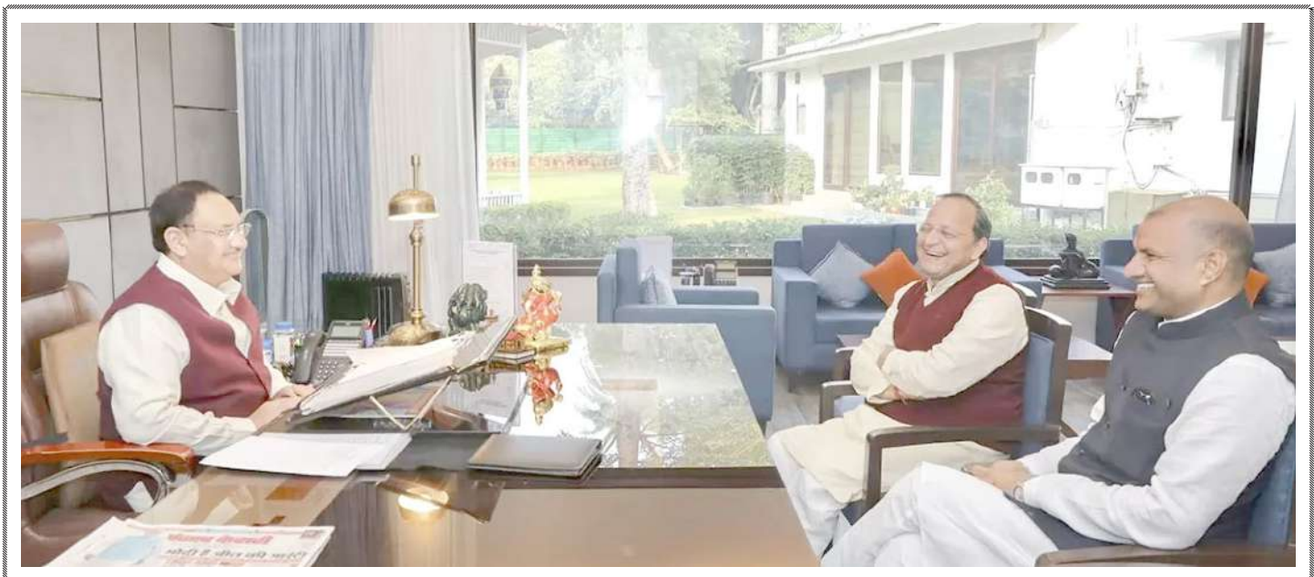
રાજસ્થાન ભાજપના પ્રભારી અરુણ સિંહ અને પ્રદેશ ભાજપ અધ્યક્ષ સી.પી. નવી દિલ્હીમાં રાજસ્થાન વિધાનસભા ચૂંટણીમાં પાર્ટીની જીત બાદ જોશી બીજેપીના રાષ્ટ્રીય અધ્યક્ષ જેપી નંદાને મળ્યા હતાં.

અધિકારીઓને તૈયારીઓ માટે એલર્ટ જાહેર કર્યું છે. રિપોર્ટ અનુસાર, ભારે વરસાદના ભય વચ્ચે આંધ્રપ્રદેશના મુખ્યમંત્રીએ લગભગ ૮ જિલ્લાઓમાં અધિકારીઓને તૈયારીઓ માટે એલર્ટ જાહેર કર્યું છે. દરમિયાન ચક્રવાતી વાવાઝોડું 'મિયોંગ' આજે સવારે ૮:૩૦ વાગ્યે ચેન્નઈથી લગભગ ૮૦ કિમી પૂર્વ-ઉત્તરપૂર્વમાં તીવ્ર ચક્રવાતી તોફાનમાં રૂપાંતરિત થયું હતું. હવામાન વિભાગે ૪ અને ૫ ડિસેમ્બરે ઉત્તર-તટીય તમિલનાડુ અને પુડુચેરીમાં ભારેથી અતિ ભારે વરસાદની ચેતવણી આપી છે.