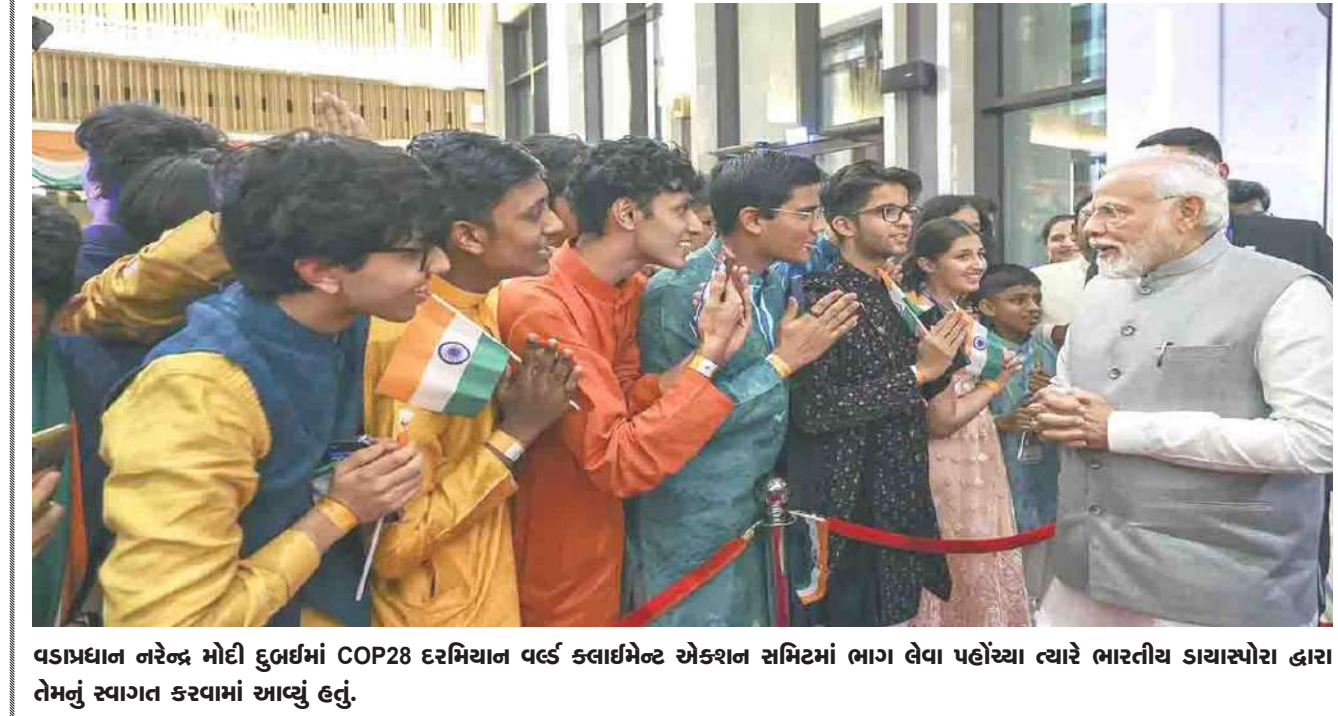
વડાપ્રધાન નરેન્દ્ર મોદી દુબઈમાં COP28 દરમિયાન વર્લ્ડ ક્લાઈમેન્ટ એક્શન સમિટમાં ભાગ લેવા પહોંચ્યા ત્યારે ભારતીય ડાયરેક્ટર દ્વારા તેમનું સ્વાગત કરવામાં આવ્યું હતું.

। મુંબઈ, તા. ૧ । શેરબજારનો કારોબાર શુક્રવારે ભમ્પર તેજ સાથે સમાપ્ત થયો. બીએસઈ સેન્સેક્સ ૪૯૩ પોઈન્ટના ઉછાળા સાથે ૬૭૪૮૧ના સ્તરે બંધ થયો હતો જ્યારે નેશનલ સ્ટોક એક્સચેન્જનો નિક્ફટી ૧૩૪ પોઈન્ટથી વધુના ઉછાળા સાથે ૨૦,૨૬૮ના સ્તરે બંધ થયો હતો. શુક્રવારે શેરબજારના કામકાજમાં ઘણા ઉતાર-ચઢાવ જોવા મળ્યા હતા. ગુરુવારે, એનએસઈનિક્ફટી ૨૦૧૩૩ના સ્તરે પર બંધ થયો હતો, જે શુક્રવારે ૨૦ ૧૮૪ ના સ્તર પર ખુલ્યો હતો અને તે દિવસના કારોબારમાં ૨૦૨૮૧ ના સ્તરને પણ સ્પર્શ્યો હતો. બીએસઈસેન્સેક્સના ટોપ ગેઈનર્સ વિશે વાત કરીએ તો, તેમાં ટીવી૧૮ બ્રોડકાસ્ટ, પાવરફાઈનાન્સ કોર્પોરેશન, એમટીએનએલ, ડિક્સન ટેકનોલોજીના શેરનો સમાવેશ થાય છે. ડબ્લ્યુપલ, ઓરિએન્ટ સિમેન્ટ અને અશોક લેલેન્ડ જેવી કંપનીઓના શેર ટોપ લૂસર્સની યાદીમાં સામેલ હતા. માસિક ધોરણે, વિદેશી સંસ્થાકીય રોકાણકારોએ ડિસેમ્બરમાં ૭૭૧ મિલિયન ડોલરની કમી કરી છે. વિદેશી સંસ્થાકીય રોકાણકારોએ ડિસેમ્બર સિરીઝની શરૂઆતમાં ઈન્ડેક્સ ફ્યુચર્સમાં ૭૭૧ મિલિયન ડોલરનો ઘટાડો કર્યો છે. છેલ્લી સપ્તાહિ પર વિદેશી રોકાણકારોની ટૂંકી સ્થિતિ ઈ૧૮૦૮ મિલિયન હતી. નિક્ફટીનું ફ્યુચર રોલઓવર ૭૩ ટકાની સરખામણીએ સરેરાશ ૭૮ ટકા રહ્યું છે. છેલ્લી ત્રણ શ્રેણીની સરખામણી કર્યા બાદ ઘણા બ્રોકરેજ દ્વારા આ માહિતી આપવામાં આવી છે. શુક્રવારે, નિક્ફટી મિડકેપ ૧૦૦ શેરબજારમાં એક ટકાનો વધારો નોંધાયો હતો.