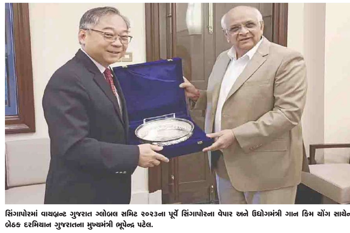
સિંગાપોરમાં વાયફ્રન્ટ ગુજરાત ગ્લોબલ સમિટ ૨૦૨૩ના પૂર્વે સિંગાપોરના વેપાર અને ઉદ્યોગમંત્રી ગાન કિમ યોંગ સાથેની ભેટક દરમિયાન ગુજરાતના મુખ્યમંત્રી ભૂપેન્દ્ર પટેલ.