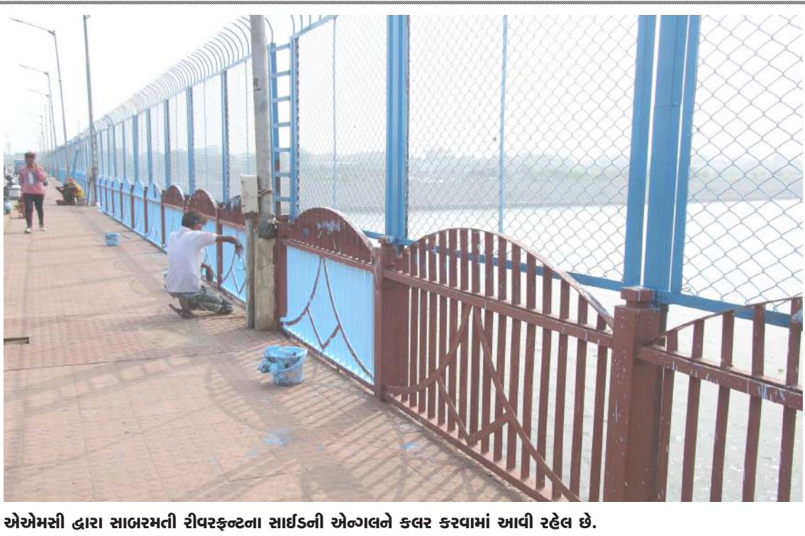
એએમસી દ્વારા સાબરમતી રીવરફ્રન્ટના સાર્થકની એંગલને કલર કરવામાં આવી રહેલ છે.