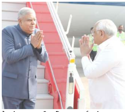
તેમનું સ્વાગત કરી અભિવાદન કર્યું હતું.