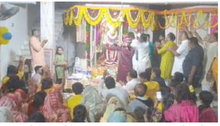
મધ્યપ્રદેશ અને ગુજરાતના શ્યામ ભક્તો મોટા પ્રમાણમાં જોવા મળતા હતા.

ગાલોદ નગરમાં બાબા શ્યામનો જન્મોત્સવ તારીખ ૨૩-૧૧-૨૦૨૩ ગુરુવારના રોજ ધૂમધામ પૂર્વક કરવામાં આવી હતી. બાબા શ્યામના જન્મોત્સવ નિમિત્તે બાબા શ્યામના જન્મોત્સવ નિમિત્તે શ્યામ હવેલી ખાતે ધામધૂમ પૂર્વક કરવામાં આવી હતી. સવારથી જ બાબા શ્યામના મંદિરે મોટા પ્રમાણમાં બાબા શ્યામના ભક્તો મોટા પ્રમાણમાં દર્શનાર્થે ઉમટી પડેલ હતા. આખા દિવસ દરમ્યાન બાબા શ્યામના મંદિરે દર્શન કરવા માટે શ્રદ્ધાળુઓની લાંબી લાઈન લાગી હતી. બાબા શ્યામના જન્મોત્સવ નિમિત્તે શ્યામ પ્રેમીઓમાં ખુશી જોવા મળતી હતી. બાબા શ્યામના જય જયકાર સાથે આખું ગગન ગુંજી ઉઠ્યું હતું. આખા મંદિરના પ્રાંગણમાં શીશ કે દાની કી જય, શ્યામ પ્યારે કી જય જેવા જયકાર સાથે ભક્તો બાબા શ્યામને જન્મોત્સવની શુભકામનાઓ આપી તે જોવા મળતા હતા.