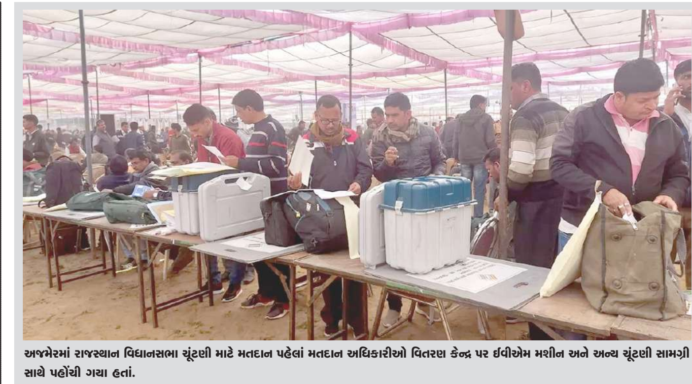
અજમેરમાં રાજસ્થાન વિધાનસભા ચૂંટણી માટે મતદાન પહેલાં મતદાન અધિકારીઓ વિતરણ કેન્દ્ર પર ઈવીએમ મશીન અને અન્ય ચૂંટણી સામગ્રી સાથે પહોંચી ગયા હતાં.

રોષ ફાટી નિકળ્યો હતો. હુમલો કરનાર વ્યક્તિ માઈગ્રન્ટ હોવાનો દાવો સોશિયલ મીડિયા પર કરવામાં આવ્યો હતો અને એ પછી લોકો રસ્તા પર ઉતર્યા હતા અને વાહનોને આગ ચાંપવા માંડી હતી. એક હોલદ અને રેસ્ટોરન્ટમાં પણ તોડફોડ કરવામાં આવી હતી. બીજી તરફ પોલીસે કહ્યું હતું કે, તોફાન કરનારાઓમાં જમણેરી વિચારધારા સાથે જોડાયેલા લોકો સામેલ છે. આ તોફાનોમાં પોલીસની એક ગાડી પણ સળગાવી દેવામાં આવી છે.