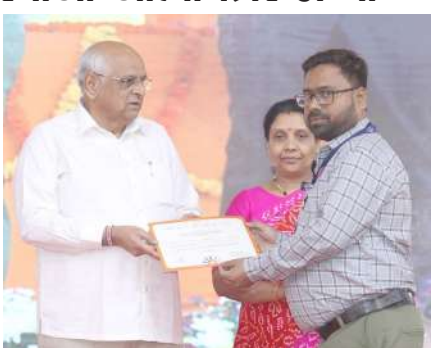
દ્વારા હુસ્મારફતે જમા કરવામાં આવે છે. તેમજ શેરી ફેરિયાઓ દ્વારા કરવામાં આવતા ડીજીટલ ટ્રાન્ઝેક્શન ઉપર વાર્ષિક મહત્તમ રૂ.૧૨૦૦/- કેશ બેંક મળવા પણ પાત્ર છે.

મુખ્યમંત્રી શ્રી ભૂપેન્દ્ર પટેલની ઉપસ્થિતિમાં અમદાવાદ મ્યુનિસિપલ કોર્પોરેશન દ્વારા પી.એમ. સ્વનિધિ યોજના અંતર્ગત શેરી ફેરિયાઓ માટે સ્નેહ મિલન સમારંભનું આયોજન કરાયું હતું. પી.એમ. સ્વનિધિ યોજના અંતર્ગત ગુજરાતમાં અત્યાર સુધી કુલ ૪.૧૦ લાખ શેરી ફેરિયાઓને પ્રથમ, દ્વિતીય અને તૃતીય લોન મળી કુલ રૂ.૭૦૩.૭૨/- કરોડ રૂપિયાની લોન આપવામાં આવી છે. રાજ્યની તમામ મહાનગરપાલિકા દ્વારા લક્ષ્યાંકને પૂર્ણ કરાયા છે. અમદાવાદ નગરપાલિકા ૧.૧૪ લાખ શેરી ફેરિયાઓને લોન આપી પ્રથમ ક્રમે રહી છે. પી.એમ. સ્વનિધિ યોજના અંતર્ગત ભારત સરકાર દ્વારા આપવામાં આવેલ લક્ષ્યાંક ૧૦૦% પૂર્ણ કરી ગુજરાત રાજ્ય સમગ્ર ભારતમાં દ્વિતીય સ્થાન ધરાવે છે.