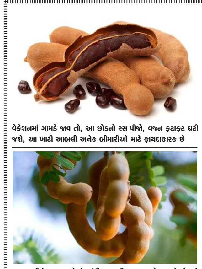
વેકેશનમાં ગામડે જાય તો, આ છોડનો રસ પીજો, વજન ફટાફટ ઘટી જશે, આ ખાટી આભલી અનેક બીમારીઓ માટે ફાયદાકારક છે

કન્ડિશનર તરીકે કામ કરે છે અને તમારા વાળને મુલાયમ અને ચમકદાર બનાવે છે. તેને લગાવવાથી વાળનો વિકાસ ખૂબ જ ઝડપથી થાય છે. ડુંગળીમાં સલ્ફરનું પ્રમાણ ઘણું હોય છે, જેના કારણે તે વાળને મજબૂત બનાવે છે અને તેને જાડા, લાંબા બનાવે છે. છોકરીઓને લાંબા વાળ ખૂબ જ પસંદ હોય છે. આજકાલ છોકરાઓમાં પણ આ ટ્રેન્ડ પોપ્યુલર થઈ રહ્યો છે. આવી સ્થિતિમાં ડુંગળીનું તેલ તમારા માટે મદદરૂપ થઈ શકે છે. ડુંગળીના તેલમાં એવા તત્વો હોય છે જે વાળને કાળા, લાંબા અને જાડા બનાવે છે. ડુંગળીનું તેલ બનાવવા માટે સૌ પ્રથમ ડુંગળીને છોલીને કટકા કરી લો. આ ડુંગળી વધારે મોટી નહીં, પરંતુ ઝીણી સમારવાની રહેશે. હવે કોકોનટ ઓઈલ અથવા જૈતુનું તેલ લો અને ગરમ કરવા માટે મુકો. તેલ ગરમ થઈ જાય એટલે એમાં સમારેલી ડુંગળી નાખો અને બરાબર ગરમ થવા દો. ધુમાડા થોડા નિકળવા લાગે એટલે ગેસ બંધ કરી દો. ખાસ ધ્યાન એ રાખો કે આ બધું ધીમા ગેસે કરવાનું રહેશે. આ તેલને ગાળીને એક બોટલમાં ભરી લો. ડુંગળીનું તેલ વાળમાં કેવી રીતે લગાવવું જોઈએ એ જાણવું ખૂબ જરૂરી છે. તમે કોઈ પણ સમયે લગાવો છો તો એનો કોઈ વધારે ફાયદો થતો નથી. ખાસ ધ્યાન એ રાખો કે વાળમાં ડુંગળીનું તેલ લગાવતા પહેલાં તમે હેર વોશ કરી લો. હેર વોશ કરવાથી વાળમાં રહેલી ગંદકી દૂર થઈ જાય છે. હેર પ્રોપર રીતે કોરા થઈ જાય એટલે આ તેલ તમારે રાત્રે ઊંઘતા પહેલાં લગાવવાનું રહેશે.