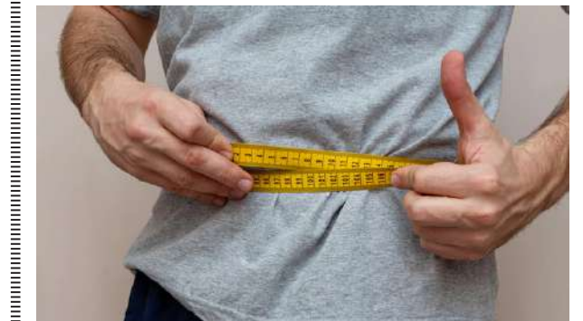
તે શરીરમાં જમા વધારાની ચરબીને બાળવાનું કામ કરે છે, આમલીના સેવનથી શરીરમાંથી વધારાની ચરબી દૂર થાય છે અને વજન ઝડપથી ઘટે છે