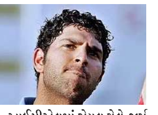
આઈપીએલમાં રોયલ ચેલેન્જર્સ બેંગલુરુની ટીમમાં પણ બંને કેટલી સીઝનમાં સાથે હતા. જ્યાં યુવરાજે ૨૦૧૯માં પોતાના ઈન્ટરનેશનલ ક્રિકેટ કારિયરને અલવિદા કહી દીધું, ત્યારે કોહલી ટીમનો ભાગ બનેલા છે. આ બંને ફેમસ ક્રિકેટર હોવાની સાથો-સાથ ફૂટબોલના પણ સારા ખેલાડી છે અને યુવરાજનું માનવું છે કે, તેઓ આ રમતમાં કોહલીથી સારું રમે છે. યુવરાજે એક ઈન્ટરવ્યુમાં કહ્યું કે, ફૂટબોલમાં મારી અને વિરાટની ખૂબ લડાઈ થઈ છે. મારી આશીષ નેહરા અને વિરેન્દ્ર સહેવાગ સાથે પણ ફૂટબોલમાં લડાઈ થઈ છે. જ્યારે યુવરાજને પૂછવામાં આવ્યું કે, કોહલી સારા ફૂટબોલર છે, તો તેમણે કહ્યું કે, વિરાટને એવું લાગે છે કે તેમની પાસે ક્ષમતા છે, પરંતુ મારા અંદર તેનાથી વધુ છે.

1 નવી દિલ્હી, તા.૧૦ | ભારતના પૂર્વ ખેલાડી યુવરાજસિંહ હાલમાં જ પોતાના નિવેદનના કારણે ચર્ચામાં છે. પૂર્વ કેપ્ટન મહેન્દ્ર સિંહ ધોની સાથે પોતાની મિત્રતાને લઈને આપેલા નિવેદન બાદ હવે તેમણે વિરાટ કોહલી અંગે મોટો ખુલાસો કર્યો છે. યુવરાજે કોહલીની મજા લેતા કહ્યું કે, 'તેઓ ખુદને ક્રિસ્ટિયાનો રોનાલ્ડો સમજે છે, પરંતુ તે છે નહીં.' યુવરાજ અને કોહલી બંને ભારત માટે એક સાથે રમી ચૂક્યા છે.