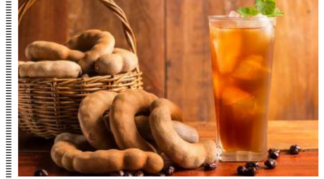
ખાસ કરીને ગામડાઓમાં ખાંટી આમલીના ઝાડ જોવા મળે છે. જે દરેક જણને ભાવતી હોય છે.