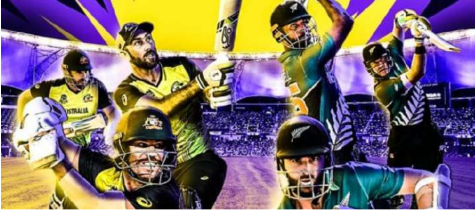
વર્લ્ડ કપ સેમિફાઈનલ ઉપરાંત ચેમ્પિયન્સ ટ્રોફી ૨૦૨૩ની ક્વોલિફિકેશન માટેની રેસ પણ હતી. આ રેસ એ ટીમો વચ્ચે હતી જે પહેલાથી જ સેમિફાઈનલની રેસમાંથી બહાર થઈ ગઈ હતી. અત્યારે આ રેસમાં ઈંગ્લેન્ડ અને બાંગ્લાદેશ આગળ હોય તેવું લાગી રહ્યું છે.

વર્લ્ડ કપ ૨૦૨૩માં ટોપ-૪ ટીમો આખરે નક્કી થઈ ગઈ છે. ગુરુવારે (૯ નવેમ્બર) રાત્રે શ્રીલંકા સામે ન્યૂઝીલેન્ડની જીત સાથે, સેમિફાઈનલની સ્થિતિ લગભગ સ્પષ્ટ થઈ ગઈ હતી. અગાઉ, ૪૦ મેચોમાં, માત્ર ત્રણ ટીમો અંતિમ ચાર માટે ટિકિટ સુરક્ષિત કરવામાં સફળ રહી હતી. ૪૧મી મેચના પરિણામ બાદ ચોથા સ્થાનનો નિર્ણય ન્યૂઝીલેન્ડે કર્યો હતો. હવે પાકિસ્તાન અને અફઘાનિસ્તાન માટે ટોપ-૪માં આવવું અશક્ય છે. કારણ કે જો આ બંને ટીમો ચોથા સ્થાને પહોંચવા માંગે છે, તો તેમને તેમની છેલ્લી મેચ અનુક્રમે ૨૮૦ અને ૪૩૮ રનથી જીતવી પડશે, જે અશક્ય છે. એકંદરે, પાકિસ્તાન અને અફઘાનિસ્તાન સેમિફાઈનલમાં ખૂબ જ નજીકથી ચૂકી ગઈ છે.