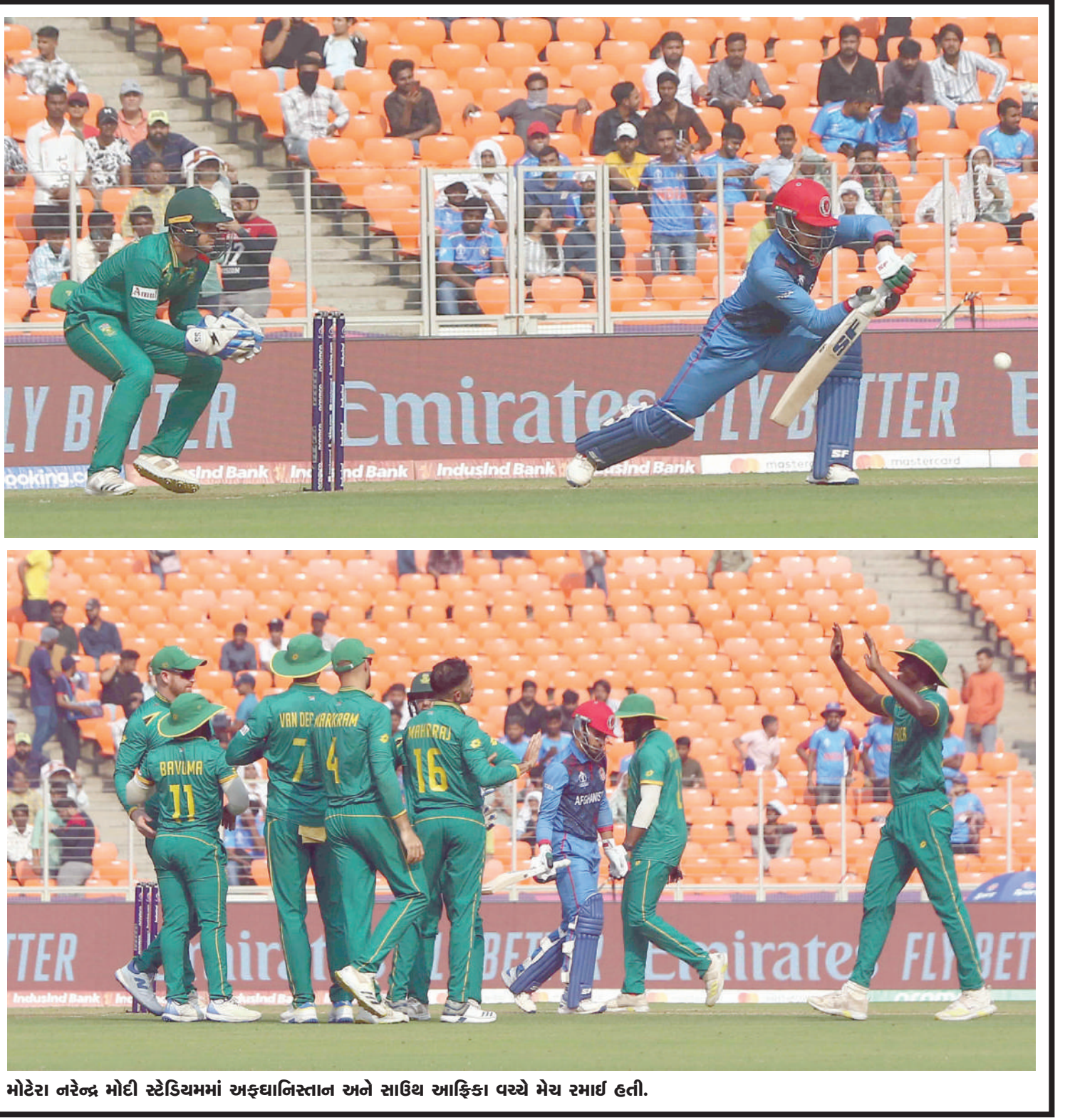
મોટેરા નરેન્દ્ર મોદી સ્ટેડિયમમાં અફઘાનિસ્તાન અને સાઉથ આફ્રિકા વચ્ચે મેચ રમાઈ હતી.

છે. જો તમે પણ દેવી લક્ષ્મીનું સ્વાગત કરવા માટે તમારા ઘરના આંગણામાં રંગોળી બનાવવા માંગો છો પરંતુ તમારી પાસે સમય ઓછો છે તો આ વખતે રંગોળી નહીં પણ ફુલોની રંગોળી બનાવો. લોકો ઘણીવાર રંગીન રંગોળી બનાવવામાં ઘણો સમય લે છે. આવી સ્થિતિમાં, ફુલોથી બનેલી આ રંગોળી ડિઝાઈન ખૂબ જ સુંદર દેખાતી નથી પરંતુ બનાવવામાં પણ ખૂબ જ સરળ છે. જો તમારી પાસે પણ આ દિવાળીમાં રંગોળી બનાવવાનો સમય નથી, તો તમે ઝડપથી ફુલોથી રંગોળી બનાવી શકો છો. મેરીગોલ્ડ ફુલો અને પાંદડાઓની રંગોળી ખૂબ જ સુંદર લાગે છે. ગણપતિની રંગોળી કર્યા પછી, તમે તમારા ઘરના મુખ્ય દરવાજા પર ફુલોથી રંગોળીની ડિઝાઈન ઝડપથી બનાવી શકો છો. ફુલની રંગોળી બનાવવી ખૂબ જ સરળ છે. રંગોળીની ડિઝાઈનમાં વધારે જગ્યા કે ફુલોની જરૂર પડતી નથી. તમે ફુલોની સરળ રંગોળીની ડિઝાઈન બનાવી શકો છો અને તેને ચમકદાર અને વશીકરણથી ભરી દેવા માટે તેને ડાયસ (તેલના દીવા) અથવા ડેકોરેટિવ લાઈટ્સથી સજાવી શકો છો.