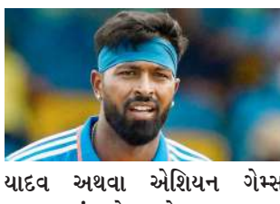
યાદવ અથવા એશિયન ગેમ્સ ૨૦૨૩માં ગોલ્ડ મેડલ જીતનાર ઋતુરાજ ગાયકવાડનું ભાગ્ય બદલી શકે છે. બીસીસીઆઈના એક સૂત્રએ જણાવ્યું હતું કે હાર્દિક માટે તે વધુ સારું રહેશે કે તે સંપૂર્ણ રીતે ફિટ થઈ જાય અને ડિસેમ્બરમાં દક્ષિણ આફ્રિકા સામેની ટી-૨૦

1 નવી દિલ્હી, તા.૧૦ | વન-ડે વર્લ્ડ કપ ૨૦૨૩ પછી ભારતીય ક્રિકેટ ટીમ ઓસ્ટ્રેલિયા સામે પાંચ T20 આંતરરાષ્ટ્રીય મેચોની શ્રેણી રમશે. આ સીરિઝ ૨૩ નવેમ્બરથી શરૂ થશે. ૨૦૨૩માં ટી-૨૦ ઈન્ટરનેશનલમાં ભારતની કેપ્ટનશીપ કરનાર હાર્દિક પંડ્યા તેના પગની ઈજાથી સંઘર્ષ કરી રહ્યો છે અને તેના માટે ઓસ્ટ્રેલિયા સામેની સીરિઝમાં રમવું મુશ્કેલ છે. આવી સ્થિતિમાં હાર્દિકની ઈજા T20ના નંબર વન બેટ્સમેન સૂર્યકુમાર શ્રેણી દ્વારા વાપસી કરે. એવું પણ કહેવામાં આવ્યું હતું કે હાર્દિકની ગેરહાજરીમાં સૂર્યકુમાર યાદવ ઓસ્ટ્રેલિયા સામેની T20 શ્રેણીમાં ભારતની કેપ્ટનશીપ માટે પ્રથમ પસંદગી હશે. સૂત્રએ જણાવ્યું હતું કે, હાર્દિકને ફિટ જાહેર કરવા અને પસંદગી માટે થોડો સમય છે. તેના માટે વધુ સારું રહેશે કે તે સંપૂર્ણ પાંચ સ્વસ્થ થઈ જાય અને દક્ષિણ આફ્રિકા સામેની શ્રેણીથી વાપસી કરે. જો કે, આ અંગેનો અંતિમ નિર્ણય NCA સ્પોર્ટ્સ સાયન્સ ટીમનો રહેશે.