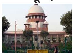
કે રાજ્યમાં ૧૨ કેસોની સુનાવણીમાંથી સીબીઆઈને હટાવવામાં આવી જોઈએ. રાજ્યએ કહ્યું છે કે રાજ્ય સરકારના અધિકારક્ષેત્રમાં આવતા કોઈપણ કેસની તપાસ માટે રાજ્યની મંજૂરી ફરજિયાત કરવામાં આવી છે. તેમ છતાં સીબીઆઈ FIR નોંધીને તપાસ કરી રહી છે. તેના પર કેન્દ્ર સરકારે દલીલ કરી હતી કે સીબીઆઈ એક સ્વતંત્ર કાયદાકીય સંસ્થા છે અને તેના પર તેનું કોઈ નિયંત્રણ નથી.

રાજ્યએ કહ્યું છે કે રાજ્ય સરકારના અધિકારક્ષેત્રમાં આવતા તમામ કેસની તપાસ માટે રાજ્યની મંજૂરી ફરજિયાત કરવામાં આવી છે 1 નવી દિલ્હી, તા.૧૦ | કેન્દ્ર સરકારે ગુરુવારે (૯ નવેમ્બર) સેન્ટ્રલ બ્યુરો ઓફ ઈન્વેસ્ટિગેશન અંગે સુપ્રીમ કોર્ટમાં જવાબ દાખલ કર્યો છે. કેન્દ્ર સરકારે કહ્યું હતું કે સીબીઆઈ એક સ્વતંત્ર કાનૂની સંસ્થા છે અને તેના પર અમારું કોઈ નિયંત્રણ નથી. પોતાના જવાબમાં કેન્દ્ર સરકારના અધિકારક્ષેત્રમાં આવતા કોઈપણ કેસની તપાસ માટે રાજ્યની મંજૂરી ફરજિયાત કરવામાં આવી છે. તેમ છતાં સીબીઆઈ FIR નોંધીને તપાસ કરી રહી છે. તેના પર કેન્દ્ર સરકારે દલીલ કરી હતી કે સીબીઆઈ એક સ્વતંત્ર કાયદાકીય સંસ્થા છે અને તેના પર તેનું કોઈ નિયંત્રણ નથી.