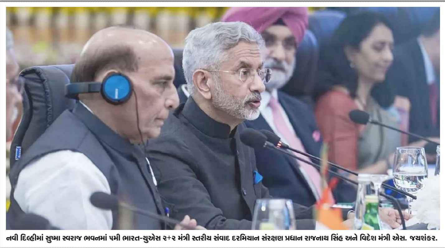
નવી દિલ્હીમાં સુખા સ્વરાજ ભવનમાં પમી ભારત-યુએસ ૨+૨ મંત્રી સ્તરીય સંવાદ દરમિયાન સંરક્ષણ પ્રધાન રાજનાથ સિંહ અને વિદેશ મંત્રી એસ. જયશંકર.

1 બ્રાન્ડાઇઝ, તા.૧૦ | વર્લ્ડ કપ ૨૦૨૩માં વિરાટ કોહલી શાનદાર ફોર્મમાં છે અને સૌથી વધુ રન બનાવવાના મામલે તે ત્રીજા સ્થાને છે. ઘણા દિવસથી વિરાટના પ્રશંસક છે ત્યારે હવે વિન્ડીઝ ટીમના પૂર્વ દિગ્ગજ વિવિયન રિચર્ડસે પણ કોહલીના ખૂબ વખાણ કર્યા હતા. વિરાટ કોહલીએ સાઉથ આફ્રિકા સામે વનરેટમાં ૪૮ સદી ફટકારી હતી. કોહલીના વિશ્વભરમાં ફેન્સ છે અને અનેક દિવસથી પણ તેની બેટિંગને પસંદ કરે છે ત્યારે હવે આ વિસ્તરમાં વેસ્ટ ઈન્ડિઝના પૂર્વ ક્રિકેટર અને ક્રિકેટ લિજેન્ડ વિવિયન રિચર્ડસે પણ સામેલ થઈ ગયા છે. રિચર્ડસે કોહલીના ખૂબ વખાણ કર્યા હતા અને તેણે કહ્યું કે હું વિરાટ કોહલીનો મોટો પ્રશંસક છું. કોહલીના વખાણ કરવામાં રિચર્ડસે કોઈ કસર છોડી ન હતી. રિચર્ડસે કહ્યું કે વર્ષ ૨૦૧૯થી ત્રણ વર્ષ સુધી કોહલીના બેટમાંથી કોઈ સદી આવી ન હતી. આ પછી કોહલીએ પોતાના શાનદાર કમબેકથી બધાને ચોંકાવી દીધા છે. કોહલીએ ૨૦૨૨થી અત્યાર સુધી કુલ ૯ સદી ફટકારી દીધી છે. રિચર્ડસે કહ્યું કે એક એવી વસ્તુ છે જે કોહલીને બીજા બધાથી અલગ બનાવે છે, તે છે તેની માનસિક શક્તિ. આ શક્તિ જ તેને આગળ લઈ જવામાં મદત્વની ભૂમિકા ભજવી છે.