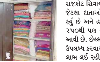
રાજકોટ સિવાય અન્ય શહેરોમાંથી ૧૦૦ જેટલા દાતાઓએ અહીંયા સાડીનું દાન કર્યું છે અને હાલ આ સાડી લાયબ્રેરીમાં ૨૫૦થી વધુ સાડી એકત્ર કરવામાં આવી છે. છેલ્લા બે મહિનાથી આ સુવિધા ઉપલબ્ધ કરવામાં આવતા મહિલાઓ તેનો લાભ લઈ રહી છે. અહીંયા તમને અલગ અલગ વેરાયટીની સાડીઓ મળી જશે. તમે તમારા પ્રસંગોને અનુરૂપ સાડીનું સિલેક્શન અહીંયાથી કરી શકો છો. જેમ, કે તમારે લગ્ન પ્રસંગમાં કોઈ સાડી પહેરવી હોય કે, કોઈ ધાર્મિક કાર્યમાં સાડી પહેરવી હોય તો તમને અહીંયાથી મફતમાં સાડી પહેરવા માટે મળી જશે.

આપણે અત્યાર સુધી પુસ્તકોની લાયબ્રેરી વિશે સાંભળ્યું હોય પણ શું તમે ક્યારેય સાડીની લાયબ્રેરી વિશે ક્યારેય સાંભળ્યું છે ? શુભ પ્રસંગે મહિલાઓ હજારો રૂપિયા ખર્ચીને સાડી પહેરતી હોય છે પણ હવે હજારો રૂપિયાની સાડી તમને પ્રસંગમાં પહેરવા ક્ષીમાં મળે તો કેવું રહે? આ સાંભળીને તમને કદાચ નવાઈ લાગશે, પણ આ હકીકત છે. રાજકોટમાં એક સાડીની લાયબ્રેરી શરૂ કરવામાં આવી છે. જ્યાંથી તમે સાડી મફતમાં પહેરવા માટે લઈ જઈ શકો છો. રાજકોટમાં યુવા સેના ટ્રસ્ટ દ્વારા આ પહેલ શરૂ કરવામાં આવી