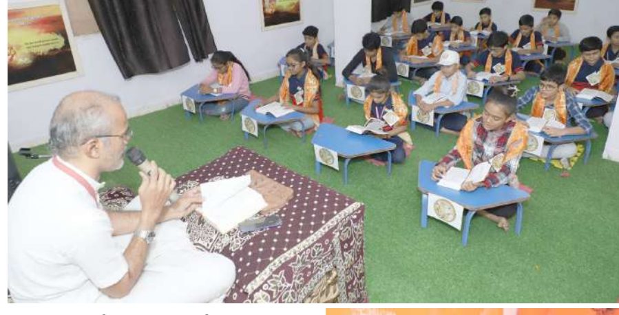
1 વરાછા, તા.૩ |

વિદ્યાર્થીઓને શ્રીમદ્ ભગવદ્ ગીતાનું જ્ઞાન મળી રહે તે માટે ગુજરાત સરકારે ભારતીય સંસ્કૃતિનું જ્ઞાન આપવા પહેલ કરી હતી. આ પહેલને જાહેર અભિયાન બનાવીને વરાછા સ્થિત અર્ચના વિદ્યા નિકેતન શાળા રાષ્ટ્ર નિર્માણ માટે લોકભાગીદારીથી ૨૮ ઓક્ટોબરથી ૩૧ ઓક્ટોબર સુધી સતત ૭૫ કલાક શ્રીમદ્ ભગવદ્ ગીતાના શ્લોકોનું પઠન કરીને વિશ્વ વિક્રમ સ્થાપેલ છે. આ વર્લ્ડ રેકોર્ડમાં વિવિધ સમાજ, ધાર્મિક સંસ્થાઓ, કંપનીઓ વગેરેના પણ સામેલ થયેલ છે.