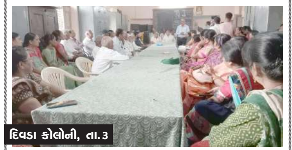
1 દિવડા કોલોની, તા.૩ |

રેકર્ડ વર્ગીકરણ દ્વારા સ્વચ્છતાની પ્રવૃત્તિઓ હાથ ધરવામા આવી છે. સ્વચ્છતા અભિયાન, ૨૦૨૩ અંતર્ગત ડાંગ જિલ્લા પંચાયતની વિવિધ શાખાઓ દ્વારા સરકારી ઓફિસોમા કર્મચારીઓ રેકર્ડ વર્ગીકરણ અને ભંગાર નિકાલની કામગીરી હાથ ધરવામા આવી હતી.