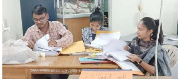
1 ડાંગ, તા.૩ |

રાષ્ટ્રવ્યાપી ‘સ્વચ્છતા હી સેવા (SHS)’ ઝુંબેશ અંતર્ગત દેશભરમા અનેકવિધ થીમ હેઠળ સ્વચ્છતાલક્ષી પ્રવૃત્તિઓ હાથ ધરવામા આવી રહી છે. સ્વચ્છતા સર્વોપરીના મંત્ર સાથે ડાંગ જિલ્લાના વિવિધ સરકારી વિભાગો દ્વારા પણ સ્વચ્છતાના ઉદ્દેશ્ય સાથે