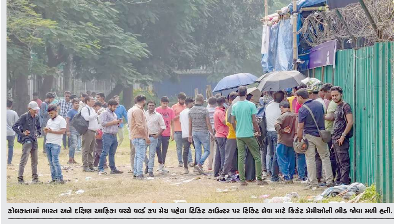
કોલકાતામાં ભારત અને દક્ષિણ આફ્રિકા વચ્ચે વર્લ્ડ કપ મેચ પહેલા ટિકિટ કાઉન્ટર પર ટિકિટ લેવા માટે ક્રિકેટ પ્રેમીઓની ભીડ જોવા મળી હતી.

નથી કે આજીવન સભ્યને આજીવન ટિકિટ મળશે. કેબ એ ખરેખર ૩૦૦૦ ટિકિટો આપી છે. ભારત-દક્ષિણ આફ્રિકા મેચની ટિકિટની સૌથી ઓછી કિંમત રૂ. ૮૦૦ છે જે કાળા બજારમાં રૂ. ૫૦૦૦ની આસપાસ વેચવામાં રહી છે. આ ઉપરાંત ૩૦૦૦, ૨૫૦૦ અને ૧૫૦૦ રૂપિયાની ટિકિટ પણ છે. મંગળવારના રોજ ન્યૂ આલીપોરનો રહેવાસી ટિકિટનું બ્લેક માર્કેટિંગ કર રહ્યો હતો ત્યારે તે પકડાય ગયો હતો. મેમ્બરશિપ ટિકિટ ઓનલાઈન કરવા બદલ પણ લોકો કેબથી પણ નારાજ છે.