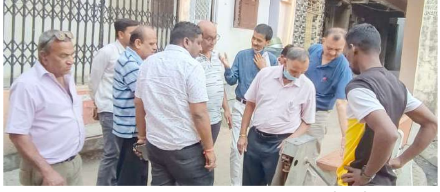
1 પંકજ પંડિત ઝાલોદ, તા.૩ |

ઝાલોદ નગરમાં આ દિવાળી ધરની દિવાળી, પોતાના વતનની દિવાળી નિમિત્તે વહિફ સમાજ દ્વારા વાઈબ્રન્ટ દિવાળી ઉત્સવ તરીકે ઉજવી રહ્યા છે. દેશ વિદેશમાં રોજગાર અર્થે વસવાટ કરતા લોકોને વતન પ્રત્યે વિશેષ પ્રેમ તેમજ આદર હોવાથી નગરમાં વર્ષો પછી આવી રહેલ છે તેમને સત્કાર આપવા તેમજ નગરની સુંદર છબી લઈ તેઓ જાય તે હેતુ થી નગરના વહિફ સમાજ દ્વારા નગરના સર્વ સમાજના સહયોગ માટે મીટિંગ રાખવામાં આવેલ હતી. આ મીટિંગમાં સ્વચ્છતા તેમજ નગરના રોડ સુંદર બને તેના પર ભાર મૂકવામાં આવેલ હતો. જેથી આ વિષયને સાર્થક કરવાં નગરમાં વાઈબ્રન્ટ સમિતિની રચના કરવામાં આવી હતી.