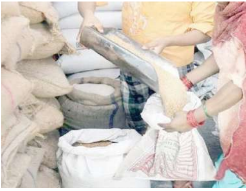
બોરીએ ત્રણથી ચાર કિલો અનાજની ઘટ પડી રહી છે જેના પરિણામે દુકાનદારોને આર્થિક ખોટનો સામનો કરવો પડી રહ્યો છે. દુકાનદારોને કમિશનની આવક થઈ રહી નથી અને પોતાના ખિસ્સામાંથી દુકાનદારોએ રૂપિયા આપવા પડે છે. નિયમિત રીતે અનાજનો જથ્થો

અમદાવાદ, તા.૨ | આજથી રાજ્યમાં સસ્તા અનાજના ૧૭ હજાર દુકાનદારોની હડતાળ પર ઉતર્યા હતા. મળતી જાણકારી અનુસાર, રાજ્યના ગરીબોની દિવાળી બગડી શકે છે. ભૂપેન્દ્ર પટેલ સરકારે વચન ન પાળતા આખરે સસ્તા અનાજના દુકાનદારો હડતાળ પર ઉતર્યા છે. દુકાનદારોની અયોક્કસ મુદતની હડતાળના કારણે દિવાળી સમયે ગરીબ અને મધ્યમવર્ગના લોકોને રાશનથી વંચિત રહેવું પડે તેવી સ્થિતિ સર્જાઈ છે. સસ્તા અનાજના દુકાનદારોનો દાવો છે કે આ પહેલા અસરકારક આંદોલન કરવામાં આવ્યું હતું ત્યારે સરકારે વચન આપ્યું હતું કે ત્રણસોથી ઓછા રાશન કાર્ડ હશે તે દુકાનદારને મહિને વીસ હજાર રૂપિયા આપવામાં આવશે. જો કે હજુ સુધી સરકારે આ વચન પૂર્ણ કર્યું નથી. આ જ પ્રમાણે અનાજની ઘટ સમસ્યા મુદ્દે પણ અનેક વાર રજૂઆત કરવામાં આવી હતી. એક