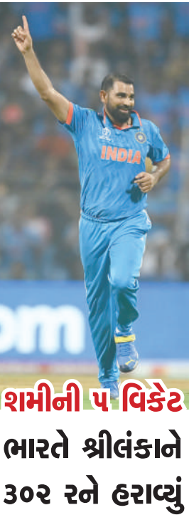
શમીની ૫ વિકેટ

એઆઈને લગતી કાયદાકીય બાબતો તથા બીજા મુદ્દા અંગે પણ સરકારી એજન્સીઓને સલાહ અને માર્ગદર્શન આપવાથી માંડીને ખતરનાક લાગે એવી એઆઈ સિસ્ટમ્સને નાથવા સહિતની તમામ જવાબદારી આ સંસ્થાના માથે રહેશે. યુકે સરકાર દ્વારા નિવેદન જાહેર કરાયું છે, જેમાં બે લેવેલેડ ડિક્લેરેશન શીર્ષકના ઉલ્લેખ સાથે કહેવાયું છે કે, યુરોપીય સંઘ સહિત ૨૮ દેશોના પ્રતિનિધિઓએ હસ્તાક્ષર કર્યા છે. ઉપરાંત એઆઈથી ઉભા થનારા ખતરોનો અંગે પણ ગંભીર ચેતવણી જારી કરી છે.