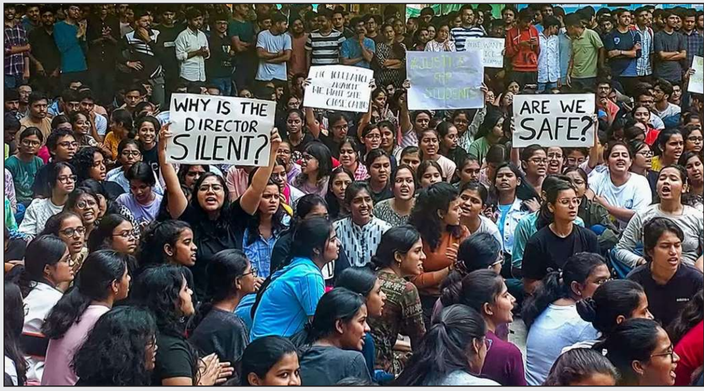
વારાણસીમાં ભુધવારે રાત્રે કેમ્પસમાં એક છોકરીની છેડતી કરવામાં આવી હોવાનો આક્ષેપ કર્યા બાદ વિદ્યાર્થીઓએ ઈન્ડિયન ઈન્સ્ટિટ્યૂટ ઓફ ટેકનોલોજીના ડિરેક્ટરની ઓફિસની બહાર વિરોધ પ્રદર્શન કર્યું.

જેરૂસલેમ, તા.૨ | ઈઝરાયેલી સૈન્યએ ઘાવો કર્યો છે કે તેણે હમાસના પ્રથમ સુરક્ષા ઘેરાને તોડી નાખ્યો છે અને હવે તેના સૈનિકો ગાઝા શહેર તરફ આગળ વધી રહ્યા છે. આટલું જ નહીં ઈઝરાયેલી સૈન્યએ હમાસના વધુ એક કમાન્ડરને ઠાર માર્યાનો પણ ઘાવો કર્યો છે. હમાસ વિરુદ્ધ ગ્રાઉન્ડ ઓપરેશનમાં ઈઝરાયેલના અત્યાર સુધી ૧૬ સૈનિકો મૃત્યુ પામી ગયા છે. ઈઝરાયેલના સુરક્ષા દળોના પ્રવક્તા રિયર એડમિરલ ડેનિયલ હગારીએ કહ્યું કે અમે પ્લાનિંગ, સયોટ ગુપ્ત માહિતી અને સંયુક્ત હુમલા સાથે ગાઝા પટ્ટીની ઉત્તરે હમાસના પ્રથમ સુરક્ષા ઘેરાને નષ્ટ કરી દીધો છે.