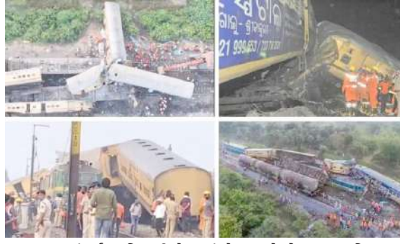
મુખ્ય જનસંપર્ક અધિકારીએ કહ્યું કે જ્યારે ટ્રેન લાલ સિગ્નલ પર રોકવાને બદલે આગળ વધે છે ત્યારે તે થાય છે. અન્ય રેલવે