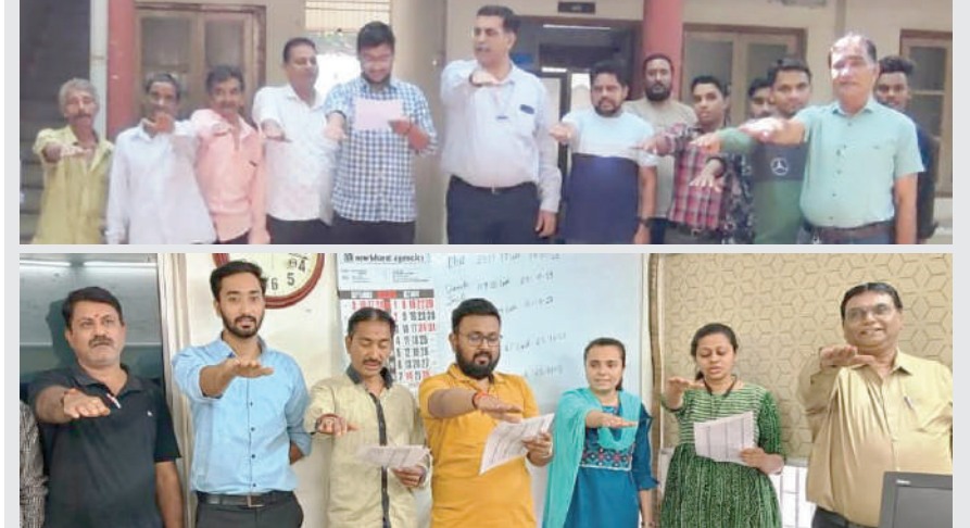
આણંદ, તા.૩૦ |