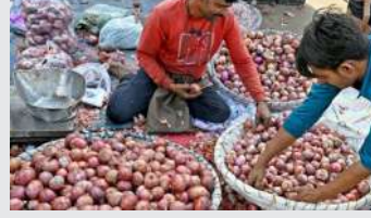
ભાવ ૭૦ રૂપિયા પ્રતિ કિલો હતો, જે એક સપ્તાહ પહેલા ૫૦ રૂપિયા હતો. છૂટક કિંમત ૩૯ રૂપિયાથી વધીને ૮૦ રૂપિયા પ્રતિ કિલો થઈ ગઈ છે. અહેવાલ મુજબ, ડુંગળીના ભાવ હજુ થોડા દિવસો સુધી ઊંચા સ્તરે રહેશે અને તે ૧૦૦ રૂપિયાને પાર કરી શકે છે અને પ્રતિ કિલો ૧૫૦ રૂપિયા સુધી જઈ શકે છે. સ્થાનિક ખેડૂતો તરફથી

કેટલાક મહિનાઓથી ટામેટાના ભાવે સામાન્ય લોકોના બજેટને બગાડ્યું હતું અને હવે ડુંગળીના ભાવ પણ તે જ માર્ગે ચાલી રહ્યા છે. છેલ્લા કેટલાક દિવસોમાં ડુંગળીના ભાવમાં રેકોર્ડ વધારો જોવા મળી રહ્યો છે. દિલ્હી NCRમાં એક સપ્તાહમાં ડુંગળીના ભાવ બમણા થઈ ગયા છે. આ સિવાય બેંગલુરુ, પંજાબ, મુંબઈ અને દેશના અન્ય શહેરોમાં ડુંગળીની કિંમત ૧૦૦ રૂપિયાની નજીક પહોંચી ગઈ છે. રિપોર્ટ્સ અનુસાર, ડુંગળીના ભાવમાં હજુ વધારો થવાની ધારણા છે. રવિવારે બેંગલુરુમાં ડુંગળીનો જથ્થાબંધ