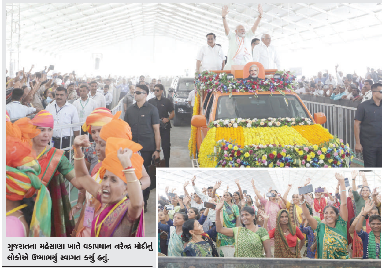
ગુજરાતના મહેસાણા ખાતે વડાપ્રધાન નરેન્દ્ર મોદીનું લોકોએ ઉષ્માભર્યું સ્વાગત કર્યું હતું.

બનાસકાંઠા જિલ્લાના છાપી વિસ્તારમાં કેટલાક શખ્ષોએ ઈઝરાયેલ વિરોધી પોસ્ટર લગાવીને વિસ્તારમાં શાંતિ ડહોળવાનો પ્રયાસ કર્યો હતો. બોયકોટ ઈઝરાયેલ લખેલા પોસ્ટર કેટલાક વિસ્તારમાં ચીપકાવવામાં આવ્યા હોઈ પોલીસે તેને દૂર કરાવ્યા હતા. અજાણ્યા શખ્ષો અંગેની શોધખોળ છાપી પોલીસે કરતા ૬ લોકો ઝડપાયા છે. છાપી પોલીસે તેમની અટકાયત કરીને તપાસ શરૂ કરી છે. પોસ્ટર ચીપકાવવાની યોજના કોણે બતાવી અને ક્યાં છાપવામાં આવ્યા હતા એ દીશામા પણ તપાસ કરવામાં આવી શકે છે. ઈઝરાયેલ અને પેલેસ્ટાઈન વચ્ચે ચાલી રહેલા યુદ્ધ દરમિયાન વિશ્વમાં અનેક જગ્યાઓ વિરોધીઓ પ્રદર્શન કરી રહ્યા છે. આ દરમિયાન બનાસકાંઠા જિલ્લાના વડગામ તાલુકાના છાપી વિસ્તારમાં ઈઝરાયેલ વિરુદ્ધના પોસ્ટર લાગ્યા હતા. પોસ્ટરને પગલે સ્થાનિક પોલીસે તેને લગાવનારા અજાણ્યા લોકોની શોધખોળ શરૂ કરી હતી. જેમાં ૬ લોકોની ઓળખ કરી લઈને પોલીસે તેમની અટકાયત કરી લીધી હતી. છાપી અને આસપાસના વિસ્તારોમાં બોયકોટ ઈઝરાયેલના પોસ્ટર લાગ્યા હતા. આ પોસ્ટરને પગલે સ્થાનિક પોલીસે તેને ચીપકાવનારાઓની શોધખોળ શરૂ કરી હતી. પોલીસે શાંતિ ડહોળવાના પ્રયાસ રૂપ આ હરકતને લઈ કાર્યવાહી હાથ ધરતા પોસ્ટર ચીપકાવનારા છ લોકોની અટકાયત કરી હતી.