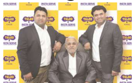
FMCGમાં વધુ શ્રેણી અને પ્રોડક્ટ ના સમવેશની મહત્વાકાંક્ષી યોજનાઓ ધરાવે છે.

અનોખો ઝંઝવાત સર્જીને માર્કેટિંગના માંધાતા પ્રહલાદ કકર ફરી એક વખત તલોદ ની જાહેરાતથી પહેલા ક્યારેય ના જોવા મળ્યો હોય તેવા ધમાકેદાર અંદાજ માં પાછા ફર્યા છે. રેડી ટુ કુક ફલોર મિક્સ ઈન્ડસ્ટ્રી અને રેડી-ટુ-ઈટ વાનગીઓ ના ક્ષેત્રમાં બેજોડ બ્રાન્ડ તલોદ ફૂડ પ્રોડક્ટ્સ પ્રા. લી. એ બ્રાન્ડ એમ્બેસેડર તરીકે પ્રતિભાશાળી અભિનેત્રી શિલ્પા શેટ્ટીની નિમણૂક કરી બજાર માં હલચલ મચાવી દીધી છે. આ જોડાણ તલોદ ફૂડ ના સ્વાદિષ્ટ, નવીનીકરણ અને બેજોડ નિપૂર્ણતા અવિરત સફરમાં ઐતિહાસિક બની રહેશે.