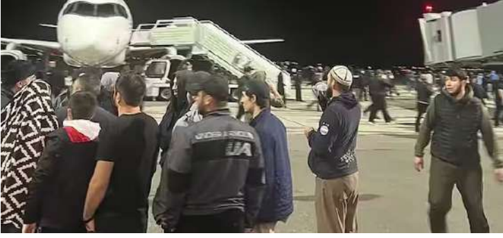
દેખાવકારોનો એક વીડિયો પણ સામે આવ્યો છે, જેમાં પ્રદર્શનકારીઓ એર ટર્મિનલમાં પ્રવેશતા અને પછી અંદરના એરપોર્ટ પર ડાયવર્ટ કરી હતી. સ્થાનિક મીડિયાના અહેવાલો અનુસાર, આ લોકો ગાઝામાં ઈઝરાયલની કાર્યવાહીની નિંદા કરવા માટે એકઠા થયા હતા.

ઈઝરાયલ અને હમાસ વચ્ચે યુદ્ધ ચાલુ છે. ઈઝરાયલ ગાઝામાં સતત સૈન્ય કાર્યવાહી કરી રહ્યું છે. આ બધાની વચ્ચે રવિવારે પેલેસ્ટાઇન સમર્થકો દક્ષિણી રશિયાન વિસ્તાર દાગિસ્તાનના મખાયકાલા શહેરમાં એરપોર્ટના રનવે પર અચાનક પહોંચી ગયા હતા. આ સમય દરમિયાન, વિરોધ કરી રહેલા લોકોએ રનવે બંધ કરી દીધો હતો, ત્યારબાદ રશિયન એવિએશન ઓથોરિટી રોસાવિયાલ્સિયાએ દાગેસ્તાન ક્ષેત્રમાં જતી તમામ ફ્લાઈટ્સ અન્ય એરપોર્ટ પર ડાયવર્ટ કરી હતી. સ્થાનિક મીડિયાના અહેવાલો અનુસાર, આ લોકો ગાઝામાં ઈઝરાયલની કાર્યવાહીની નિંદા કરવા માટે એકઠા થયા હતા.