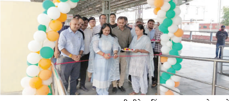
અમદાવાદ, તા.૩૦ |