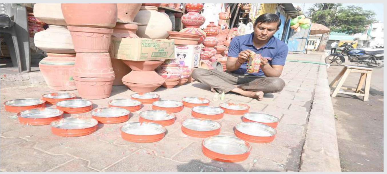
કરવાચોથ માટેની ચારણીને સજીવની સુશોભિત કરી રહેલ કારીગર.