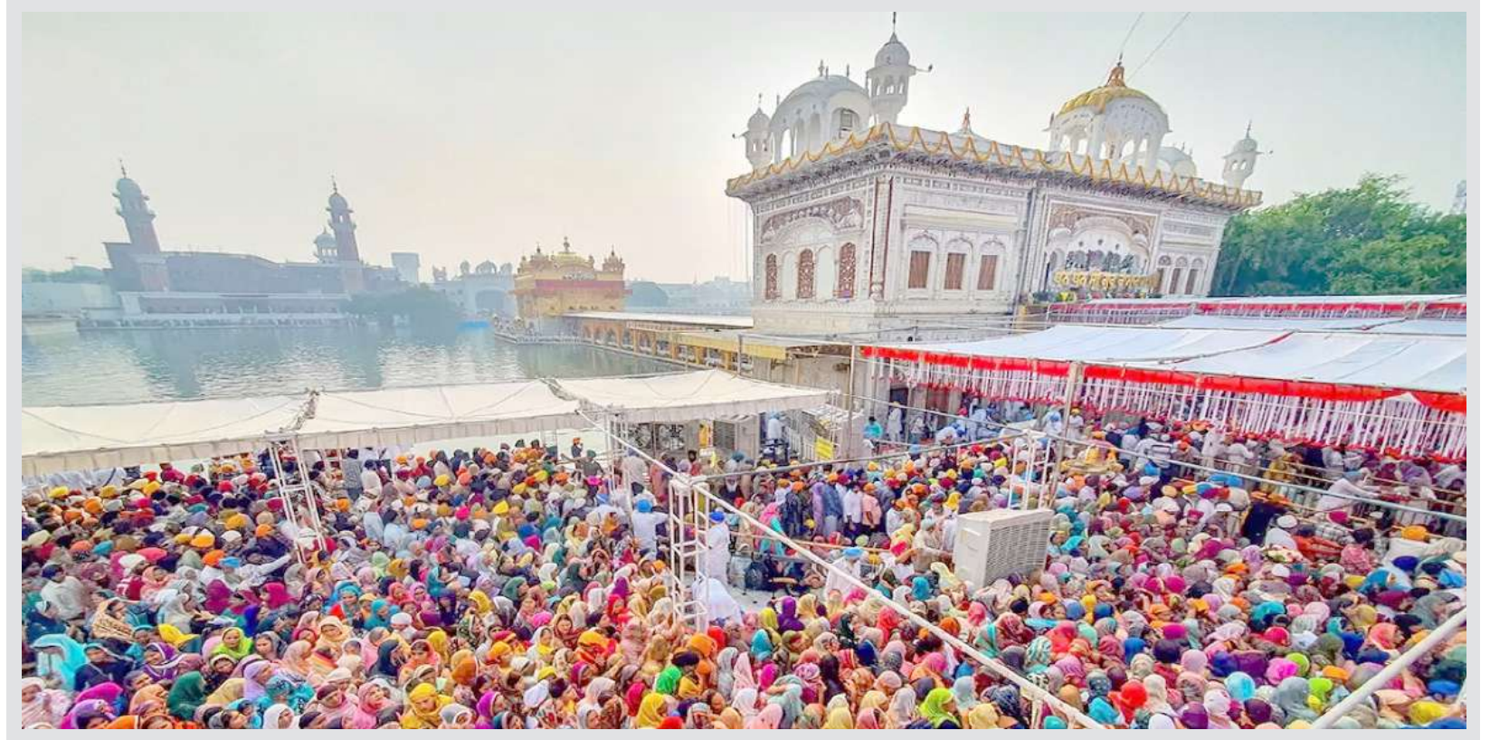
અમૃતસરમાં શીખ ગુરુ રામદાસની જન્મજયંતિ નિમિત્તે સુવર્ણ મંદિરમાં ભક્તોની ભારે સંખ્યામાં ભીડ જોવા મળી હતી.

હતી. તેણે પહેલા સ્ટોકસને અને પછી બેયરસ્ટોને બોલ્ડ કર્યો હતો. શમીએ તેની ૭ ઓવરમાં ૫.૩ ઓવર ડોટ ફેંકી હતી. મોહમ્મદ શમીની આ વન-ડે વર્લ્ડ કપ ૨૦૨૩માં બીજી મેચ હતી. તેણે ૨ મેચમાં કુલ ૯ વિકેટ ઝડપી છે. શમીએ આ ૯ વિકેટ સાથે વન-ડે વર્લ્ડ કપમાં કુલ ૩૯ વિકેટ ઝડપી છે. શમીએ વર્લ્ડ કપમાં અત્યાર સુધી કુલ ૧૩ મેચ રમી છે. આ ૧૩ મેચમાં જ તે વર્લ્ડ કપ ઇતિહાસનો બેસ્ટ બોલર બની ગયો છે. વર્લ્ડ કપ માં ઓછામાં ઓછી ૨૦ વિકેટ લેનાર બોલરોમાં શમીની એવરેજ ૧૪.૦૭ અને સ્ટ્રાઈક રેટ ૧૬.૯૭ની છે. વર્લ્ડ કપ ઇતિહાસમાં આ કોઈપણ બોલરનું સર્વશ્રેષ્ઠ પ્રદર્શન છે.