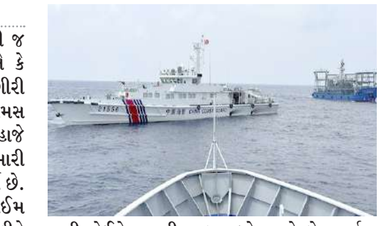
જાણી જોઈને અમારી સપ્લાય બોટ અને કોસ્ટગાર્ડના

૧ મનિલા, તા.૨૪ | ઈઝરાયેલ અને હમાસ વચ્ચે તો યુદ્ધ ચાલી જ રહ્યું છે અને દુનિયાના બીજા હિસ્સામાં એટલે કે સાઉથ ચાઈના સીમાં ચીનની બીજા દેશો પર દાદાગીરી યથાવત છે. સાઉથ ચાઈના સીમાં આવેલા સેકન્ડ થોમસ શોલ નામના ટાપુ પાસે ચીનના કોસ્ટ ગાર્ડના જહાજે ફિલિપાઈન્સની એક સપ્લાય બોટને ટક્કર મારી હોવાનો દાવો ફિલિપાઈન્સના સંરક્ષણ સચિવે કર્યો છે. તેમનું કહેવું હતું કે, ચીનના કોસ્ટ ગાર્ડ તેમજ મેરિટાઈમ મિલિશિયા જહાજે આંતરરાષ્ટ્રીય કાયદાનો ભંગ કરીને