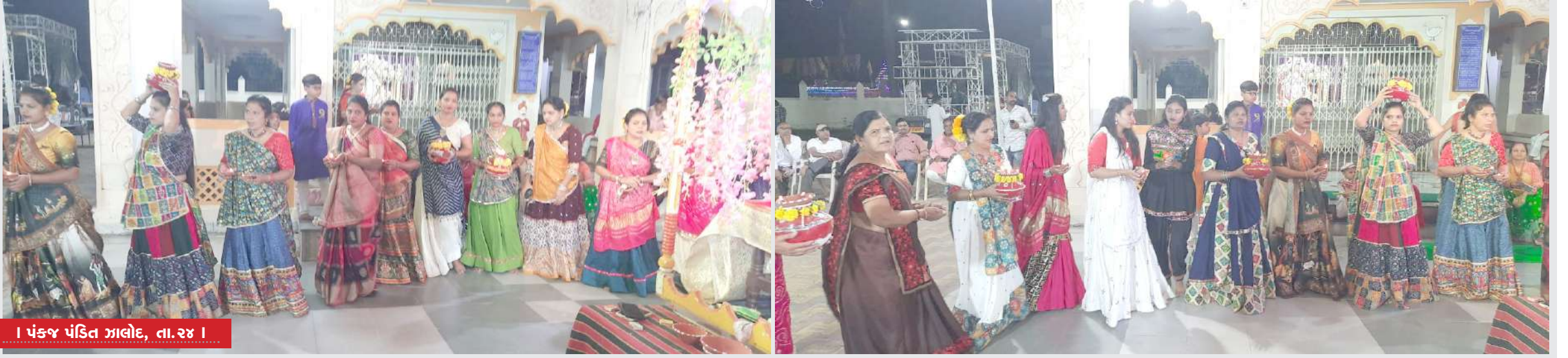
શ્રી વિશ્વકર્મા મંદિર ખાતે દરેક તહેવારો પરંપરાગત રીતે ઉજવાતા હોય છે ચાલુ વર્ષે નવરાત્રીની પણ ખૂબ જ ઉત્સાહ અને ઉમંગની અપાર શ્રદ્ધા સાથે રોજરોજ નિતનવી થીમ પર ગરબા રમતાં ખેલેલા આજરોજ નવમી નવરાત્રીએ આનંદનો ગરબો રમ્યા હતા જેમાં માટીના ગરબાની સાથે જ્યોત લઈને ગરબે ધુમતી મહિલાઓએ ભક્તિમય માહોલ ઉભો કર્યો હતો, જોનારા અને રમનાર સૌ કોઈ આનંદના ગરબામાં લિન થઈ ગયા હતા આધુનિક યુગ માં ટીમલી કે કિલ્મી ગીતો પર રમાતા ગરબા અને પ્રાચીન ગરબા માં માતાજીનો મહિમાં ગાન સાથેના પ્રાચીન ઢબના ગરબાઓએ ચાલુ વર્ષે નગરમાં ઠેર ઠેર યોજાયેલ શેરી ગરબામાં વિશ્વકર્મા મંદિરના ગરબાએ રંગ રાખ્યો હતો.