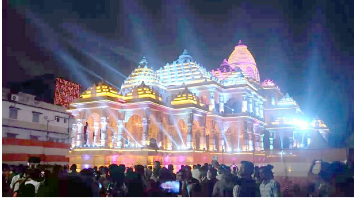
ઉત્તર કોલકાતાના સંતોષ મિત્ર સ્કવેરમાં અયોધ્યાના રામ મંદિરની થીમ પર રચાયેલ દુર્ગા પૂજા પંડાલમાં મોટી સંખ્યામાં ભક્તો દર્શન માટે આવ્યા હતાં.