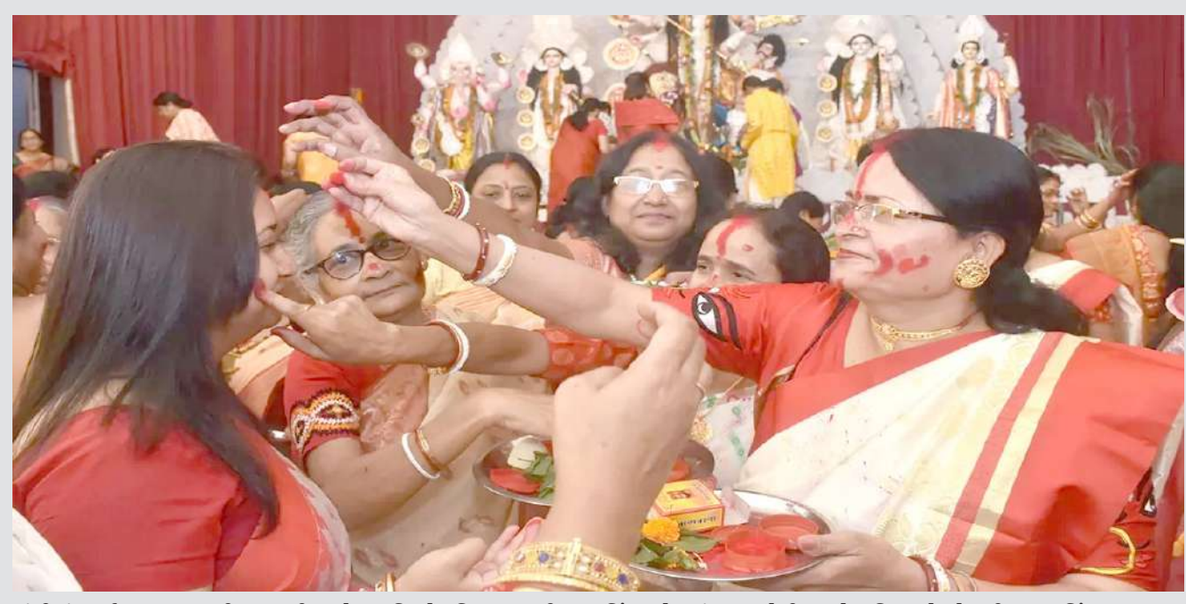
રાંચીમાં દુર્ગા પૂજા ઉત્સવની ઉજવણીના છેલ્લા દિવસે 'વિજયાદશમી' પર સિંદૂર ખેલમાં ભાગ લેતી વખતે મહિલાઓ એકબીજા પર સિંદૂર લગાવવા નજરે પડે છે.

૨૨માંથી ૧૭ રમતોમાં ભાગ લઈ રહ્યા છે. આ વખતે ભારતે રોઈંગ, કેનોઈંગ, લાંન બોલ, તાઈકવાન્ડો અને બ્લાઈન્ડ ફૂટબોલ જેવી ઈવેન્ટ્સમાં પણ પોતાના પેરા એથલેટ્સને મેદાનમાં ઉતાર્યા છે. પેરા એશિયન ગેમ્સ ૨૨ થી ૨૮ ઓક્ટોબર દરમિયાન રમાશે. તમને જણાવી દઈએ કે એશિયન પેરા ગેમ્સની આ ચોથી આવૃત્તિ છે. ૨૦૧૦માં ચીનના ગુઆંગઝૂમાં પ્રથમ વખત આ ગેમ્સનું આયોજન કરવામાં આવ્યું હતું. આ પછી, ૨૦૧૪ માં દક્ષિણ કોરિયાના ઈચોન અને ૨૦૧૮ માં પાલેમ્યાંગ, જકાર્તામાં તેનું આયોજન કરવામાં આવ્યું હતું. ચોથી પેરા એશિયન ગેમ્સ સત્તાવાર રીતે ૯ થી ૧૫ ઓક્ટોબર ૨૦૨૨ દરમિયાન યોજવાની હતી, પરંતુ ગયા વર્ષે ચીનમાં કોવિડ -૧૯ ચેપના ફરીથી ફેલાવાને કારણે તેને મુલતવી રાખવો પડ્યો હતો.