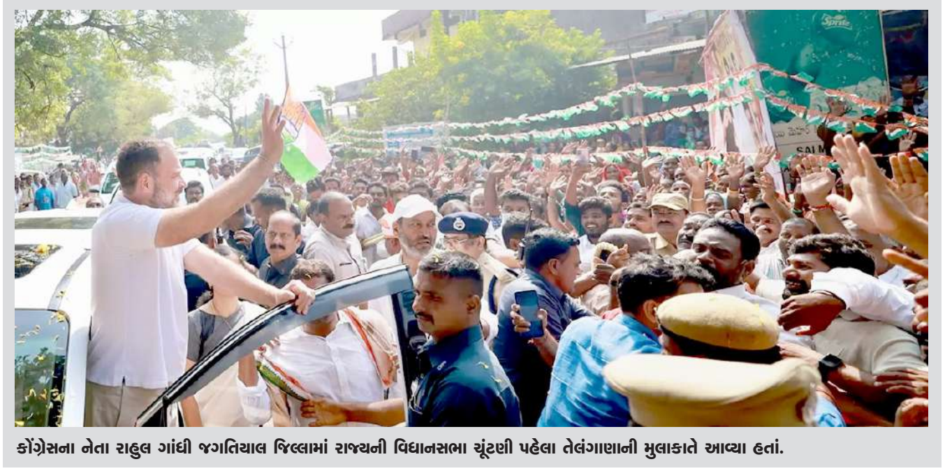
કોંગ્રેસના નેતા રાહુલ ગાંધી જગતિયાલ જિલ્લામાં રાજ્યની વિધાનસભા ચૂંટણી પહેલા તેલંગાણાની મુલાકાતે આવ્યા હતાં.