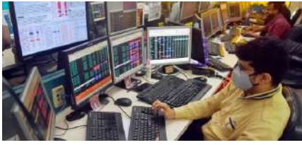
ભારતીય શેરબજારમાં ઘટાડો અટકવાના કોઈ સંકેત દેખાઈ રહ્યા નથી. સપ્તાહના છેલ્લા ટ્રેડિંગ દિવસે, રોકાણકારો દ્વારા વેચવાલી અને પ્રોફિટ બુકિંગના કારણે શેરબજારો ઘટાડા સાથે બંધ થયા હતા. આજના કારોબારમાં તમામ સેક્ટરના શેરમાં ઘટાડો જોવા મળ્યો હતો. આજના કારોબારના અંતે બીએસઈસેન્સેક્સ ૨૩૨ પોઈન્ટના ઘટાડા સાથે ૬૫,૩૯૦ પોઈન્ટ અને નેશનલ સ્ટોક એક્સચેન્જનો નિફ્ટી ૮૨ પોઈન્ટના ઘટાડા સાથે ૧૯,૫૪૨ પોઈન્ટ પર બંધ થયો હતો. આજના કારોબારમાં તમામ સેક્ટરના ઈન્ડેક્સ લાલ નિશાનમાં બંધ થયા છે. એફએમસીજી, મેટલ્સ, એનઈ, કન્ઝ્યુમર ડ્યુરેબલ્સ, હેલ્થકેર,

ઈઝરાયલ હમાસની યુદ્ધની અસર માર્કેટ પર જોવા મળી રહી છે. આજે સતત ત્રીજા દિવસે બજાર લાલ નિશાન સાથે બંધ થયું છે. બજારમાં વેચવાલીનું દબાણ ચાલુ રહ્યું છે. સેન્સેક્સ-નિફ્ટી સતત ત્રીજા દિવસે ઘટીને બંધ થયા છે. આજના કારોબારમાં મિડકેપ અને સ્મોલકેપ શેરોમાં વેચવાલી જોવા મળી હતી. રિયલ્ટી, ઈન્ફા અને ઓટો શેરમાં દબાણ હતું. મેટલ, એફએમસીજી, ફાર્મા શેરોમાં ઘટાડો જોવા મળ્યો. ટીસી, ડેવિસ લેબ્સ, એચયુએલ, બીપીસીએલ અને ટાટ સ્ટીલનિફ્ટીના સૌથી વધુ ઘટાડા વાળા શેર હતા. જ્યારે કોટક મલ્ટિન્ડ્રા બેંક, ઈન્ડસર્સ ઈન્ફા, ટીસીએસ, એસબીઆલાઈફ ઈન્સ્યોરન્સ અને નેસ્લે ઈન્ડિયા નિફ્ટીમાં ટોચ ગેઈનર હતા. કારોબારના અંતે સેન્સેક્સ ૨૩૧.૬૪ પોઈન્ટ અથવા ૦.૩૫ ટકાના ઘટાડા સાથે ૬૫,૩૯૦.૬૨ પર બંધ રહ્યો હતો. જ્યારે નિફ્ટી ૮૨.૦૫ પોઈન્ટ અથવા ૦.૪૨ ટકાના ઘટાડા સાથે ૧૯૫૪૨.૬૫ ના સ્તર પર બંધ થયો હતો.