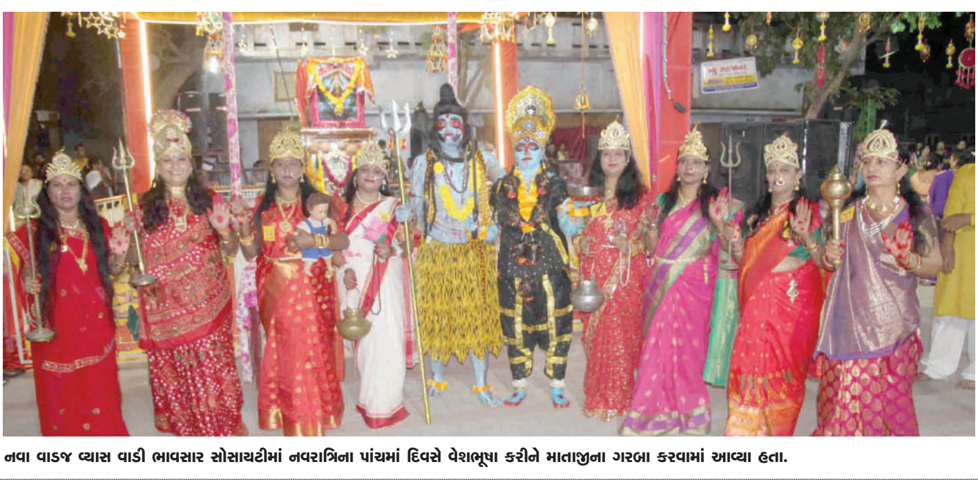
નવા વાડજ વ્યાસ વાડી ભાવસાર સોસાયટીમાં નવરાત્રિના પાંચમાં દિવસે વેશભૂષા કરીને માતાજીના ગરબા કરવામાં આવ્યા હતા.