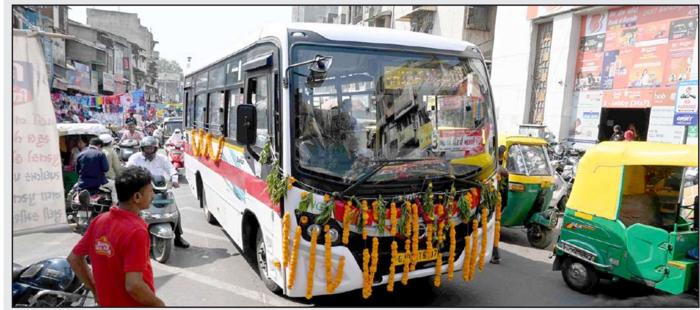
લાલદરવાજા ભદ્ર મંદિરથી કાલુપુર રેલવે સ્ટેશન ગાંધી રોડ માટે એએમટીએસની બસ સેવા શરૂ કરવામાં આવી.

માનવી સુધી યોજનાકીય લાભ પહોંચાડવામાં કર્મચારીઓએ હંમેશા યાચીરૂપ ભૂમિકા ભજવી છે. ત્યારે દિવાળી પૂર્વે લેવામાં આવેલા આ નિર્ણય રાજ્યના પ્રત્યેક ફિક્સ પગારના કર્મચારીઓ તથા તેમના પરિવારજનો માટે ખુશીની હહેર લાવશે તેવો વ્યક્ત કર્યો હતો. આ નિર્ણયથી વર્ગ-૩ના ૪૪૦૦ ગ્રેડ ૫ ધરાવતા કર્મચારીઓનો પ્રવર્તમાન માસિક ફિક્સ પગાર રૂ. ૩૮,૦૮૦ થી વધીને રૂ. ૪૯,૬૦૦ થશે. ઉપરાંત વર્ગ-૩ ના ૪૨૦૦ અને ૨૮૦૦ ગ્રેડ ૫ ધરાવતા કર્મચારીઓનો પ્રવર્તમાન માસિક ફિક્સ પગાર રૂ. ૩૧,૩૪૦ થી વધીને રૂ. ૪૦,૮૦૦ થશે. વર્ગ-૩ ના ૨૪૦૦, ૨૦૦૦, ૧૮૦૦ અને ૧૮૦૦ ગ્રેડ ૫ ધરાવતા કર્મચારીઓનો પ્રવર્તમાન માસિક ફિક્સ પગાર રૂ. ૧૯,૮૫૦ થી વધીને રૂ. ૨૬,૦૦૦ થશે. જ્યારે વર્ગ-૪ ના ૧૬૫૦, ૧૪૦૦ અને ૧૩૦૦ ગ્રેડ ૫ ધરાવતા કર્મચારીઓનો પ્રવર્તમાન માસિક ફિક્સ પગાર રૂ. ૧૬,૨૨૪ થી વધીને રૂ. ૨૧,૧૦૦ થશે. આ નિર્ણયથી રાજ્ય સરકારની તિજોરી પર વાર્ષિક રૂ. ૩૪૮.૬૪ કરોડ રૂપિયાનું ભારણ વધશે.