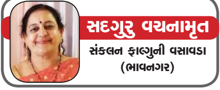
સદગુરુ પર્યામૃત સંકલન ફાલ્ગુની વસાવડા (ભાવનગર)