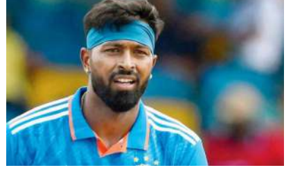
1 નવી દિલ્હી, તા.૨૦ | વર્લ્ડ કપ ૨૦૨૩માં ભારતનું અત્યાર સુધીમાં શાનદાર પ્રદર્શન રહ્યું છે. ભારત અત્યાર સુધીમાં ચાર મેચ રમી છે અને તે બધી જીત્યું છે એવા હાલ ભારતીય ક્રિકેટ ટીમ માટે એક માહા સમાચાર સામે આવી રહ્યા છે. ગઈકાલે ભારત અને બાંગ્લાદેશ વચ્ચેની મેચ દરમિયાન સ્ટાર બોલરોઈન્ડર હાર્દિક પંડ્યા ઈજાગ્રસ્ત થયો હતો. ત્યારબાદ ગઈકાલે તેની મેચમાં વાપસી જોવા મળી ન હતી એવા આજે અપડેટ આવી રહ્યું છે કે, ભારતની આવતી મેચ જે ન્યૂઝીલેન્ડ સામે રમાયેલી છે તેમાં પણ હાર્દિક પંડ્યા રમી શકશે નહીં કારણ કે હાલ બેંગલુરુ સ્થિત હોસ્પિટલમાં તેની ઈન્જરી માટે સારવાર ચાલી રહી છે.