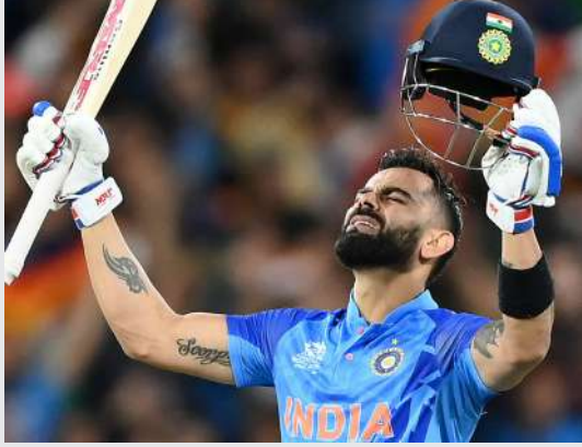
વિરાટ કોહલીએ વર્લ્ડ કપમાં આઠ વર્ષ બાદ ટૂનામેન્ટમાં સદી ફટકારી હતી. વિરાટે છેલ્લે ૨૦૧૫માં પાકિસ્તાન સામે સદી ફટકારી હતી. આ ઉપરાંત કોહલીએ વનડે વર્લ્ડ કપના ૩૬ મેચમાં જ સદી ફટકારી હતી.

ગઈકાલે પૂણેમાં ભારતે બાંગ્લાદેશને ૭ વિકેટે પરાજય આપીને વર્લ્ડ કપ ૨૦૨૩માં સતત ચોથી જીત મેળવી હતી. આ મેચમાં વિરાટ કોહલીએ શાનદાર સદી ફટકારી હતી અને અનેક રેકોર્ડ સર્જ્યા હતા. બાંગ્લાદેશની ટીમે ટોસ જીતીને બેટિંગ પસંદ કરી હતી. પ્રથમ બેટિંગ કરતા બાંગ્લાદેશ ૫૦ ઓવરમાં ૮ વિકેટે ૨૫૬ રન બનાવ્યા હતા, જેના જવાબમાં ભારતે ૪૧.૩ ઓવરમાં જ ૩ વિકેટે ૨૬૧ રન બનાવીને વિજય મેળવ્યો હતો. ગઈકાલે પૂણેના એમસીએસ્ટેડિયમમાં રમાયેલી મેચમાં વિરાટ કોહલીએ શાનદાર ઈનિંગ રમતા અણનમ ૯૭ બોલમાં ૧૦૩ રન બનાવ્યા હતા. તેણે પોતાની ઈનિંગ દરમિયાન છ ચોગ્ગા અને ચાર છગ્ગા ફટકાર્યા હતા. આ દરમિયાન કોહલીની સ્ટ્રાઈક રેટ ૧૦૬.૧૯નો હતો. વિરાટે ટાર્ગેટનો ચેજ કરતા વર્લ્ડ કપમાં પ્રથમ વખત સદી ફટકારી છે.