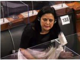
મહુઆ મોઈત્રાએ કહ્યું કે એવા સફળ ધનિક બિઝનેસમેન હીરાનંદાણી કે જેમની દરેક મંત્રી અને પીએમઓ સુધી પહોંચી છે તેમને પહેલીવાર સાંસદ દ્વારા ભેટ આપવા અને તેમની માગને પૂરી કરવા માટે કેમ મજબૂર કરાશે? આ સંપૂર્ણપણે તર્કહીન ઊઠાવ્યો છે. તેમણે કહ્યું કે આ સોગંદનામાનું કાગળ એક સફેદ ટુકડો જ છે. તેમાં કોઈ લેટરહેડ નથી. બે પાનાની પ્રેસ નોટમાં

તુણમૂલ કોંગ્રેસ (ટીએમસી) સાંસદ મહુઆ મોઈત્રા પર બિઝનેસમેન દર્શન હીરાનંદાણીએ ગંભીર આરોપો મૂકી બળભાગ ધમકાવી દીધો છે. જોકે તુણમૂલ સાંસદે સામે વળતા પ્રહાર કર્યા હતા. તેમણે વડાપ્રધાનના કાર્યાલય (પીએમઓ) પર આરોપ લગાવ્યો છે કે તેના દ્વારા બિઝનેસમેન પર દબાણ બનાવાયું છે. મહુઆએ હીરાનંદાણીના સામે ગંદનામાની વિશ્વસનીયતા સામે પણ સવાલ ઊઠાવ્યો છે. તેમણે કહ્યું કે આ સોગંદનામાનું કાગળ એક સફેદ ટુકડો જ છે. તેમાં કોઈ લેટરહેડ નથી. બે પાનાની પ્રેસ નોટમાં