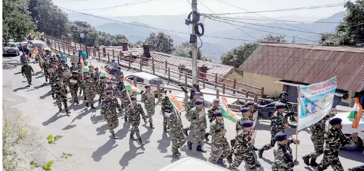
એસએસબી જવાન અને વિદ્યાર્થીઓ દ્વારા સિમલામાં 'મેરી માટી મેરા દેશ' અભિયાનના ભાગરૂપે અમૃત કલશ યાત્રામાં ભાગ લીધો હતો.

દેખાતી પણ નથી તેથી ઘઉંના ભાવ ઊંચા જવાના જ છે તેની પાછળ ચોખા સહિત અન્ય ખાદ્યાન્નના ભાવ પણ વધતા સંભવ છે. તેની આડઅસર શાકભાજી ઉપર પણ પડતા જનસામાન્યની યાળી મોઢી થઈ જશે તેવું પણ નિરીક્ષકો અનુમાન બાંધે છે. અમેરિકાના ક્વાઈમેટ પ્રીડિક્શન સેન્ટર (સીસીસી)એ જણાવ્યું છે કે અલ-નીનોની અસર તો વિશ્વભરમાં મે મહિના સુધી રહેવાની છે. (અલ- નિનો મધ્ય દક્ષિણ પેસિફિકમાંથી ઉદ્ભવતો ગરમ પ્રવાહ છે) તેમાંએ તે જો પ્રબળ બની મે (૨૪) સુધી ચાલુ રહે તો ૮૫% શક્યતા છે કે, '૨૩-'૨૪ દરમિયાન શિયાળા 'ગરમ' રહેશે.