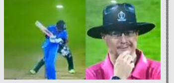
અણનમ સદી ફટકારીને ટીમને વિજય અપાવ્યો હતો. જો કે કોહલીની આ સદી દરમિયાન અમ્પાયર રિચાર્ડ કેટલબરોના એક નિર્ણયની ક્રિકેટ ચાહકો તેમજ વિવેચકોમાં હાલ ચર્ચા થઈ રહી છે અને સોશયલ મીડિયા પર આ ટોપિક ખુબ જ ચર્ચાઈ રહ્યો છે. આ નિર્ણય અંગે બે મત સામે આવી રહ્યા છે જેમાં કેટલાક લોકો અમ્પાયરની ટીકા કરી રહ્યા છે જ્યારે કેટલાક લોકો અમ્પાયરને સાચા કહી રહ્યા છે.

ભારતે ગઈકાલે બાંગ્લાદેશ ૭ વિકેટ જીત મેળવી હતી. આ મેચમાં કોહલીએ સદી ફટકારી હતી. જો કે મેચ દરમિયાન અમ્પાયરના એક નિર્ણયને લઈને ભારે ચર્ચા થઈ રહી છે. કેટલાક ક્રિકેટલખનારોના એક નિર્ણયની ક્રિકેટ જ્યારે કેટલાક લોકો આ નિર્ણયને યોગ્ય ઠેરવી રહ્યા છે. જાણો શું છે સમગ્ર મામલો અને આઈસીસીનો વાઈડ બોલનો નવો નિયમ શું છે. ભારત અને બાંગ્લાદેશ વચ્ચે રમાયેલી વર્લ્ડ કપ ૨૦૨૩ની ૧૭મી મેચમાં વિરાટ કોહલીએ ૯૭ બોલમાં ૬ ચોગ્ગા અને ચાર છગ્ગાની મદદથી