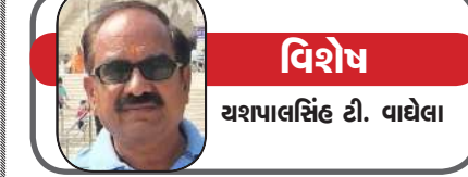
વિશેષ યશપાલસિંહ ડી. વાઘેલા

આજે નવરાત્રિના સાતમા નોરતે નવદુર્ગાના કાલરાત્રિ સ્વરૂપનું પૂજન-અર્ચન થાય છે. મા કાલ રાત્રિ દુષ્ટોનો નાશ કરનાર છે. એવું માનવામાં આવે છે કે માતા કાલ રાત્રિની પૂજા કરનાર ભક્તો પર માતા રાણીની વિશેષ કૃપા રહે છે. આ દિવસે સાધકનું મન 'સહ સાર ચક્ર'માં સ્થિત હોય છે. એટલે બ્રહ્માંડની સમસ્ત સિદ્ધિઓના દ્વાર ખુલવા માંડે છે. દેવીના આ રૂપના આગમન માત્રથી તમામ રાક્ષસો, ભૂત-પ્રેત-પિશાચ અને નકારાત્મક ઊર્જાઓ પલાયન કરી જાય છે. કાલરાત્રિ માતાના શરીરનો રંગ ગાઢ અંધકાર સરીખો કાળો છે. માથાના વાળ ખુલ્લાં હોય છે. ગળામાં વીજળી ની જેમ ચમકતી માળા હોય છે. માતાને ત્રણ નેત્રો હોય છે. જેમાંથી વીજળી જેવી ચમકદાર કિરણો નીકળતી રહે છે. માતા નાક વાટે શ્વાસોચ્છવાસ લે ત્યારે પણ અંધનની ભયંકર જવાળાઓ નીકળે છે. મા કાલ રાત્રિનું વાહન ગદર્ભ છે. મા કાલરાત્રિના સ્વરૂપની વાત કરીએ તો માતા રાણીને ચાર હાથ છે. કાલરાત્રિ માતા ચાર ભુજાધારી છે. જમણી બાજુની બે ભુજાઓ પૈકીની ઉપર ઉઠેલી ભુજા વડે માતા વરદાન પ્રદાન કરે છે. જ્યારે નીચે રાખેલો હાથ અભય મુદ્રા દર્શાવે છે. તે એક હાથમાં ખડ (તલવાર), બીજા હાથમાં લોખંડનું હથિયાર, ત્રીજા હાથમાં વરમુદ્રા અને ચોથા હાથમાં અભય મુદ્રા ધરાવે છે. નવરાત્રિના સાતમા દિવસે મા કાલરાત્રિની પૂજા કરવામાં આવે છે. સ્નાનાદિ કર્મ પતાવીને સ્વચ્છ વસ્ત્રો ધારણ કરવા. માતા રાણીને અક્ષત, ફૂલ, ધૂપ, ગંધક, ગોળ અને નેવેદ્ય વગેરે વિધિ પૂર્વક અર્પણ કરવું. મા કાલ રાત્રિને રાતરાણીના ફૂલો અર્પણ કરવા શુભ માનવામાં આવે છે. માતાને લાલ રંગ પસંદ છે. પૂજા બાદ મા