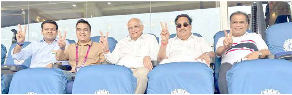
અમદાવાદના નરેન્દ્ર મોદી સ્ટેડિયમ ખાતે વર્લ્ડ કપ ભારત પાકિસ્તાનની મેચ જોવા માટે મુખ્યમંત્રી ભુપેન્દ્ર પટેલ, હર્ષ સંઘવી તેમજ સી.આર. પાટીલ ઉપસ્થિત રહ્યા હતાં.

બૂક કરવામાં આવ્યા છે. કેટલાક સિંગલ રૂમ પણ પાંચ લોકો દ્વારા બૂક કરવામાં આવ્યા છે. તેમણે ઉમેર્યું હતું કે, એનઆરઆઈ અને વિદેશના નાગરિકો નવરાત્રીનો આનંદ માણવા માટે પણ ગુજરાત આવ્યા છે. જેમાંથી અમેરિકા, યુકે અને ઓસ્ટ્રેલિયાથી સૌથી વધારે લોકો આવ્યા છે. આ વખતે અલબાનિયા, ઉઝબેકિસ્તાન, અમેરિકન સામોઆ, એરિટ્રેઆ, હોંગકોંગ, કોરીયા અને પાપુઆ ન્યૂ ગિની જેવા દેશોમાંથી પણ કેટલાક લોકોએ શહેરમાં રૂમ બૂક કરાવ્યા છે. અમારું માનવું છે કે તેઓ વર્લ્ડ કપની મેચ જોવા માટે આવ્યા છે.