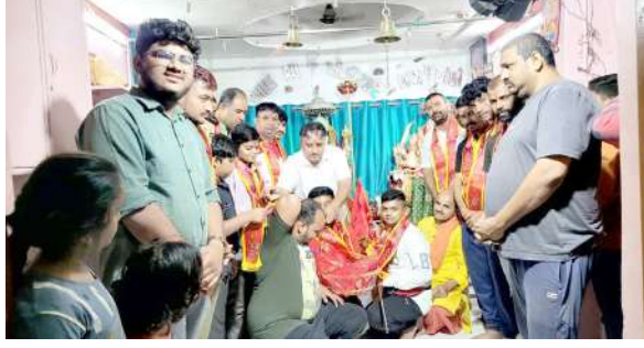
૧ ઝાલોદ, તા.૧૨ |

ઝાલોદ જય માતાજી પગ પાળા સંઘના માઈભક્તોનું સંઘ ૧૧-૧૦-૨૦૨૩ ના બુધવારના દિવસે રાત્રીના ૮ વાગે પાવાગઢ પગપાળા જવા માટે નીકળ્યા હતા. માઈભક્તો દ્વારા સહુ પ્રથમ ખોડિયાર માતાના મંદિરે આરતી કરી પ્રસાદ લઈ મંદિરના પ્રાંગણમાં ઢોલ નગારા સાથે ગરબાની રમઝટ જમાવી બોલ માડી અંબે જય જય અંબેના