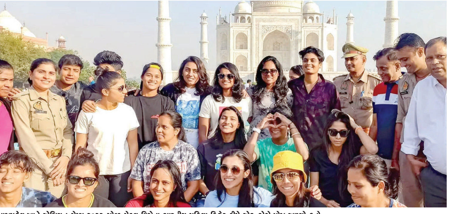
તાજમહેલ ખાતે ઓશિયન ગેમ્સ ૨૦૨૨ ગોલ્ડ મેડલ વિજેતા ભારતીય મહિલા ક્રિકેટ ટીમે એક ફોટો પોઝ આપ્યો હતો.

ODI વર્લ્ડ કપ ૨૦૨૩ ની ૯મી મેચ દિલ્હીના અરુણ જેટલી સ્ટેડિયમમાં ભારત અને અફઘાનિસ્તાન વચ્ચે રમાઈ હતી. ભારતીય ટીમે આ મેચ ૮ વિકેટ જીતી લીધી હતી. આ દરમિયાન અરુણ જેટલી સ્ટેડિયમનો એક વીડિયો સોશિયલ મીડિયા પર વાયરલ થઈ રહ્યો છે, જેમાં સ્ટેન્ડ પર બેઠેલા પ્રશંસકો વચ્ચે જોરદાર અથડામણ જોવા મળી રહી છે. વીડિયોમાં જોઈ શકાય છે કે મામલો માત્ર અથડામણ સુધી સીમિત નથી પરંતુ કેટલાક લોકો એકબીજાને મારવા લાગે છે. વાયરલ વીડિયોની વાત કરીએ તો એ જાણી શકાયું નથી કે ચાહકો વચ્ચે આ લડાઈ શા માટે થઈ. પરંતુ જો વીડિયોની વાત કરીએ તો સ્ટેન્ડ પર બેઠેલા ચાહકો અચાનક એકબીજાને મારતા જોવા મળે છે.