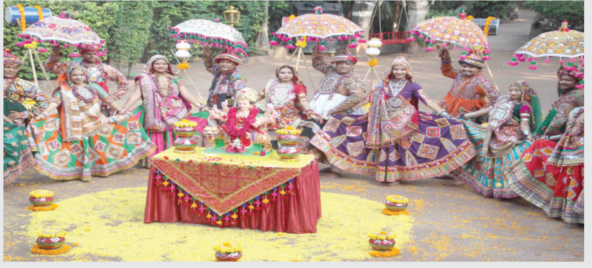
વેળપુર રથવાડુમાં પનગટ ગરબા સંસ્થા દ્વારા ગરબાની પ્રેક્ટીસ કરી અને વિવિધ પદ્ધતિ પ્રમાણે ગરબા રમ્યા હતા.