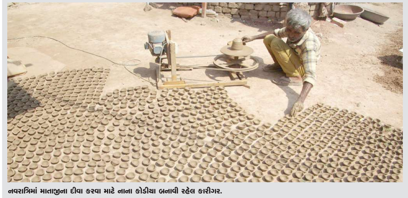
નવરાત્રિમાં માતાજીના દીવા કરવા માટે નાના કોડીયા બનાવી રહેલ કારીગર.