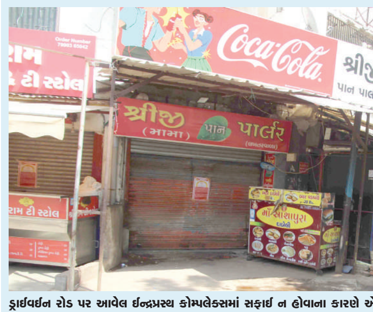
ફાઈવર્થન રોડ પર આવેલ ઈન્ડ્રપ્રસ્થ કોમ્પલેક્સમાં સફાઈ ન હોવાના કારણે એએમસી દ્વારા સીલ કરવામાં આવ્યું હતું.