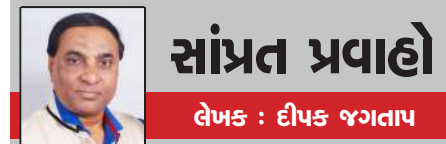
સાંપ્રત પ્રવાહો લેખક : દીપક જગતાપ

છેલ્લાં કેટલાંક સમયથી ગરબામાં હાર્ટ એટેકના કિસ્સાઓમાં વધારો થઈ રહ્યો છે. આવી જ એક કિસ્સો હાલ સુરતથી સામે આવ્યો છે. સુરતમાં ગરબાની પ્રેક્ટિસ કરતા ૨૮ વર્ષના યુવાનને હાર્ટ એટેક આવવાની ઘટના બની છે...ગરબાની પ્રેક્ટિસ કરતા કરતા અચાનક આ યુવાન ઢળી પડ્યો હતો અને બેભાન થઈ ચુક્યો હતો. સારવાર અર્થે તાત્કાલિક હોસ્પિટલમાં લઈ જવાતા ત્યાં તબીબે તેને મુત જાહેર કર્યો હતો. હાલ મોતનું પ્રાથમિક કારણ હાર્ટ એટેક માનવામાં આવી રહ્યું છે. જુવાનજોષ દીકરાના મોતથી પરિવારમાં શોકની લાગણી ફેલાઈ ગઈ છે. ઉલ્લેખનીય છે કે નવરાત્રિ બાદ આ યુવક યુ.કે. ભણવા માટે જવાનો હતો. તેની સંપૂર્ણ તૈયારીઓ પણ કરી લેવામાં આવી હતી. થોડા દિવસો પહેલા જ રાજકોટમાં હાર્ટ એટેકના કારણે એક દિવસમાં ૩ વ્યક્તિના મોત થયા હતા. જેમાંથી એકનું તો ગરબાની પ્રેક્ટિસ કરતા સમયે મોત નીપજ્યું હતું. બહારથી એકદમ સ્વસ્થ દેખાતો વ્યક્તિ છે જેને અચાનક જ ચક્કર આવે છે અથવા ગભરામણ થાય છે અને જોતજોતમાં તે ઢળી પડે છે અને હંમેશ માટે મૃત્યુ શૈયામાં પોઠી જાય છે. ગુજરાતમાં નાની ઉંમરે હૃદયરોગના હુમલાથી મૃત્યુના કિસ્સા વધતા જાય છે. લગ્નમાં નાચતી વખતે, ક્રિકેટ રમતી વખતે, ગરબા રમતી વખતે, વાહન ચલાવતી વખતે કે પછી જીમમાં કસરત કરતી વખતે હાર્ટ એટેક આવવાની સાથે જ સ્વખ પર જ મૃત્યુના કિસ્સાઓ દિવસેને દિવસે