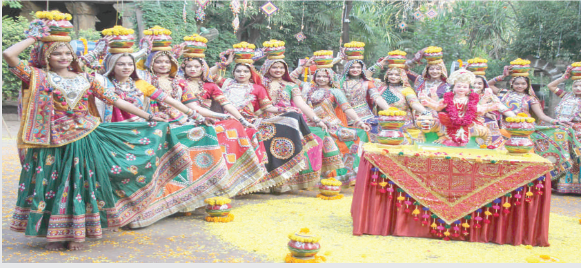
વેળપુર રથવાડુમાં પનગટ ગરબા સંસ્થા દ્વારા ગરબાની પ્રેક્ટીસ કરી અને વિવિધ પદ્ધતિ પ્રમાણે ગરબા રમ્યા હતા.