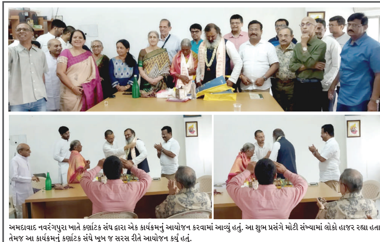
અમદાવાદ નવરંગપુરા ખાતે ક્ષણિક સંઘ દ્વારા એક કાર્યક્રમનું આયોજન કરવામાં આવ્યું હતું. આ શુભ પ્રસંગે મોટી સંખ્યામાં લોકો હાજર રહ્યા હતા તેમજ આ કાર્યક્રમનું ક્ષણિક સંઘે ખૂબ જ સરસ રીતે આયોજન કર્યું હતું.