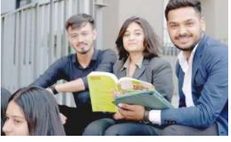
વિકાસને અપનાવતા પારુલ યુનિવર્સિટીએ બે વર્ષનો ઓનલાઈન એમબીએ પ્રોગ્રામ રજૂ કર્યો છે, જેને વર્ચ્યુઅલ પ્લેટફોર્મના માધ્યમથી

યુજીસીની મંજૂરી સાથે ભારતમાં એક પ્રતિષ્ઠિત ખાનગી યુનિવર્સિટી પારુલ યુનિવર્સિટીએ જાહેરાત કરી છે કે, તેઓના ઓનલાઈન એમબીએ પ્રોગ્રામમાં પ્રવેશ માટેની અંતિમ તારીખ ૩૧ ઓગસ્ટ, ૨૦૨૩ છે. રસ ધરાવતા ઉમેદવારો યુનિવર્સિટીની ઓફિશિયલ વેબસાઈટના માધ્યમથી પોતાની અરજી સબમિટ કરી શકશે. registration link. ડિજિટલ શિક્ષણની દિશામાં વિકાસને અપનાવતા પારુલ યુનિવર્સિટીએ બે વર્ષનો ઓનલાઈન એમબીએ પ્રોગ્રામ રજૂ કર્યો છે, જેને વર્ચ્યુઅલ પ્લેટફોર્મના માધ્યમથી એકીકૃત રીતે આગળ વધારી શકાશે. આ પ્રોગ્રામ વિદ્યાર્થીઓને બિઝનેસ એજ્યુકેશન અને મેનેજમેન્ટની વ્યાપક સમજની સાથે તેઓ સફળ બને એ રીતે સાવધાનીપૂર્વક ડિઝાઈન કરવામાં આવ્યો છે. આ સાથો-સાથ નેટવર્કિંગના મહત્વના પાસાને ધ્યાનમાં રાખીને ડિઝાઈન કરતી વખતે સુગમતા અને સગવડ બંને પ્રદાન કરવા માટે અભ્યાસક્રમ સમજ-વિચારીને તૈયાર કરવામાં આવ્યો છે. બે વર્ષના સમય ગાળામાં ચાર સેમેસ્ટરનો ઓનલાઈન એમબીએ પ્રોગ્રામ વિદ્યાર્થીઓને બીજા વર્ષ દરમિયાન વિશેષતા પસંદ કરવા સક્ષમ બનાવશે. પારુલ યુનિવર્સિટીમાં ૨૦ સ્પેશિયલાઈઝેશનની એક વિશાળ રેન્જ ઉપલબ્ધ છે, જે વિદ્યાર્થીઓને તેમના પ્રોગ્રામને તેમની યૂનિક રુચિઓ અને ઉદ્યોગની જરૂરિયાતોને અનુરૂપ બનાવવા સક્ષમ બનાવે છે.