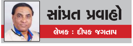
સાંપ્રત પ્રવાહો લેખક : દીપક જગતાપ

રોવરમાં સોલર પેનલ દ્વારા ૭૩૮ વોટ વીજળી ઉત્પન્ન થઈ રહી છે । જ્યારે રોવરમાંથી ૫૦ વોટ જેટલી વીજળી તૈયાર થાય છે