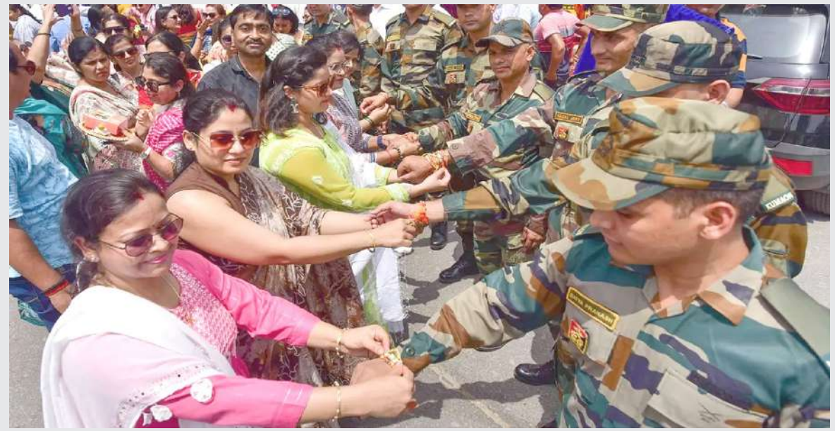
રક્ષાબંધન તહેવાર પહેલા પ્રયાગરાજ ખાતે મહિલાઓ દ્વારા આર્મીના જવાનોને હાથ પર રાખી બાંધી રક્ષાબંધનની ઉજવણી કરવામાં આવી હતી.