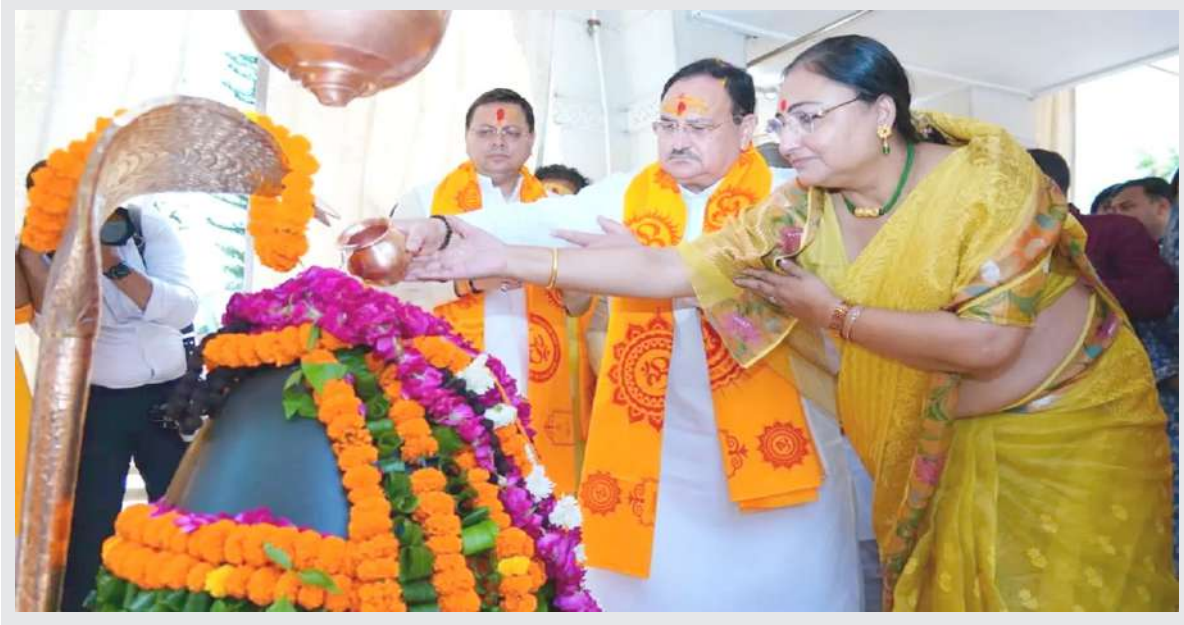
ભાજપના રાષ્ટ્રીય અધ્યક્ષ જે પી નંદા અને તેમની પત્ની મલ્લિકા નંદા સાથે હરિદ્વારમાં મહાકાલ મંદિરમાં પૂજા-પ્રાર્થના કરી હતી. આ પ્રસંગે ઉત્તરાખંડના મુખ્યમંત્રી પુષ્કર સિંહ ધામી પણ ઉપસ્થિત રહ્યા હતાં.

ત્યાર પછી મહિલાએ બેંકના મોબાઈલ એપ પર વિગતો ચેક કરી તો જોવા મળ્યું કે તેના ઈમેઈલ એડ્રેસમાં ફેરફાર છે. તેણે આ વિશે સક્સેનાને ફોન કર્યો તો તેણે કહ્યું કે એન્ટ્રી કરવામાં કદાચ ભૂલ થઈ ગઈ હશે. ૧૦ એપ્રિલે ફરી સક્સેનાનો ફોન આવ્યો જેમાં તેણે કહ્યું કે તમારી ક્રેડિટ લિમિટ વધારી આપવામાં આવશે જેમાં તમારે એક OTP આપવાનો રહેશે. તેમણે આ OTP આપતા જ મહિલાના ખાતામાં ૭.૧૦ લાખ રૂપિયા જમા થયા અને તરત તેમાંથી ૬.૯૭ લાખ રૂપિયા બીજા કોઈ વ્યક્તિના બેંક એકાઉન્ટમાં ટ્રાન્સફર થઈ ગયા. તેમના ખાતામાં જે ૭.૧૦ લાખ જમા થયા હતા તે કોઈ પર્સનલ લોન માટે હતા. થોડી વારમાં બેંકનો ફોન આવ્યો અને વેરિફિકેશનની માગણી કરી ત્યારે મહિલાએ કહ્યું કે તેણે કોઈ પર્સનલ લોનની અરજી કરી ન હતી. તેણે પોતાનું એકાઉન્ટ બ્લોક કરી દેવા માટે પણ જણાવ્યું. મહિલા બેંક પર ગઈ અને તેને જણાવ્યું કે તેની સાથે છેતર પિંડી થઈ છે. બેંકે તેને ક્રેડિટ કાર્ડ ડિપાર્ટમેન્ટ પાસે જવા કહ્યું જ્યારે ક્રેડિટ કાર્ડ વિભાગે તેમને લોન ડિપાર્ટમેન્ટમાં ફરિયાદ કરવા કહ્યું. આ રીતે ઘડકા ખાઈને થાકી ગયેલી મહિલાએ અંતે સાઈબર કાર્ટમમાં ફરિયાદ કરી છે.