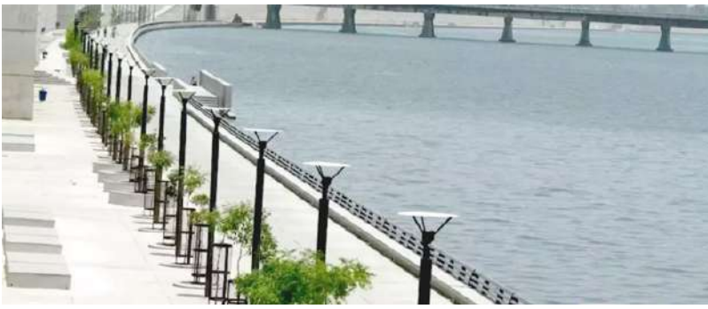
કરવામાં આવશે. ત્યારે હેરિટેજ દિવાલ હશે. અમદાવાદને હેરિટેજને દરજ્જો સાથે બનનાર આ શહેરનો પ્રથમ ગાર્ડન તો મળ્યો પણ સ્થાપત્યોની જાળવણીમાં

અમદાવાદ, તા. ૨૭ | અમદાવાદમાં રિવરફ્રન્ટ પૂર્વ તરફની કોટ વિસ્તારની હેરિટેજ દિવાલને અડીને ૧૮ હજાર સ્કવેર મીટર જગ્યામાં હેરિટેજ ગાર્ડન બનાવાશે. સાબરમતી રિવરફ્રન્ટ ડેવલપમેન્ટ કંપની દ્વારા એક સંસ્થાની મદદથી ખાનપુર રિવરફ્રન્ટ ડેવલપમેન્ટ કંપની દ્વારા હેરિટેજ ગાર્ડન બનાવવાનું આયોજન કરવામાં આવ્યું છે. ત્યારે તેની તમામ તૈયારીઓને આખરી ઓપ આપી દેવામાં આવ્યો છે. તેમજ આગામી મહિનાથા આ ગાર્ડનની કામગીરી પણ શરૂ