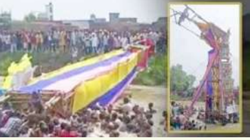
મુરાદાબાદ, તા.૩૦ |

૪૦ ફૂટ ઈંચ તાજિયા નદીમાં પલટતા ઘણા લોકો ઈજાગ્રસ્ત