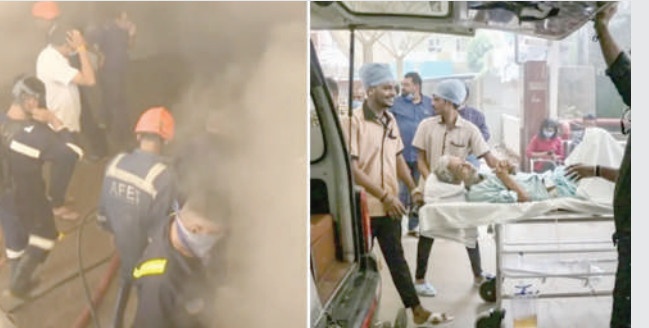
શાહીબાગમાં આવેલ રાજસ્થાન હોસ્પિટલમાં વહેલી સવારે અચાનક આગ લાગી ગઈ હતી. જેના કારણે દર્દીઓને બીજી જગ્યાએ શિફ્ટ કરવામાં આવ્યા હતા.