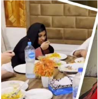
1 ઈસ્લામાબાદ, તા.૨૯ |

અંજુએ ભારતીય પતિ પાસે છૂટાછેડા માગ્યા, સીમા અંગે દ્વીધા યથાવત