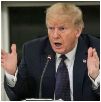
1 વોશિંગ્ટન, તા.૨૯ |

એક પછી એક કેસના લીધે ડોનાલ્ડ ટ્રમ્પના ચૂંટણી લડવા સામે શંકા