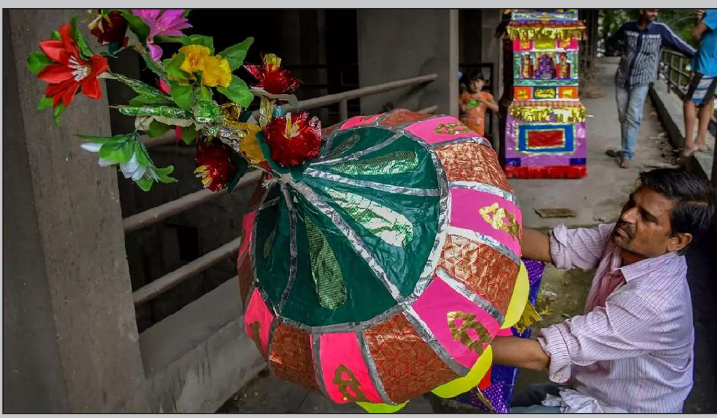
સમગ્ર દેશમાં જ્યા તાગ્રિયા મોહરમની તેચારીઓ ચાલી રહી હતી ત્યા નાગપુરમાં કારીગર દ્વારા 'તાગ્રિયા' બનાવવામાં આવી રહ્યા હતા...