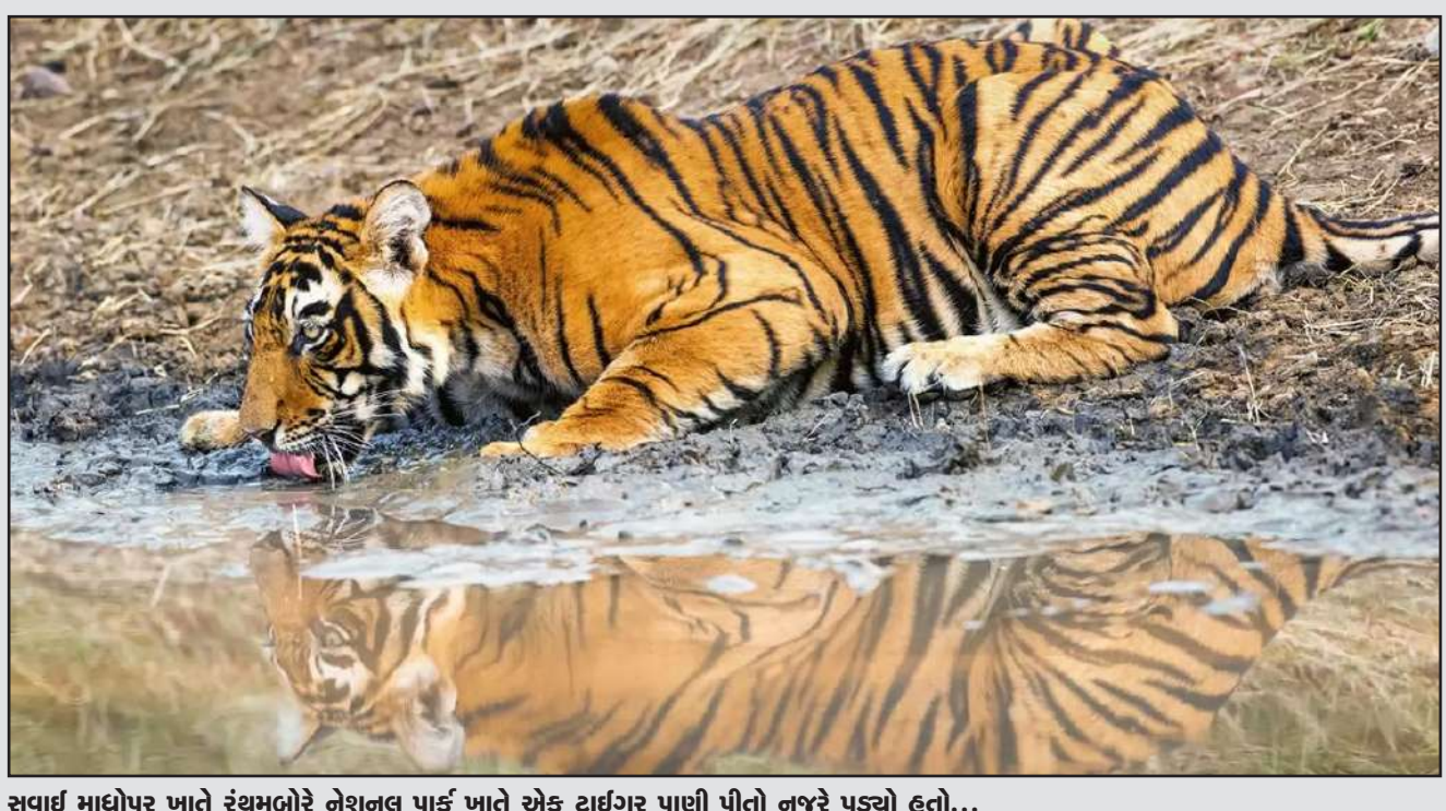
સવાઈ માધોપુર ખાતે રંથમબોરે નેશનલ પાર્ક ખાતે એક ટાઈગર પાછી પીતો નજરે પડ્યો હતો...