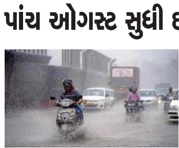
અમદાવાદ, તા.૨૬ | હવામાન વિભાગની આગાહી મુજબ શનિવારે વલસાડ, દમણ, દાદરા નગર હવેલીમાં ભારેથી અતિભારે, સાબરકાંઠા, અરવલ્લી, નવસારી, તાપી, જૂનાગઢ, અમરેલી, ભાવનગર, ગીર સોમનાથમાં ભારે જ્યારે રવિવારે વલસાડ, નવસારી, દમણ, દાદરા નગર હવેલીમાં ભારેથી અતિભારે, સુરત, તાપી, ડાંગમાં ભારે વરસાદ પડી શકે છે. જો કે હાલની સ્થિતિએ રાજ્યમાં સોમવારથી બુધવાર ભારે વરસાદની સંભાવના નહિવત છે. ફરી એકવાર ચોમાસાની આગાહી

નવસારી જિલ્લાની નદીઓ ભારે પાણીથી ગાંડીતૂર બની છે. મોડી રાતથી દક્ષિણ ગુજરાતના વિવિધ જિલ્લાઓમાં અતિભારે વરસાદ વૃદ્ધિ પડ્યો છે. જેમાં સૌથી વધુ વરસાદ નવસારી જિલ્લામાં જોવા મળ્યો. નવસારી જિલ્લાની નદીઓ ભારે પાણીથી ગાંડીતૂર બની છે. પુર્ણા, અંબિકા અને કાવેરીમાં ઘોડાપૂર જેવી સ્થિતિ ઉદભવી છે. પુર્ણા નદી ભયજનક સપાટીથી માત્ર એક ફૂટ દૂર છે. તો અંબિકા નદી ભયજનક સપાટીથી ત્રણ ફૂટ દૂર છે. કાવેરી નદી ભયજનક સપાટીથી છ ફૂટ દૂર છે. પાણી ભરાઈ જતા નવસારી શહેરના નીચાણવાળા વિસ્તારો એલર્ટ કરાયા છે. જિલ્લાની શાળા અને કોલેજોમાં રજા જાહેર કરાઈ છે. નવસારી શહેરમાં રાત્રી દરમિયાન ભરાયેલા વરસાદના પાણી ઉતાર્યા બાદ પૂરનો ખતરો તોળાઈ રહ્યો છે. જિલ્લાનું વહીવટી તંત્ર પરિસ્થિતિને પહોંચી વળવા માટે સુસજ્જ બન્યું છે.