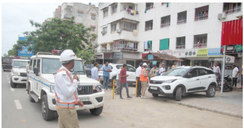
ઉત્તર-પશ્ચિમ ઝોનમાં કેશવભાગથી માનસી સર્કલ, જજીસ બંગલોથી પકવાન ચાર રસ્તા અને ઈસ્કોન ચાર રસ્તાથી ગોતા ચાર રસ્તા થઈ વૈષ્ણોદેવી સર્કલ સુધીના રોડ પર ગઈ કાલે મ્યુનિસિપલ કોર્પોરેશનના એસ્ટેટ વિભાગે ખાસ અભિયાન હાથ ધર્યું

અમદાવાદ, તા. ૨૭ | અમદાવાદ શહેરમાં ટ્રાફિકના પ્રશ્નો દિન-પ્રતિદિન વિકટ બનતા જાય છે. વસ્તીનાં પ્રમાણમાં અંગત વાહનોનો વપરાશ સતત વધતો જતો હોઈ વિશાળ રોડ પણ સાંકડા પડી રહ્યા છે. જોકે અનેક વાહનચાલકો રોડ પર આડેધડ પોતાનાં વાહન પાર્ક કરીને ઓફિસના કામે કે શોપિંગ માટે નીકળી જતા હોઈ રોડ વધુ સાંકડા થાય છે. જોકે મ્યુનિસિપલ કોર્પોરેશનના સત્તાવાળાઓએ ટ્રાફિક જામની સમસ્યાનાં નિરાકરણ માટે ગેરકાયદે પાર્કિંગને લગતા હોટસ્પોટને ટાર્ગેટ કર્યા છે અને ખાસ કરીને ઉત્તર-પશ્ચિમ ઝોનમાં તંત્રએ આવા હોટસ્પોટ પરથી દબાણ દૂર કરીને લોકોને હાશકારો આપ્યો