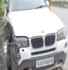
જોકે આ અકસ્માત કોઈ જાનહાનિ થઈ નહોતી. નબીરા વાહનચાલકની અટકાયત કરવામાં આવી હતી. અમદાવાદમાં સ્થઈ કાર ચાલકે દારૂના

અમદાવાદમાં વધુ એક નબીરાએ અકસ્માત સર્જ્યો હતો. મળતી જાણકારી અનુસાર, અમદાવાદમાં વધુ એક નબીરાએ અકસ્માત સર્જ્યો હતો. શહેરના માણેકબાગ વિસ્તારમાં બીએમડબલ્યુ કાર ચાલકે અકસ્માત સર્જ્યો હતો. GJ-01-KA-6566 નંબરની BMW કારે અકસ્માત સર્જ્યો હતો. જજીસ બંગલોથી માણેકબાગ વચ્ચે નશામાં ધૂત BMW કાર ચાલકે અકસ્માત સર્જ્યો હતો.